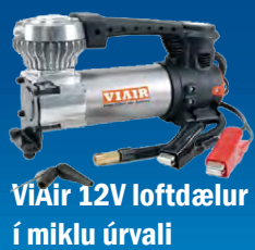
VIAlr 12V loftdælur í miklu úrvali