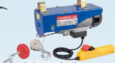
Rafmagnsvirtaliur í miklu úrvali