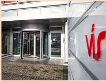
Hlutur VÍS í Kviku í dag er metinn á um 3,3 milljarða.

Annar stór hluthafi í Kviku sem hefur verið að selja bréf sín frá því að bankinn fór á markað