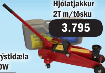
Hjólattjakkur 2T m/tösku