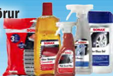
Sonax hreinsivörur á frábæru verði