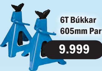
6T Búkkar 605mm Par