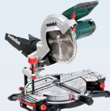
Metabo KS216 bútsög