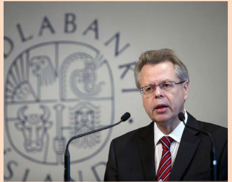
Már Guðmundsson seðlabankastjóri og fleiri embættismenn í bankanum eru sakaðir um að hafa borið á menn rangar sakir.