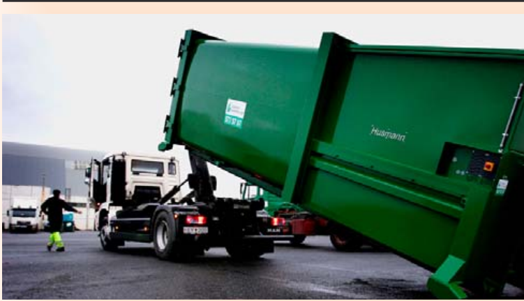
Velta Íslenska gámafélagsins hefur nærri tvöfaldast frá 2012.