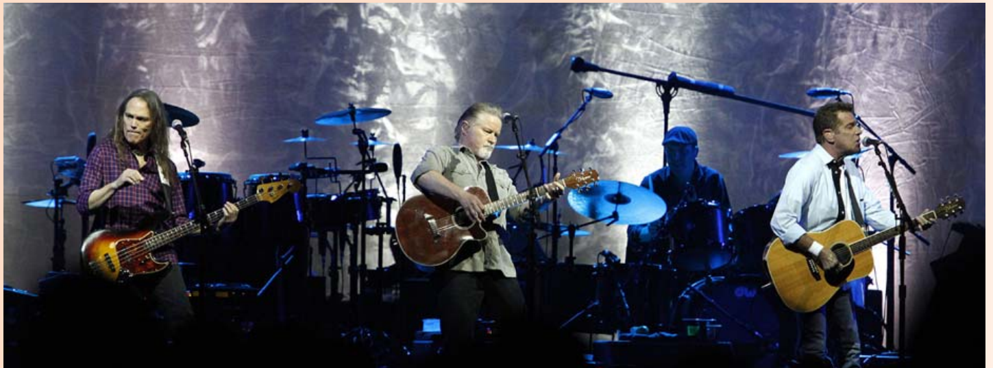
Fyrstu stóru tónleikarnir sem haldnir voru á Íslandi eftir hrun voru hljómléikar Eagles árið 2011. Sena Live stóð að tónleikunum og skipuleggur nú yfir 20 viðburði á ári.

Samkeppniseftirlitið tók dræmt í þær hugmyndir.