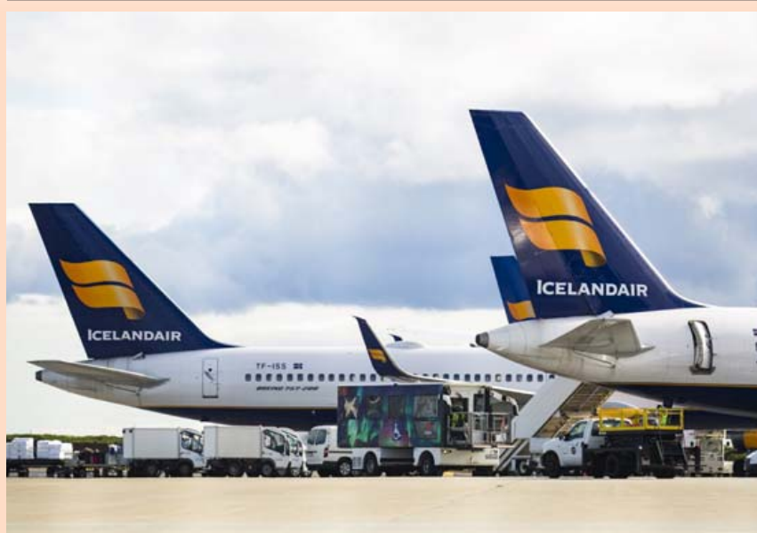
Verð hlutabréfa í Icelandair Group hefur lækkað um meira en helming frá áramótum.

Netfang auglýsingaeldar auglysingar@frettabladid.is Veffang frettabladid.is