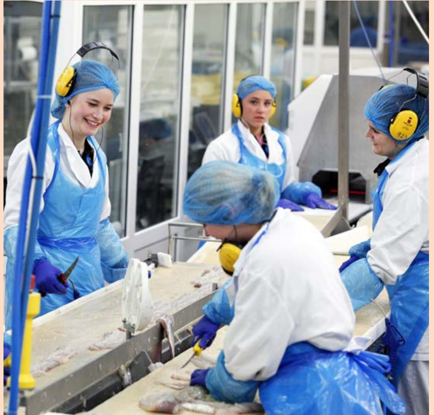
Samkeppniseftirlitið telur að tilkynningarskyldur samruni kunni að hafa átt sér stað þegar útgerðarfyrirtækið Brim eignaðist kjölfestuhlut í HB Granda í vor. Hann hafi ekki verið tilkynntur til Samkeppniseftirlitsins.