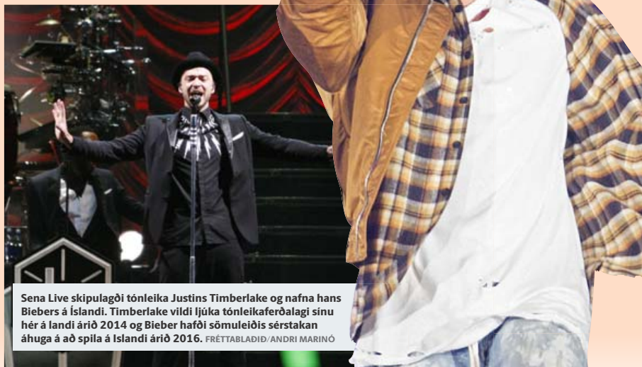
Sena Live skipulagði tónleika Justins Timberlake og nafna hans Biebers á Íslandi. Timberlake vildi ljúka tónleikaferðalagi sínu hér á landi árið 2014 og Bieber hafði sömuleiðis sérstakan áhuga á að spila á Íslandi árið 2016.

Af þeim sökum var meðal annars fjárfest í tónlistarvefnum tonlist.is og hljóðbókafyrirtækinu Skynjun, sem nú er orðið að hinu sænska Storytel. Sömu leiðis var reynt að kaupa Miða.is en