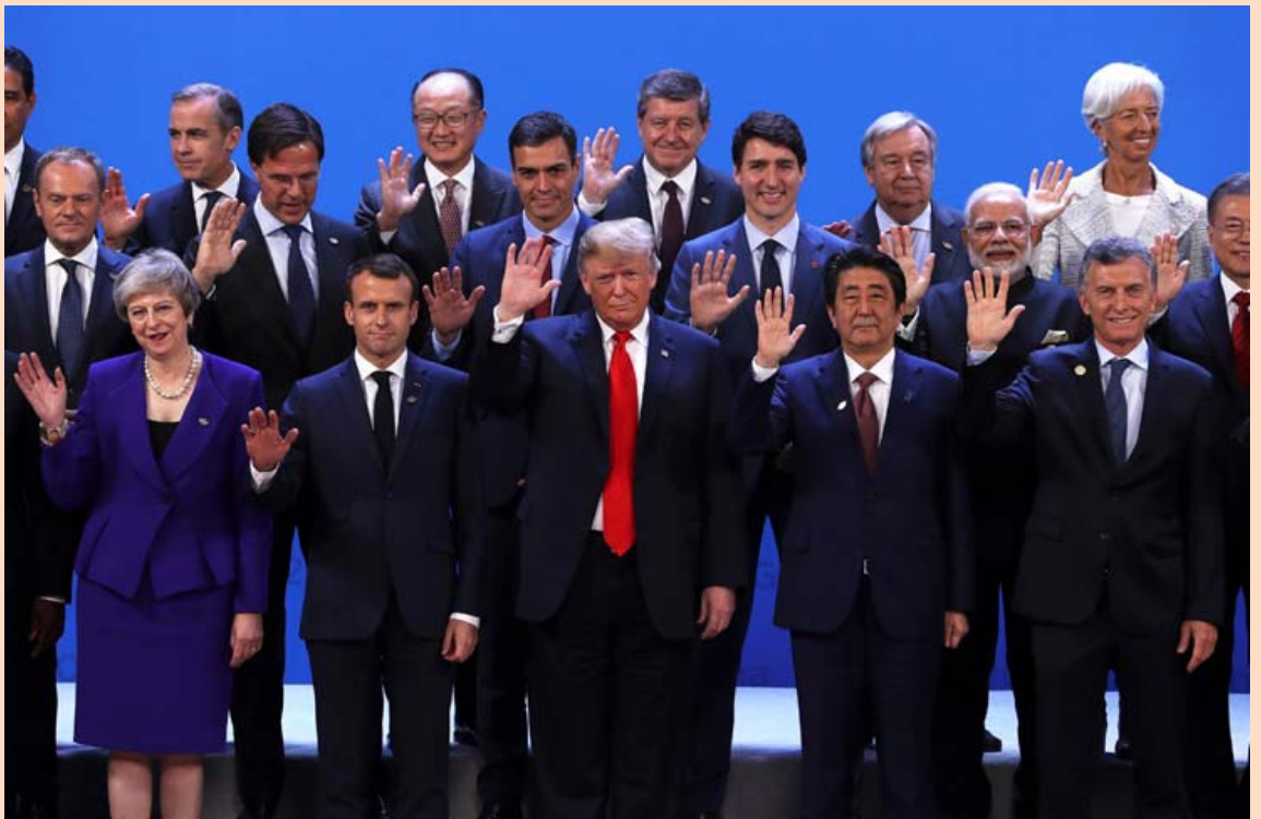
Leiðtogar tuttugu helstu iðnríkja heims voru á G20-ráðstefnunni sem fram fór í Buenos Aires í Argentínu um síðustu helgi. Eftir langar og strangan viðræður náðu þeir samkomulagi um sameiginlega yfirlýsingu um að endurskipuleggja starfsemi Alþjóðaviðskiptastofnunarinnar og skerpa á leikreglur um í alþjóðaviðskiptum. Donald Trump Bandaríkjaforseti fagnaði yfirlýsinguinni en hann hefur gagnrýnt stofnunina harðlega.