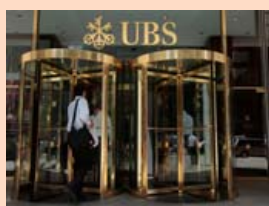
UBS hyggst efla starfsemi sína í Kína.

Erlendir bankar og aðrar fjármálastofnanir hafa um langt skeið leitað við að styrkja stöðu sína á kínverskum fjármálumarkaði en mætt nokkurri mótstöðu af hálfu stjórnvalda í Kína. Breytingar hafa