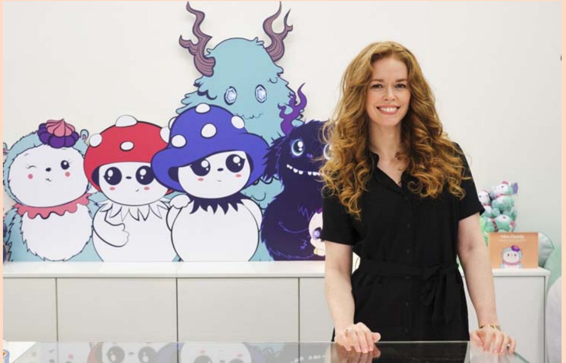
Helga segir tækifæri Tulipop mörg og því sé forgangsröðun ein helsta áskoranin.

Það eru allar áskoranirnar, fjölbreytnin og það að hafa tækifæri til að hrinda nýjum og skemmtilegum verkefnum í framkvæmd á hverjum degi í samstarfi við frábært samstarfsfólk. Við höfum átt því láni að fagna að hafa fengið einstaklega gott fólk til liðs við félagið og hjá Tulipop starfar öflugt teymi á skrifstofum okkar í Reykjavík og í NY. Auk þess