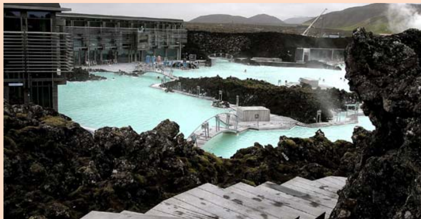
Tekjur Bláa lónsins námu 102 milljónum evra í fyrra og jukust um 25 milljónir evra frá fyrra ári.

Má Jóhannssyni, með 1,6 prósent hlut. Fyrir sameiningu átti Helgafell í olíufélaginu en Brekka Retail í matvörukeðjunni. Síðastliðinn mánuð hefur gengi félagsins lækkað um sjö prósent en lítið aftur um tvö ár hefur ávöxtunin verið 20 prósent með arðgreiðslu í mars 2017. Úrvalsvisitalan hefur á sama tíma lækkað um tíu prósent. – hvj