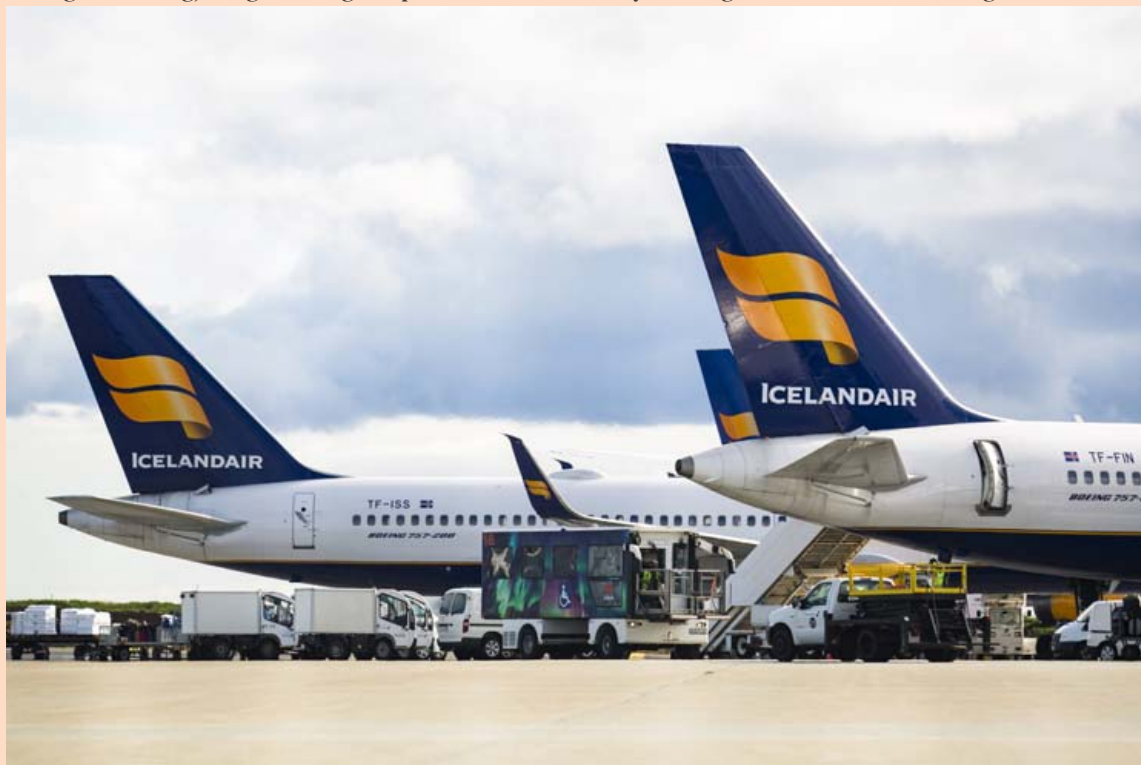
Stjórnendur Icelandair Group hafa frá því í byrjun októbermánaðar átt í viðræðum við eigendur skuldabréfa félagsins um skilmála að baki skuldabréfa-útgáfunni. Icelandair Group braut skilmálana fyrir í haust. Flugfélagið áformar að greiða upp þriðjung af eftirstöðvum bréfanna í janúar.