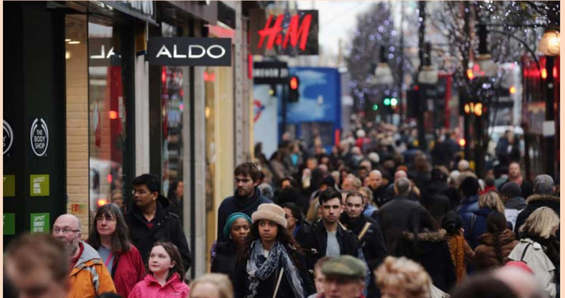
Margar breskar verslanakeðjur hafa átt erfitt uppráttar undanfarna mánuði. Breytt samkeppnisumhverfi, með aukinni netverslun, minna trausti neytenda og breyttri hegðun nýrrar kynslóðar, hefur valdið því að ýmsar rótrónar verslanir hafa þurft að leita leiða til þess að hagræða í rekstri.