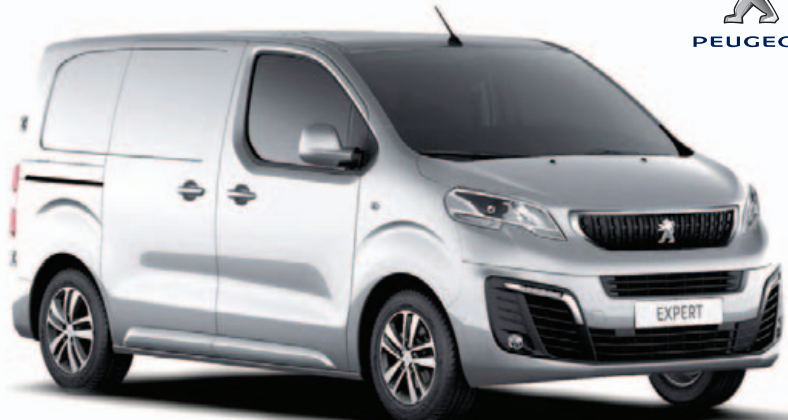
PEUGEOT EXPERT L2 millilangur verð frá 3.540.322 kr. án vsk. L3 langur verð frá 3.669.355 kr. án vsk.