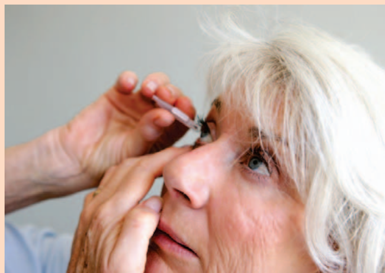
Lyfjapróunarfyrirtækið Oculis hefur þróað augndropa sem koma í stað augnástungu við meðferð sjúkdóma í augnum.

Samhliða hlutafjárútkningunni í byrjun síðasta árs var ákveðið að