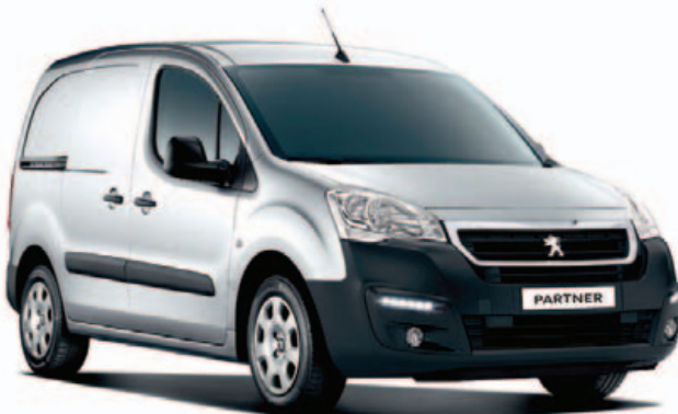
PEUGEOT PARTNER Verð frá 2.209.667 kr. án vsk