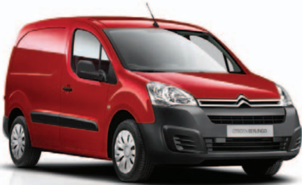
CITROËN BERLINGO Verð frá 2.250.000 kr. án vsk.