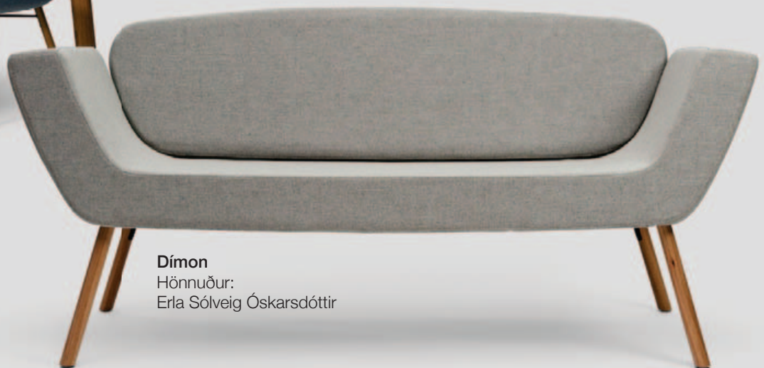
Dímon Hönnuður: Erla Sólveig Óskarsdóttir