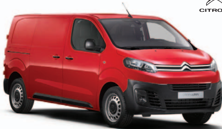
CITROËN JUMPY M millilangur Verð frá 3.137.097 kr. án vsk.