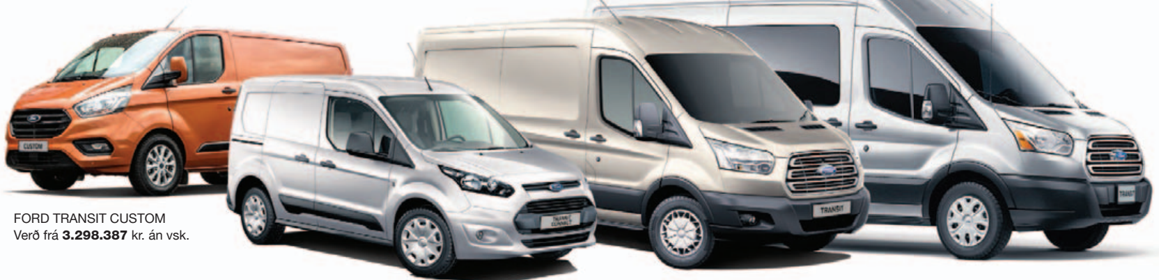
FORD TRANSIT CUSTOM Verð frá 3.298.387 kr. án vsk.