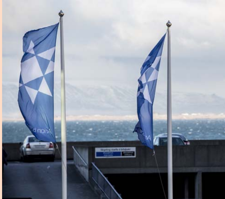
Skuldbreyting Arion banka nam nærri 10 prósentum af heildarstærð skuldabréfaútgáfu WOW air síðasta haust.

Verulegrar óánægju gætir á meðal margra stórra fjárfesta sem raunverulega lögðu WOW air til nýtt fjármagn í útboðinu, meðal annars bandaríski fjárfestingarsjóðurinn Eaton Vance og íslenska fjármálaframtækiaðili GAMMA Capital Management, enda hefðu þeir að líkindum ekki gert það ef fyrir hefði legið að stærstur hluti fjárhæðarinnar sem þar safnaðist hafi aðeins verið umbreyting á kröfum í skuldabréf. Engar slíkar upplýsingar hafi verið veittar í fjárfestakynningum né þegar greint var frá niðurstöðum útboðsins.