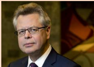
Már Guðmundsson seðlabankastjóri.