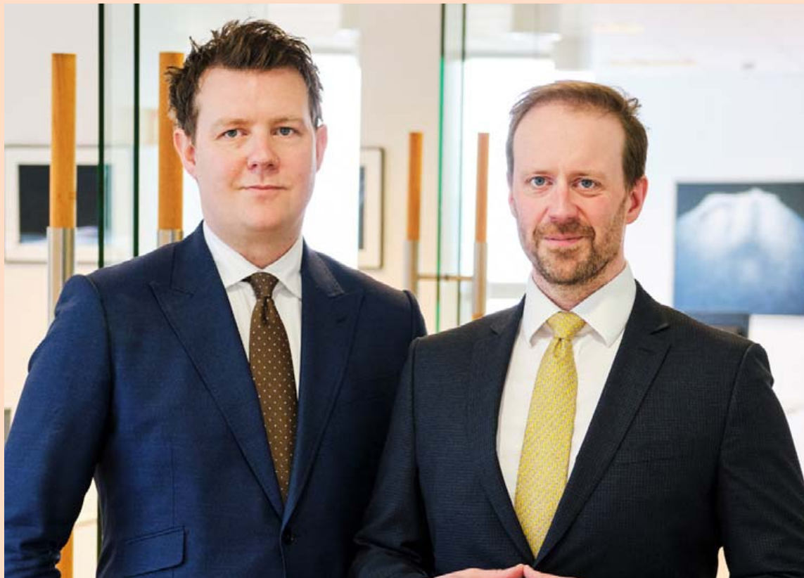
Framkvæmdastjórn SA og SI segja önnur mál en þriðja orkupakkann eiga að vera í forgrunni.

Sigurður bætir við að stjórnvöld, án atbeina Alþingis, geti veitt heim-