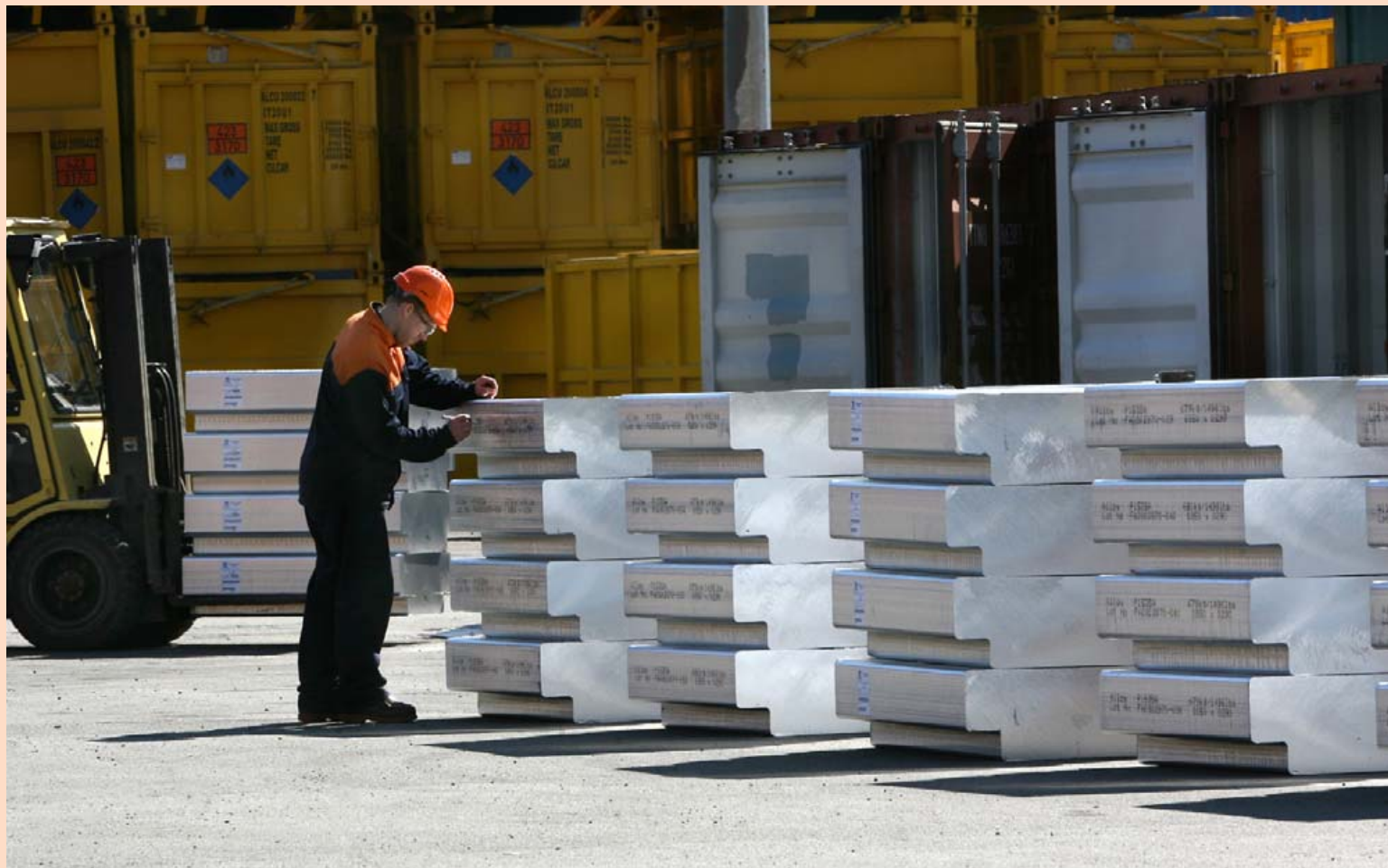
Álverin sem verið er að byggja í Kína og Miðausturlöndum eru umtalsvert stærri en álverin á Íslandi, að sögn forstjóra Alcoa Fjarðaáls.

„Í samkeppnislöndum eins og Noregi er þessi kostnaður niðurgreiddur. Áliðnaður á Íslandi