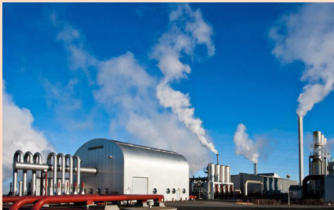
Áætlaðar tekjur HS Veitna á þessu ári eru rúmlega 7,4 milljarðar króna