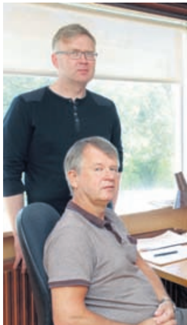
Kerfið er íslensk smíði sem Þróunarteymi Reglu hefur unnið í samstarfi við notendur og bókhaldsstofur undanfarin ár. MYNDVALLI

bjóða upp á bókhald á netinu í áskrift. „Þegar búíð er að greiða áskriftargjaldið er hægt að skrá sig inn í kerfið úr hvaða tölvu sem er, hvar sem er í heiminum. Einnig geta margir unnið samtímis í kerfinu hver á sínum staðnum. Notandinn getur skrifað reikning á einum stað á meðan bókarinn vinnur í bókhaldinu og launa-