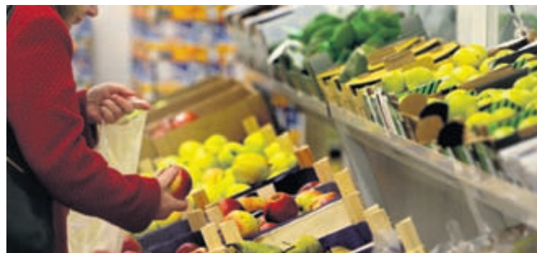
Matarinnkaup eru einn stærsti liður í heimilisbókhaldi flestra heimila.

Á vef Reglu er hægt prófa þrjátíu daga ókeypis áskrift. Þannig er öllum frjálst að reyna kerfið án skuldbindinga áður en áskrift er keypt.