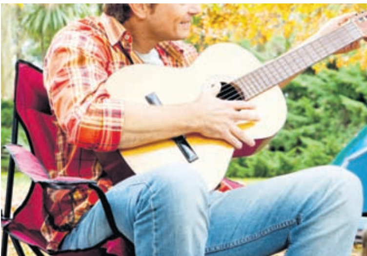
Ekki taka gítar sem kostar meira en tölvan ykkar nema þið hafið góðan stað til að geyma hann.

Nauðsynlegt er að hafa drykki og mat í tjaldinu til að geta gætt sér á um morguninn og ekki ósniðugt að vera með Treo við höndina ef timburmennirnir ákveða að koma í heimsókn. Ekki taka með flottu fötin og skóna, gúmmítúttur og gamlir strigaskór eiga að duga. Taktu það sem má eyðileggjast, þetta er ekki tískusýning.