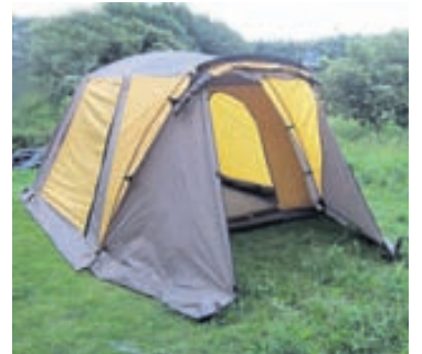
Dæmi um fjögurra manna tjald.

Þar verður einnig stórt grill sem viðskiptavinir geta fengið afnot af auk þess sem hægt verður að hlaða síma.