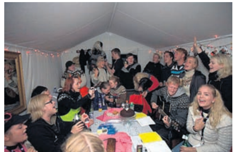
Það er alltaf rifandi stemning í Látratjaldinu og hvergi skortur á gítarleikurum.