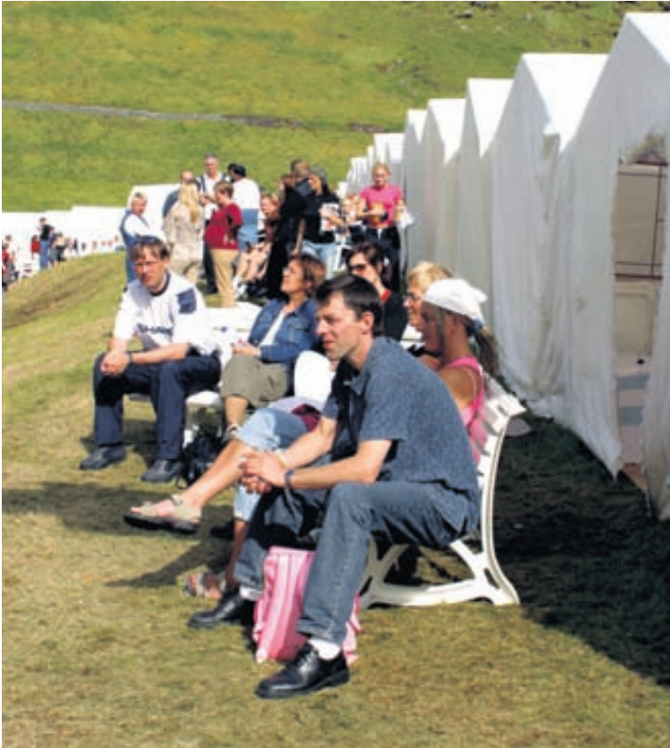
Eyjammenn setja svip sinn á Herjólfssdal með tjaldbúðum sínum. Þessi mynd var tekin fyrir nokkrum árum í bláviðri sem þá einkenndi hátíðina.