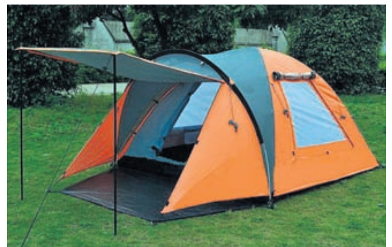
Boðið er upp á þrjár gerðir tjalda. Hér má sjá tveggja til þriggja manna tjald.

Hægt er að kaupa tryggingu með tjaldinu á aðeins 1.000 krónur en hún nær þó ekki yfir það ef leigjandinn fremur skemmdarverk af ásetningi.