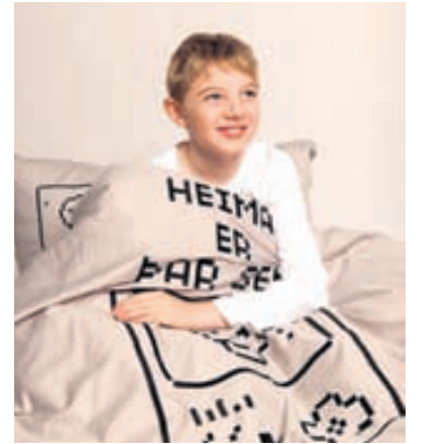
Lín Design selur gott úrval sængurvera fyrir börn og unglinga.

Jólaþemað í ár hjá Lín Design er að sjálfsögðu íslensk jól en allt sem verslunin lætur framleiða er eftir íslenska hönnuði. „Þá erum við sérstaklega að ræða um Grýlu og Leppalúða og syni þeirra sem eru