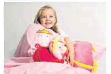
Falleg sængurver fyrir yngstu börnin.

allir nefndir með nafni. Um er að ræða dúka, svuntur, jólasokka auk margs annars, til dæmis flöskupoka sem nefnist „Mjöður Leppalúða“ og „Seyður Grýlu“ og er tilvalið að stinga jólavíninu í hann til að vekja íslenska jólastemmingu.“