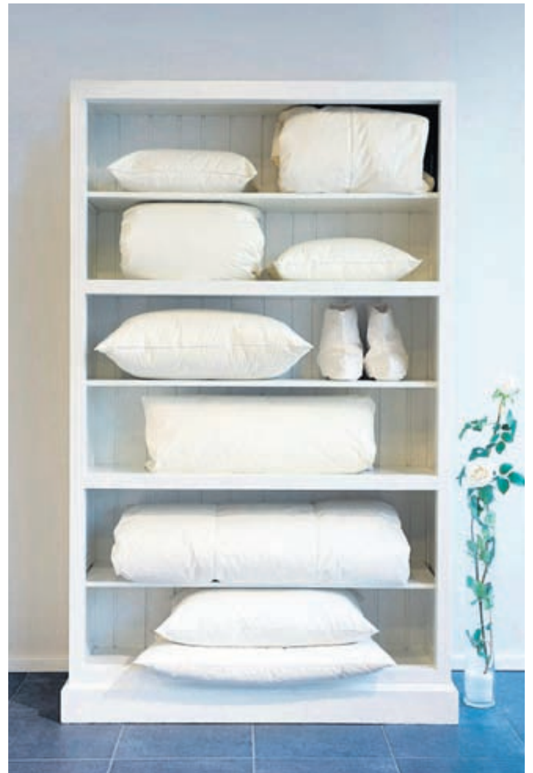
Í Dúni og fiðri má fá hlýjar og eigulegar jólagjafir.

Dún og fiður framleiðir æðardúnssængur eingöngu eftir pöntunum. Aðrar dúnsængur eru fyrirbyggjandi á lager í fimm ákveðnum stærðum en aðrar stærðir eru framleiddar samkvæmt óskum viðskiptavina. Kottar eru fyrirbyggjandi á lager í fjórum stærðum. Eins og með sængur eru kottar framleiddir í öðrum stærðum að ósk viðskiptavina. Púðar eru einungis framleiddir samkvæmt pöntunum en pullur eru fáanlegar í stærðinni 18x50 sentimetrar.