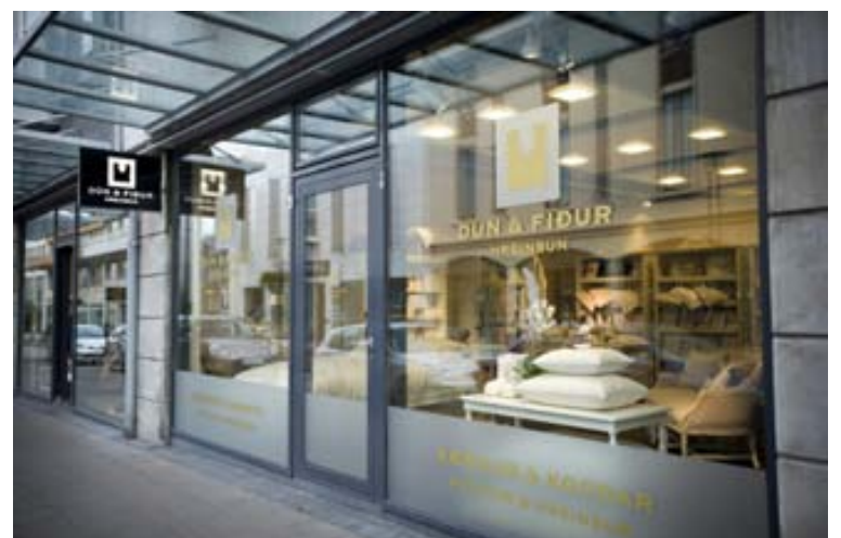
Dún og fiður hefur með áratuga starfsemi skapað sér fastan sess í hugum borgarbúa og annarra landsmanna. Verslunin er til húsa á Laugavegi 86.