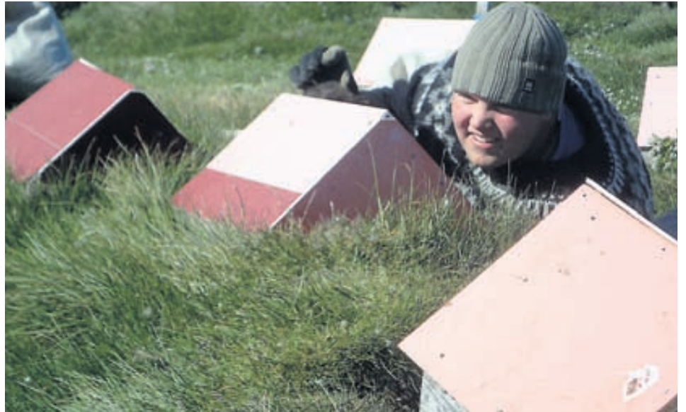
Um 1.200 húsum er komið fyrir úti í Landey fyrir æðarkollurnar og er það sennilega fjölmennasta byggðin á svæðinu.