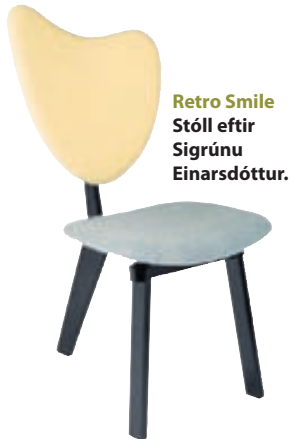
Retro Smile Stóll eftir Sigrúnu Einarsdóttur.