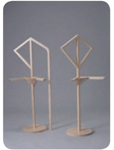
Fengur Fatastandur eftir Fanneyju Long.