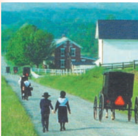
Amish í Iowa

Flug með Icelandair til Minneapolis. Átta daga ferð um nýlendur Amish í Minnesota og Iowa og Íslendinga í Minnesota.