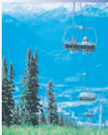
Whistler í Kanada

Ferð 2: Vesturströnd: 29.ágúst – 7.september