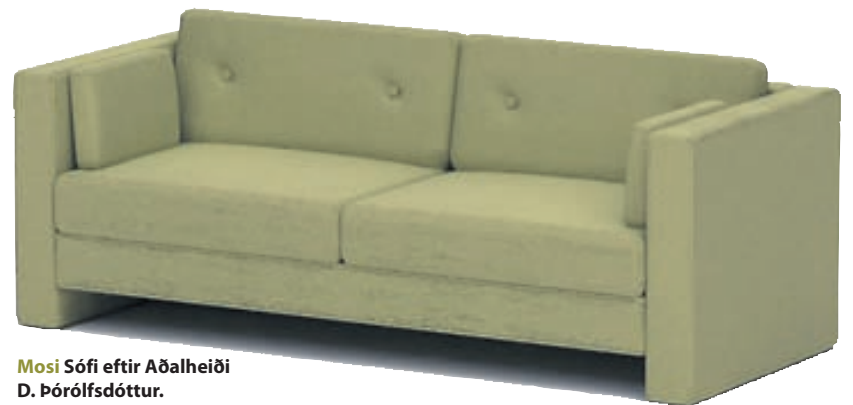
Mosi Sófi eftir Aðalheiði D. Þóroldsdóttur.