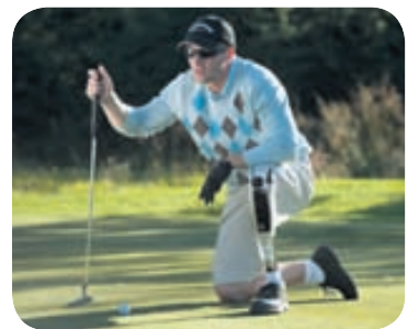
Gestum gefst á sýningunni kostur á að kynna sér margrómaða hönnun Össurar.

búsettir erlendis gagnert til þess að vera með, sem gefur sýningunni sérstaka breidd.