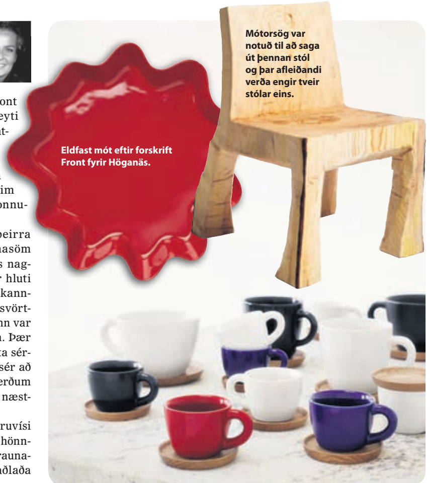
Eldfast mót eftir forskrift Front fyrir Höganäs.

Mótorsög var notuð til að saga út þennan stól og þar afleiðandi verða engir tveir stólar eins.