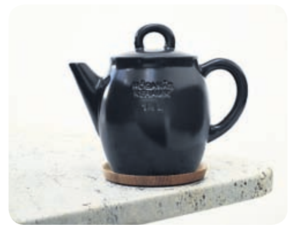
Fallegur tektill sem svipar til hinnar þekktu Höganäs-krukku.

En annað kom á daginn. Í fyrria bað keramikfyrirtækið Höganäs í suðurhluta Svíþjóðar Front að vinna með gamalkunn form hinnar þekktu Höganäs-krukku. Úr varð einstaklega vel heppnað keramikstall og sýndu stúlkurnar að þær geta svo sannarlega unnið hefðbundið verkefni út frá sterkum markaðslegum óskum. Einnig