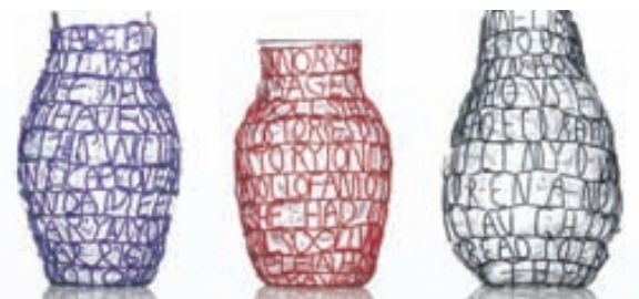
Orð úr perlum frá afrískum konum.

Mótorsög var notuð til að saga út þennan stól og þar afleiðandi verða engir tveir stólar eins.