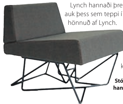
Stóll úr smíðju David Lynch sem hann hannaði sérstaklega inn í Silencio.

Silencio verður opinn alla daga frá sex síðdegis til sex árdegis. Fram til miðnætis er hann einvörðungu opinn fyrir félagu í klúbbnum og gesti þeirra.