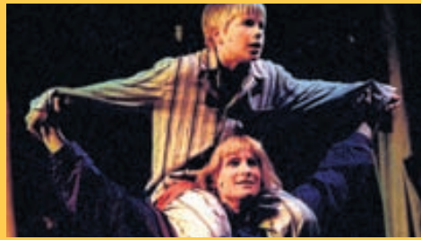
Bróðir minn Ljónshjarta er hugljúfasta bræðrasaga allra tíma.