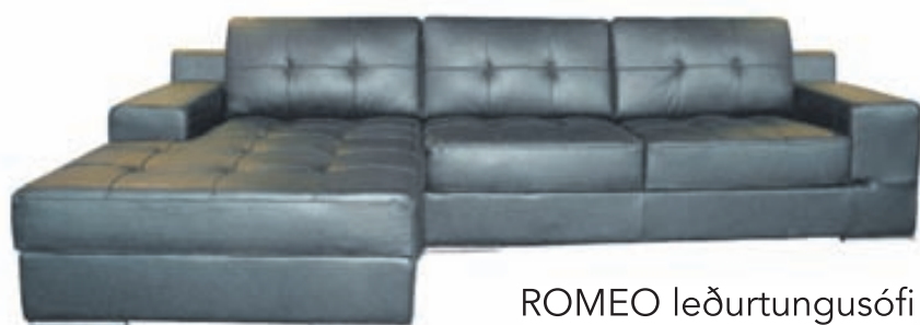
ROMEIO leðurtungusófi Stærð: 320X165 Verð: 328.000,-