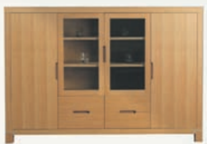
HETTHI Eikarskenkur Stærð: 180X45XH:125cm Verð: 195.000,-