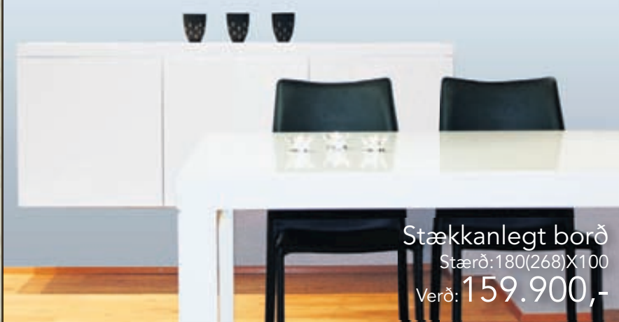
Stækkanlegt borð Stærð: 180(268)X100 Verð: 159.900,-

Opið mán-fös: 10:00 - 18:00 Opið um helgina: Lau 10.00-16.00 - Sun: 10.00-16.00