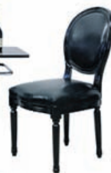
RONNE stóll Verð: 29.900,-