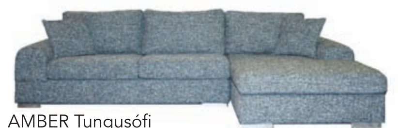
AMBER Tungusófi Stærð: 290X165 Tilboðsverð: 205.700,-