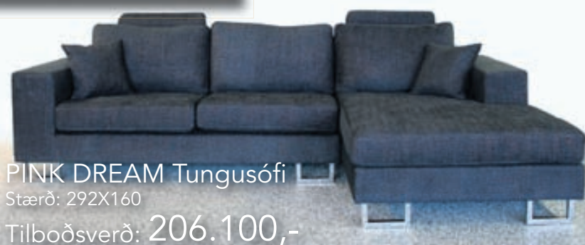
PINK DREAM Tungusófi Stærð: 292X160 Tilboðsverð: 206.100,-