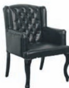
CHANARAL armstóll Verð: 39.900,-