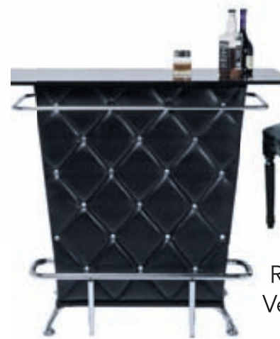
BAR Lady Rock Verð: 105.000,-