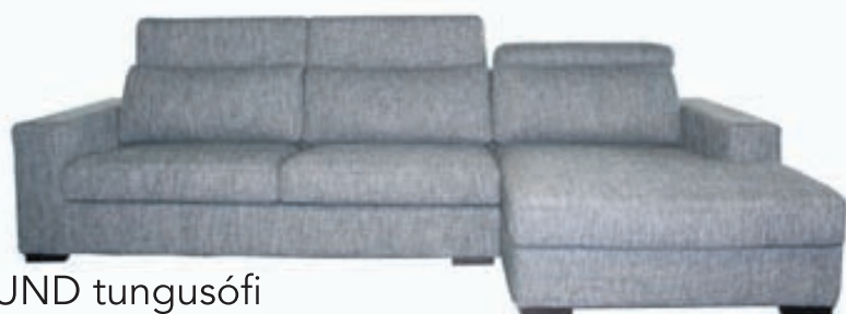
KUND tungusófi Stillanlegir höfuðpúðar Stærð: 303X168 Tilboðsverð: 238.500,-