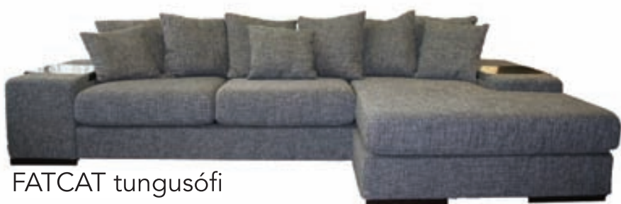
FATCAT tungusófi Færanleg tunga Stærð: 320X165 Tilboðsverð: 219.600,-