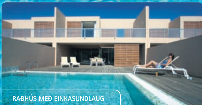
RADHÚS MEÐ EINKASUNDLAUG