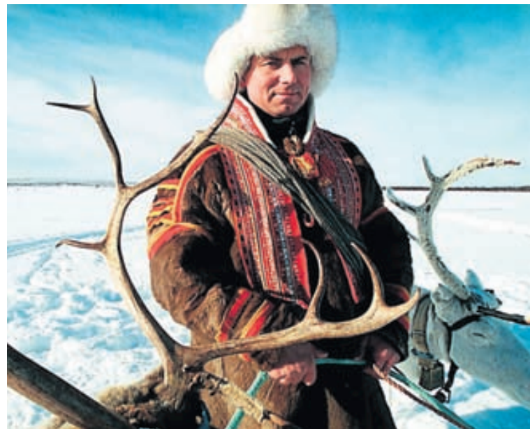
Annar heimur Rækilega er sagt frá lífnaðarháttum Sama á nýju vefsíðunni.

Saga Norðurlandanna fær verðugan sess og hægt er að hlusta á á lýsingar af blóðugum bardögum og hetjudáðum frá ýmsum tímum. Einnig er landafræðinni gert hátt undir höfði og sagt frá þúsund vatna landinu Finnlandi, eldfjöllum Íslands. Svíþjóð með sínum miklu skógum og fallega skerjagarði og flatlandinu Danmörku. Þá er efni helgað Sömum í norðurhluta Skandinavíu og mannlífina á Grænlandi, Álandi og í Færeyjum.