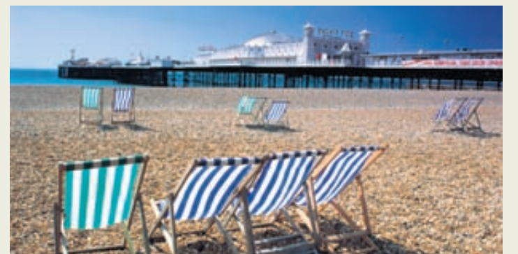
Á ströndinni í Brighton með tívólíð í bakgrunni.