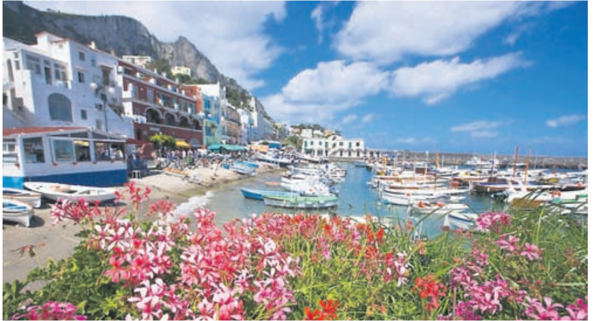
Hin undurfagra Capri er ógleymanleg öllum þeim sem þangað koma.