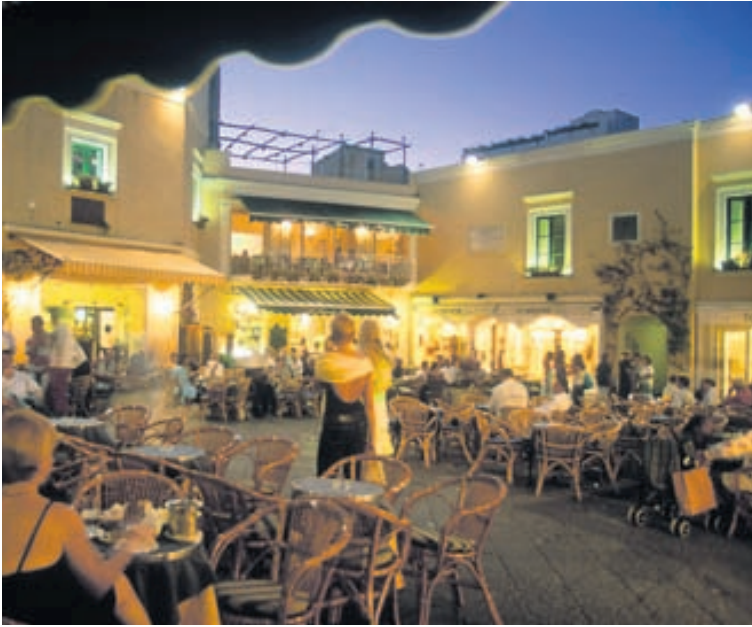
Hið fræga kaffihúsatorg, Piazzetta, á Capri.