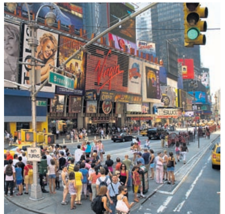
Hraðinn í stórborginni New York er mikill og íbúar þar þykja beinskeyttir og jafnvel ókurteisir.