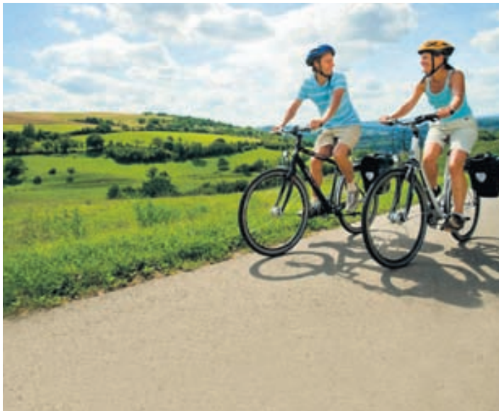
Hjólað er um eina fallegustu hjólaleið Þýskalands við rætur Alpanna sem gjarnan er kölluð „Panorama-hjólaleiðin“ eða útsýnsleiðin.