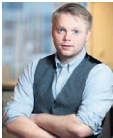
Daði segir borgarferðir nú vinsælar.

Daði segir því tilvalið að kíkja út á kvöldin og fá næturlífið beint í æð.