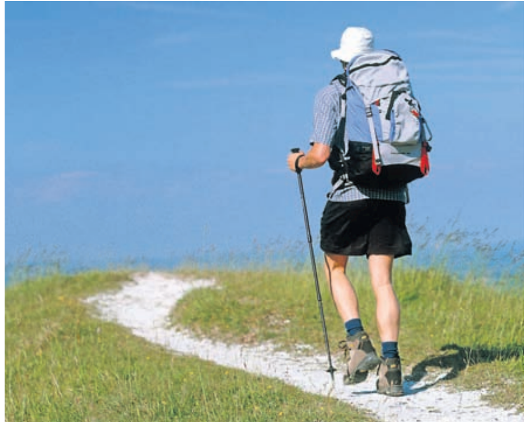
73 prósent bakpokaferðalanga leita eftir munnlegum ábendingum en 14 prósent nota samskiptavefi og smáforrit.