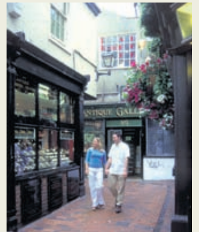
Þröngar og skemmtilegar götur eru í Brighton þar sem eru veitingahús og verslanir.

Á veturna er Brighton vinsæll háskólabær en á sumrin sækir fólk á ströndina. Helgarferðir eru vinsælar, þá er legið í sólbaði á ströndinni á daginn og veitingahúsin heimsótt á kvöldin. Brighton er stutt frá London og reglulegar lestarferðir á milli svo auðvelt er að skreppa þangað. Brighton hentar þeim sem vilja rólegra umhverfi en stórborgin býður upp á en engu að síður margt spennandi að gerast. Leikhús- og tónlistarlíf er liflegt. Í Brighton er tívólí niðri á bryggju og þangað sækja margir ferðamenn. Frá því í apríl er boðið upp á útsýnisferðir í tveggja hæða strætisvögnum. Leiðsögn er í gegnum heyrnartæki. Eitt af því sem vekur gjarnan athygli ferðamanna er Royal Pavillon sem Georg IV lét reisa. Höllin er byggð í indverskum stíl og hefur yfir sér ævintýralegan blæ. Auðvelt er að rata um Brighton og strætisvagnar eru stöðugt á ferðinni vilji menn fara í skoðunarferð með þeim.