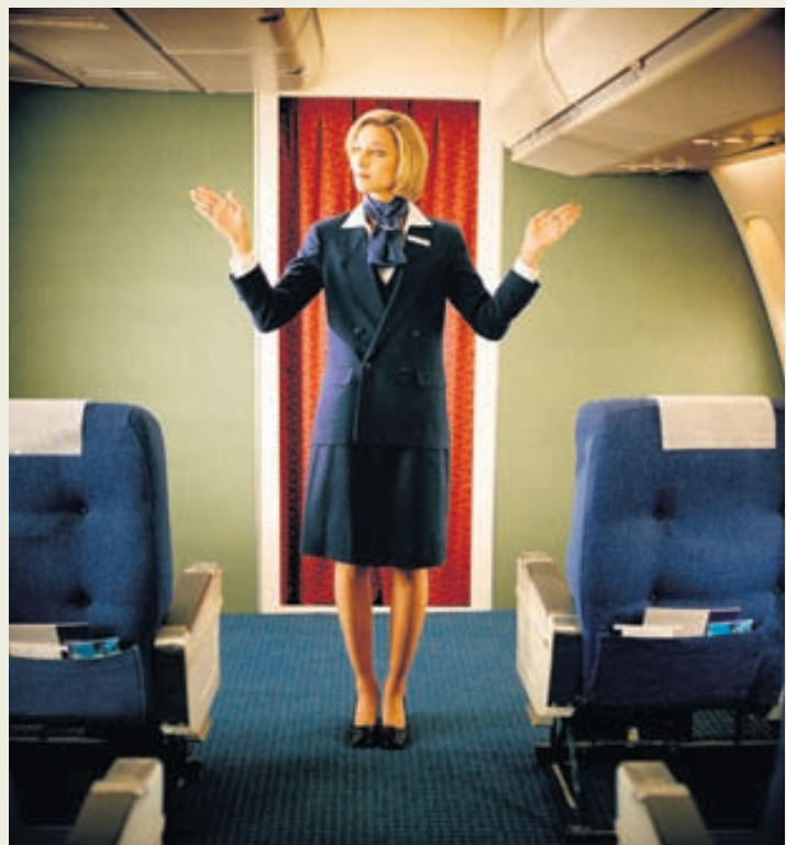
Flugþjónar og -freyjur þola ekki þegar fólk hunsar kynningar á öryggisatriðum.