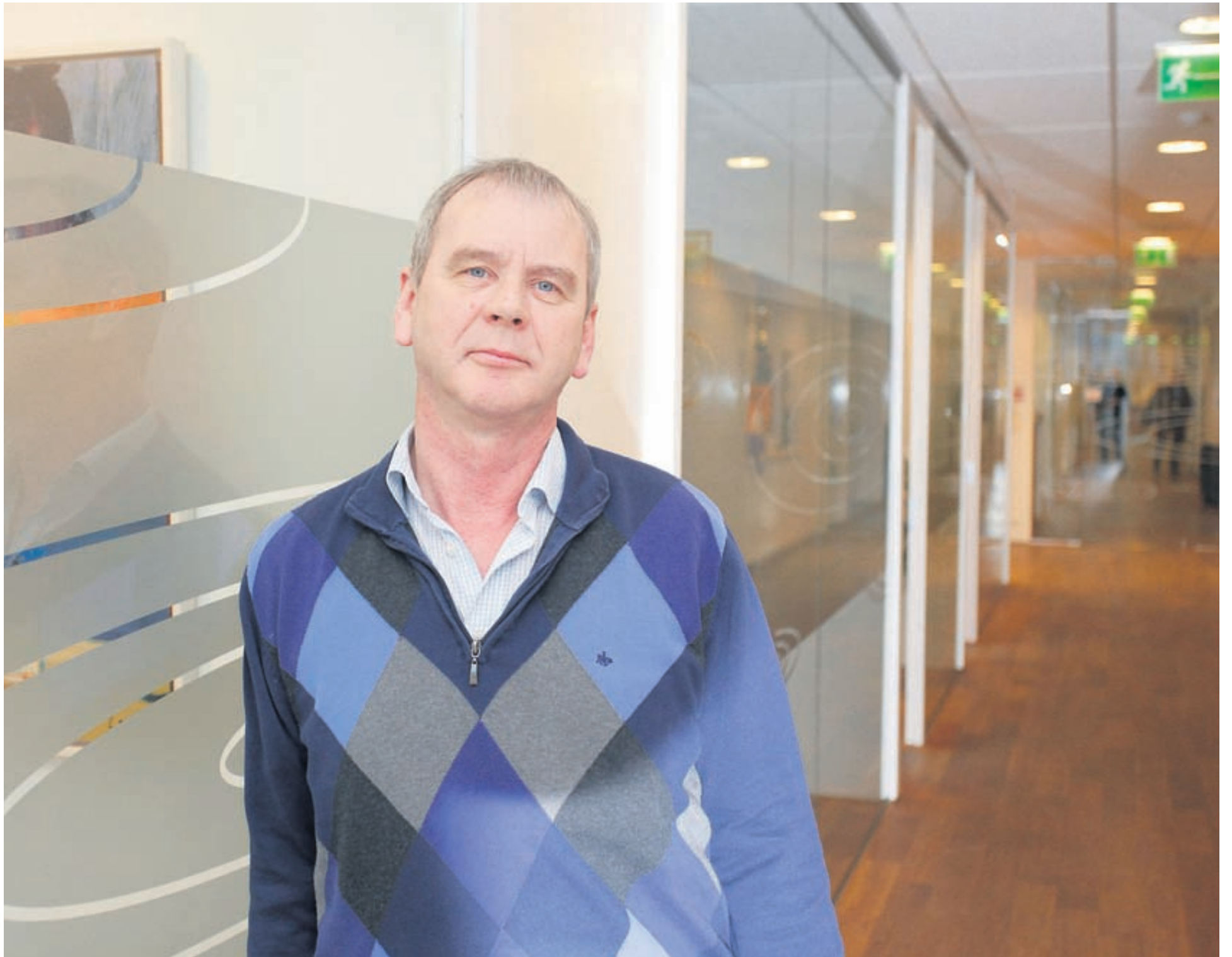
Bjarni hefur séð um hreinlætisáætlanir Olís í sautján ár. „Öll sjávarútvegsfyrirtæki, fiskvinnslur og skip þurfa að hafa hreinlætisáætlun til að fá vinnsluleyfi og flestir leggja mikinn metnað í þessi mál.“

Kynningarblað Námið, sjómennskan og þjónusta við sjávarútvegsfyrirtæki