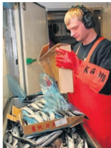
Tobis er beitusölufyrirtæki.