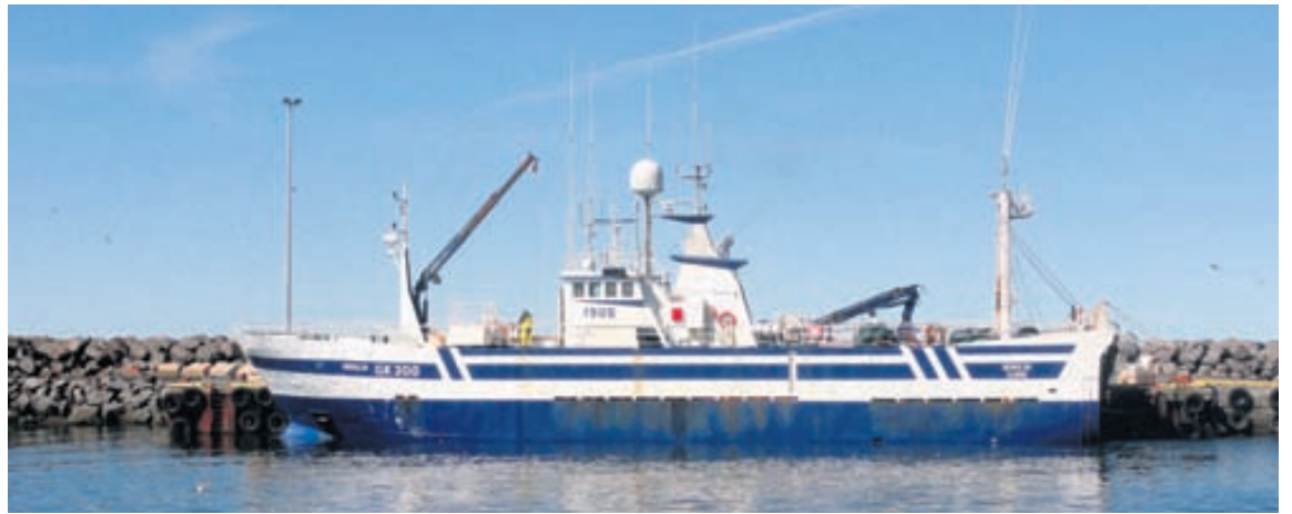
Sigurður er skipstjóri á Berglín GK-300.