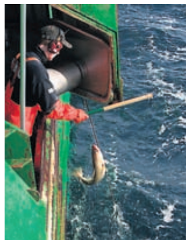
Fiskevegn-línan er vinsæl og vel metin.