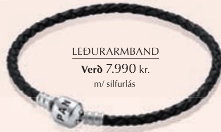
LEDURARM BAND Verð 7.990 kr. m/ silfurlás

Allar Pandora kúlur og viðhengi er hægt að setja á armbönd og hálskeðjur.