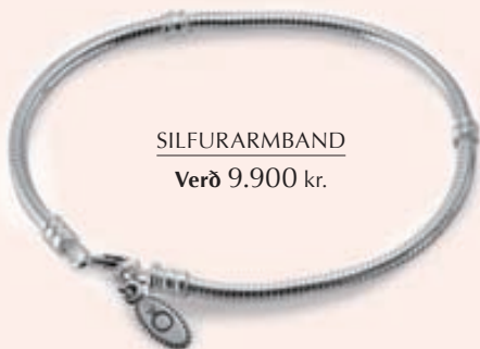
SILFURARM BAND Verð 9.900 kr.