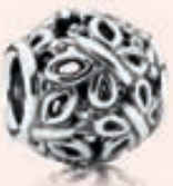
BLÓMAKÚLA – SILFUR Verð 3.990 kr.