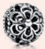
BLÓMAKÚLA – SILFUR Verð 3.990 kr.