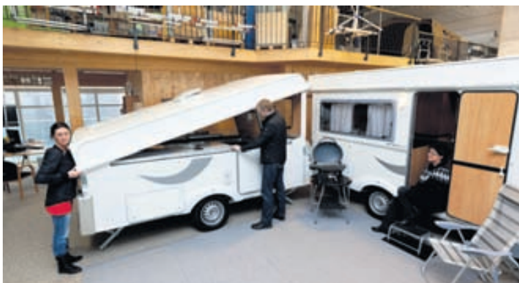
Esterella-fellihjólhýsin njóta mikilla vinsælda, meðal annars vegna glæsileika og vegna þess hversu þægileg í uppsetningu þau þykja.