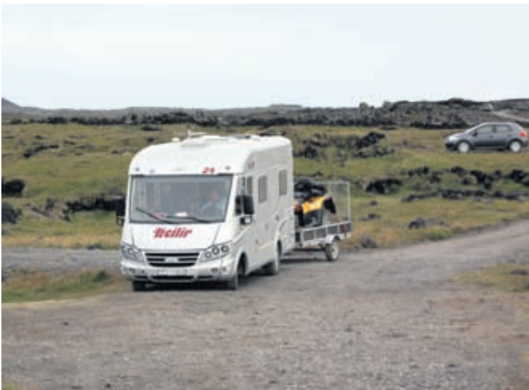
Fiatinn á Hellisandi.