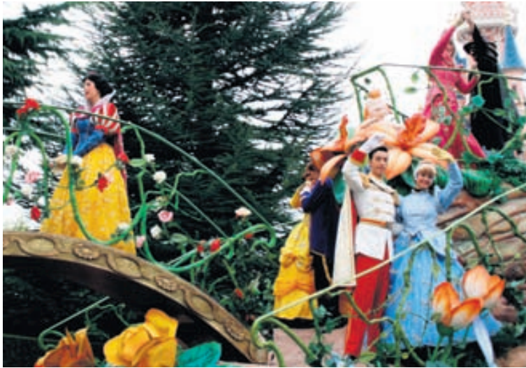
Ævintýrin lifna við í Disneylandi.

Með þessari atriði í huga er ljóst að París er paradís fyrir barnafjölskyldur svo fremi sem nokkrir mikilvægir og hagnýtir þættir eru hafðir í huga svo sem: