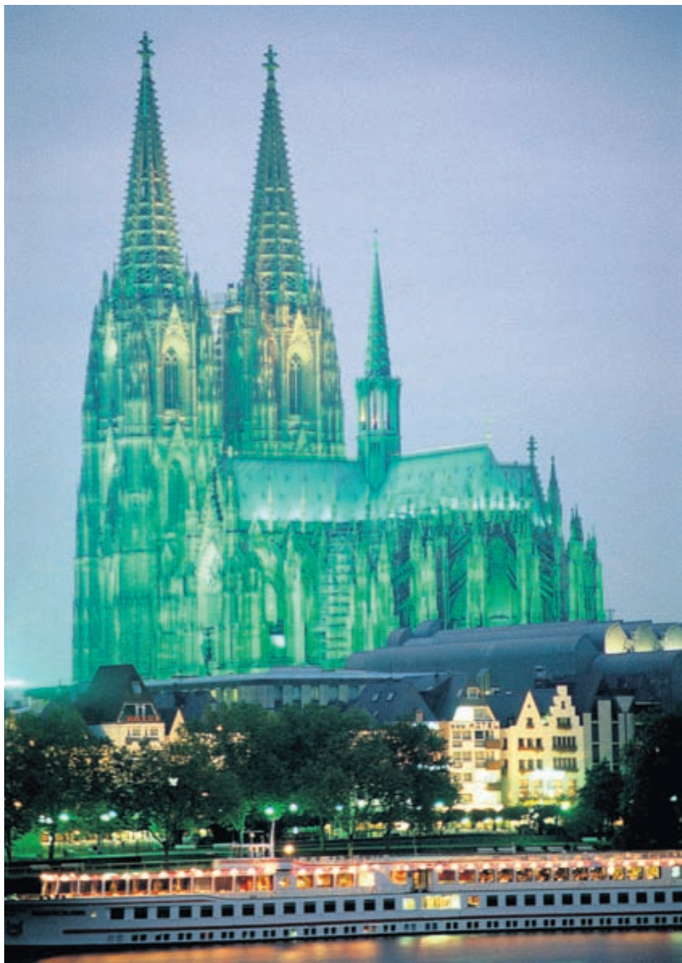
Dómkirkjan í Köln lætur engan ósnortinn.