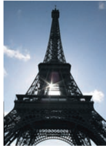
Eiffel-turninn er magnaður á öllum tímum sólarhringsins.

ekki með of ung börn í borgarferðum. Stálpuð börn eru líklegri til að njóta borganna betur. Eiffel-turninn er sennilega þekktasta kennileiti í heimi og magnað verkfræðiundur. Allt í sambandi við þennan turn er líklegt til þess að vekja óskipta aðdáun og „váá-viðbrögð“ barna og hrifnæmra sálra. Hæðin, sagan, gerð hans, þ.e. hvernig hann er skrúfaður saman upp í loft eins og mekkanó, lýsingin og glitljós-in eftir myrkur, lyftuferðin og útsýnið. Fjömgir hafa lagt leið sína upp í þennan magnaða turn, en eins og alltaf þegar ferðast er með börn, hafa þau lag á því að opna