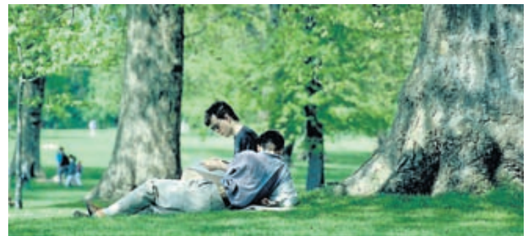
Á sumrin er indælt að slaka á í Hyde Park eða öðrum skrudgördum Lundúna og nóg pláss til að finna ýmist iðandi mannlíf, rólegan lund til lesturs eða ástafundar, og blómlega áningarstaði fyrir nestisferð.