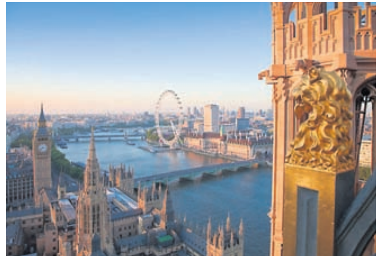
Höfuðborg Englands er töfrum hlaðin og með gnægtaborð freistandi afþreyingar. Hér sést yfir Tempsá, Westminster-höll og Big Ben frá Victoria-turninum.

Nánari upplýsingar á www.2do-inlondon.com . Netfang: 2do-inlondon@gmail.com .