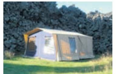
Svefnpláss er fyrir fjóra í tveimur herbergjum.

„Íslendingar eru mikið fyrir útilegur og þessi vagn er til dæmis mjög sniðugur kostur fyrir ungt barnafólk sem ekur á litlum, eyðslugrönnum bíl. Hann er einnig á mjög góðu verði en við bjóðum hann núna á tilboði með miðstöð á 1.390.000 krónur.“