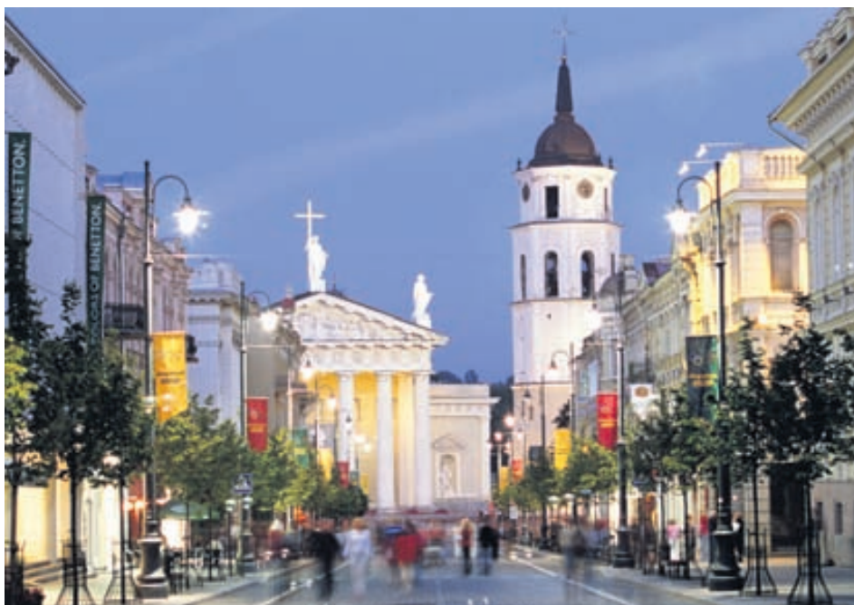
Vilnius, höfuðborg Litháen, geymir fallegar perlur.