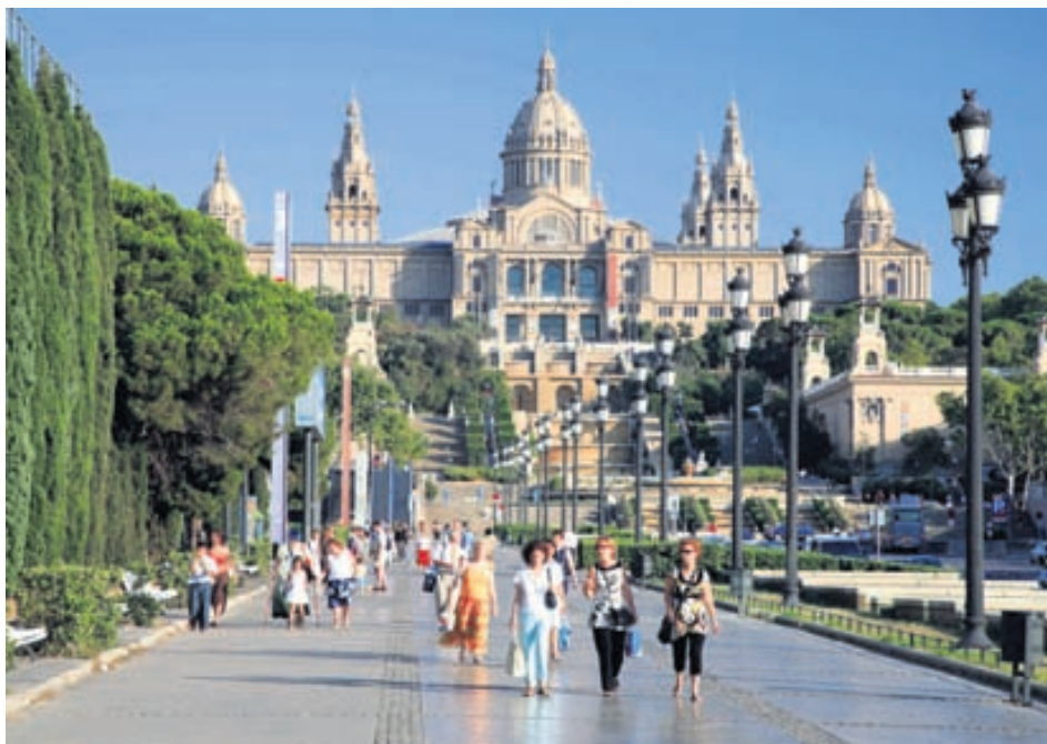
Barcelona iðar af lífi.