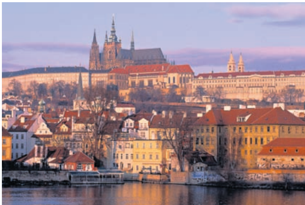
Prag er heillandi borg sem er gaman að heimsækja.