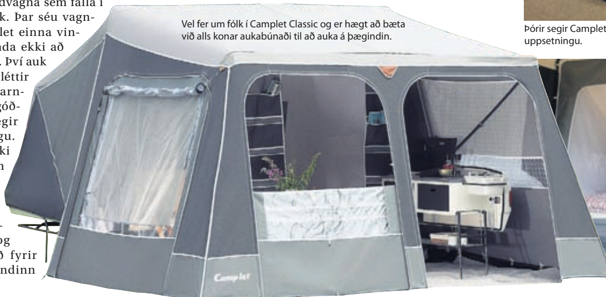
Camplet-tjaldvagnarnir eru búnir öllum helstu þægindum.

Vel fer um fólk í Camplet Classic og er hægt að bæta við alls konar aukabúnaði til að auka á þægindin.