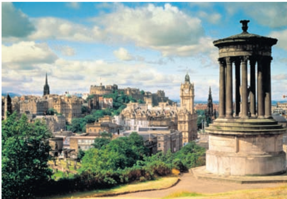
Edinborg býr yfir einstökum sjarma.