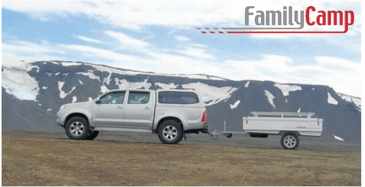
Family Camp er léttur tjaldvagn sem auðveldlega er hægt að ferðast með um hálendið.