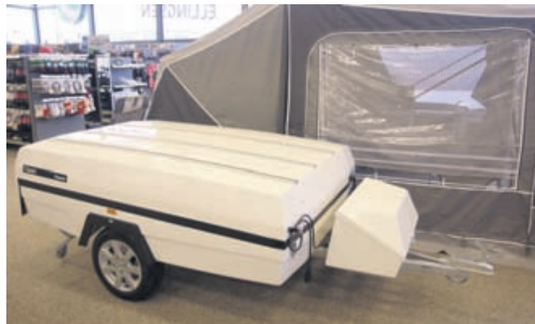
Þór segir Camplet-vagnana léttu og meðfærilega sem geri þá þægilega í drætti og uppsetningu.