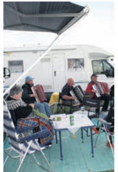
Félagar úr húsbílafélaginu á góðri stund.