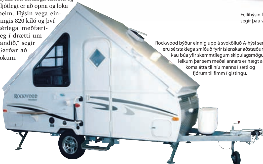
Rockwood býður einnig upp á svokölluð A-hýsi sem eru sérstaklega smíðuð fyrir íslenskar aðstæður. Þau búa yfir skemmtilegum skipulagsmöguleikum þar sem meðal annars er hægt að koma átta til níu manns í sæti og fjórum til fimm í gistingu.