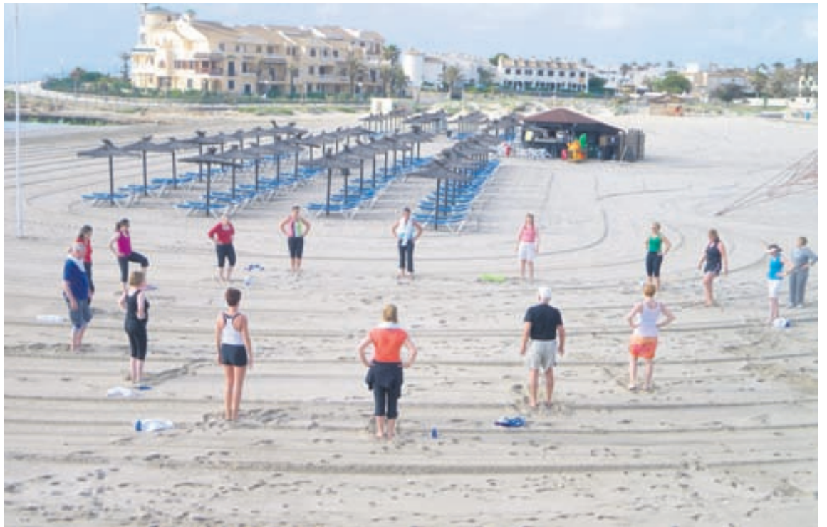
Teygjur á ströndinni eftir hressandi morgungöngu.