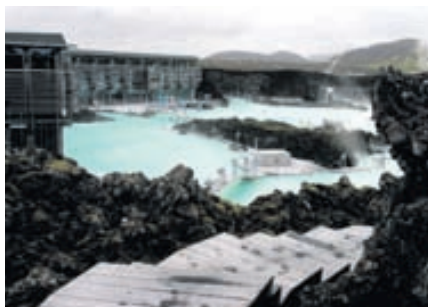
Bloggfærslur um Bláa lónið kveikja ferðabrá í hjörtum Kínverja.

Eftir að þjóðirnar tvær skrifuðu undir samkomulag um vegabréfsáritanir til Íslands árið 2004 hafa tækifæri Kínverja til ferðalaga til Íslands aukist. Árið 2009 heimsóttu 7000 Kínverjar Ísland. Þá hafa lýsingar kínverskra ferðamanna á bloggum og á heimasíðum kveikt ferðahug í fleirum og fékk mynd af Bláa lóninu sem