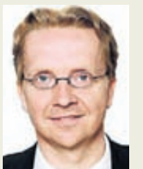
Gunnlaugur segir gjörbyltingu hafa orðið í Eyjum.