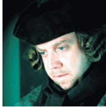
Leikarinn Paul Giamatti hlaut Emmy-verðlaunin fyrir tulkun sína á John Adams.

Fyrirsögnin gæti verið hluti úr gátlista manneskju á leið til Boston. Manneskju sem veit að það er fátt verra en að fara að sofa án þess að burstu tennurnar. Nema þá kannski að lenda í bandarískum tollvörðum án passans. Þeir eru nógu erfiðir þótt maður sé með hann, fjandakornið.