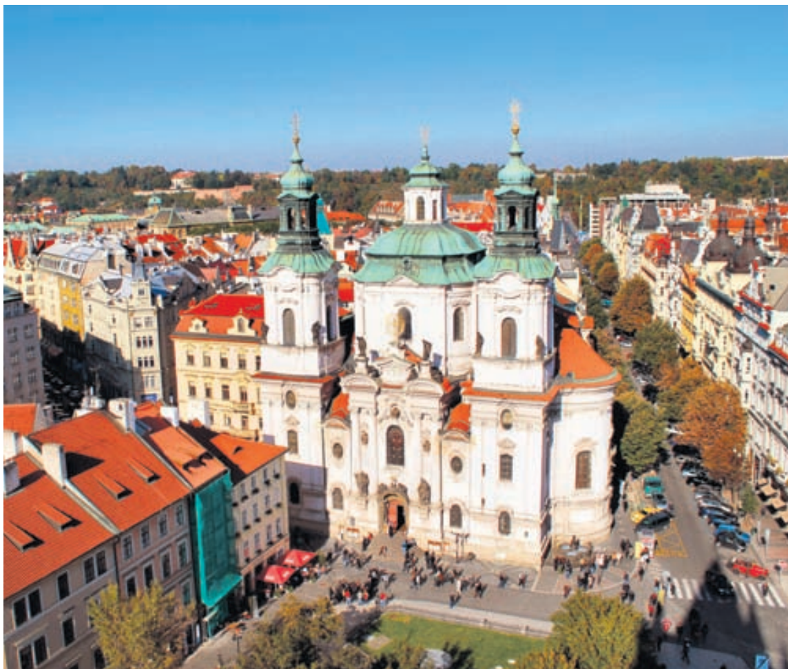
Prag er talin með fegurstu borgum Evrópu og eru elstu hverfi hennar á heimsminjaskrá Unesco. Höfuðborgin er sú stærsta í Tékklandi, staðsett í miðju landsins og í gegnum hana rennur Moldá.