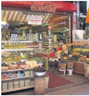
„Dæmigerð búið á markaðsgötunni minni, ólífur, ostar, þurrkaðir ávextir, hnetur og margs konar gúmmelaði.“

ingastaði með mat frá öðrum þjóðum. Hér eru alþjóðlegir skyndibita- staðir eins og McDonalds og Kentucky Fried Chicken en þá daga sem mig langar í sushi, taílenskan mat eða góðan ítalskan pastarétt neyðist ég til að láta mig dreyma.