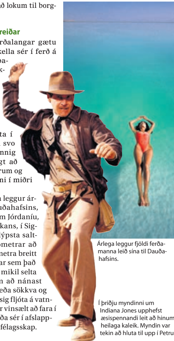
Árlega leggur fjöldi ferðamanna leið sína til Dauðahafsins.

Fjöldi ferðamanna leggur árlega leið sína til Dauðahafsins, sem er á landamærum Jórdaníu, Ísraels og Vesturbakkans, í Sigdalnum. Vatnið er dýpsta salttjörn heims, 76 kílómetrar að lengd, allt að 18 kílómetra breitt og 400 metra djúpt þar sem það er dýpst. Óvenjulega mikil selta gerir það að verkum að nánast ógerlegt er að synda eða sökkva og því er vinsælt að láta sig fljóta á vatninu. Þar er enn fremur vinsælt að fara í strandferðir eða bregða sér í afslappandi leirbað í góðum félagsskap.