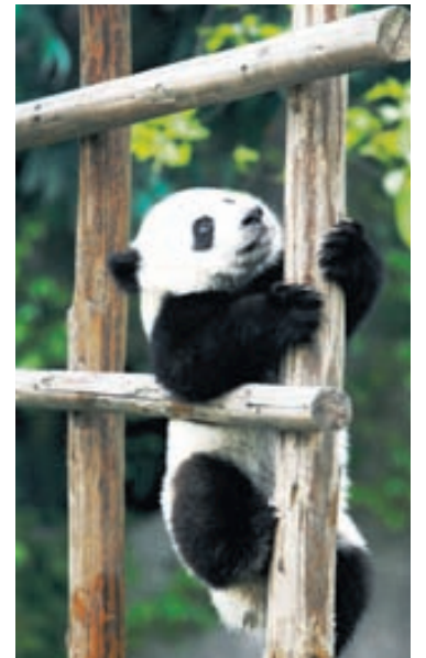
Pandabjörn á klifri.

962 tegundir. Garðurinn hefur meðal annars að geyma gríðarstórt og fjölbreytt kattardýrasvæði með yfir 30 kattartegundum. Þar er einnig gríðarstór inni-eyðimörk sem staðsett er í stærstu glerhvelvingu heims og inni- mýrarsvæði.