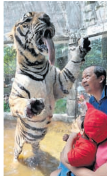
Tigrisdýr í návígi.