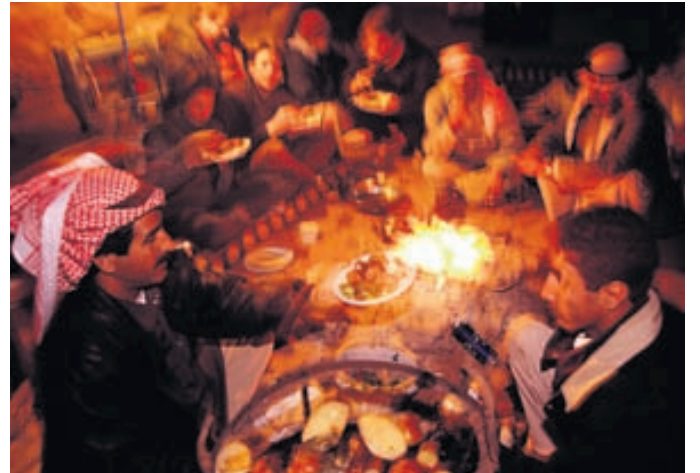
Bedúinar borða kvöldmat við varðeldinn.