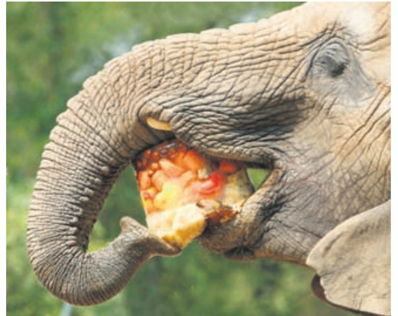
Fill að gæða sér á ljúffengum ísmola með góðgæti í.

Í öðru sæti er Henry Doorly Zoo, dýragarður í Nebraska í Bandaríkjunum sem var stofnaður árið 1894. Hann nær yfir 53 hektara landsvæði með um 17.000 dýr og