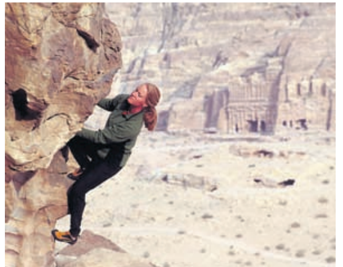
Klettaklífur nálægt Petru.