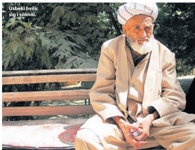
Úsbeki hvílir sig í sólinni.