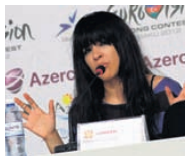
Svíar telja að sín kona, Loreen, muni bera sigur úr býtum í kvöld.