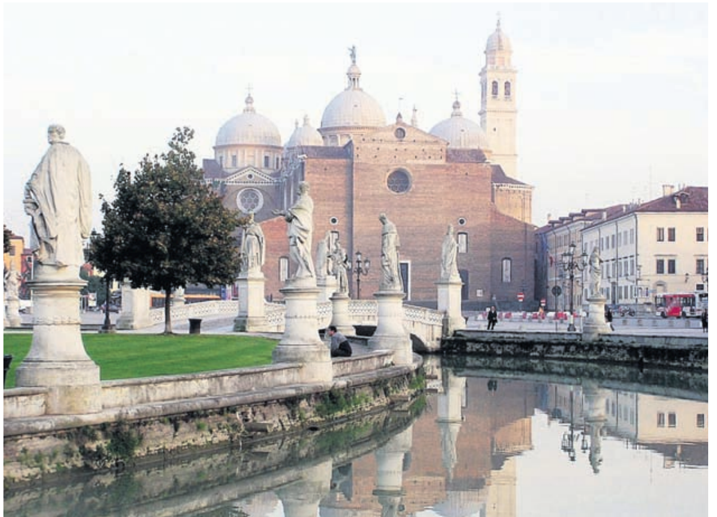
Padova er falleg borg með mörgum merkilegum minjum,

Er gott að versla í borginni? Ítalía er þekkt fyrir fallega hönnun, bæði hvað varðar hús-