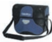
Ultimate 5 stýristaska: 15.900,-