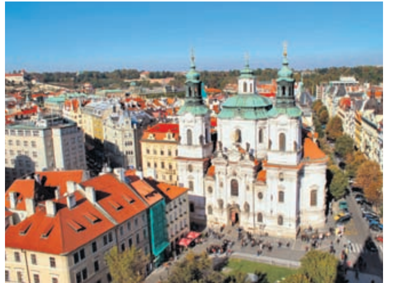
Prag er af mörgum talin fegursta borg Evrópu.