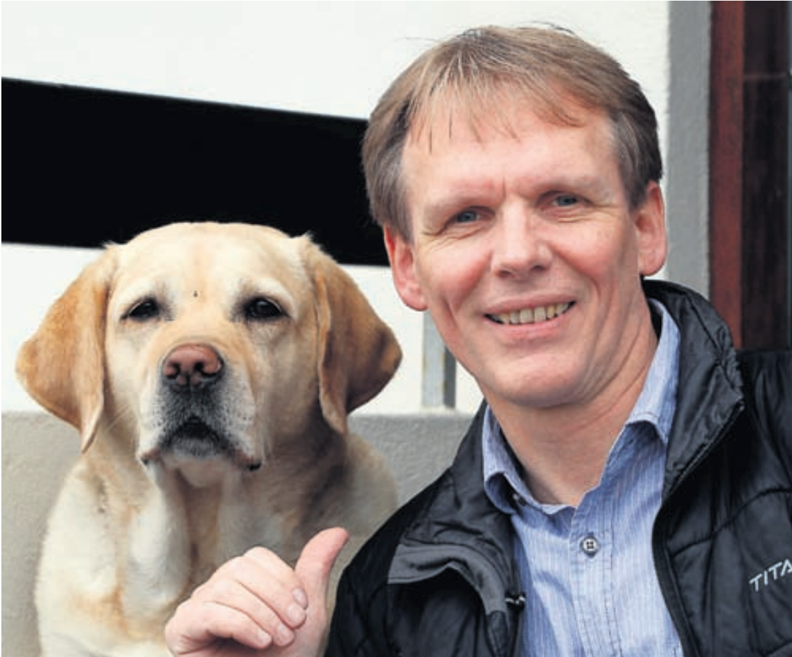
Mjög lítið hefur breyst varðandi öryggi og eftirlit með ferðamönnum á undanförunum áratugum.