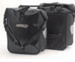
Front Roller classic: 19.900,- (parið)