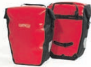
Back Roller city: 17.900,- (parið)