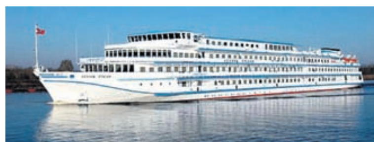
Eitt af þeim skipum sem siglt er á í ferðunum.

„Eftir að siglingin byrjar er komið við í nýrri borg daglega en siglt er á nóttinni, þannig eru fimm borgir eða sveitaþorp heimsótt á leiðinni á milli Moskvu og Pétursborgar.“ Í Astrakhan – Moskvu siglingunni er komið við í níu öðrum borgum að undantöldum upphafs- og endaborginni, þeirra sögulegust er borgin Volgograd sem betur er þekkt undir sínu gamla nafni Stalíngrad. Þar biðu herir Hitlers-Þýskalands alvarlegan ósigur fyrir Rauða hernum og þar urðu þáttaskilin í Heimsstyrjöldinni síðari en mjög litlu munaði að þýsku stríðsvélinni tækist að ýta sovéska hernum ofan í Volgufljót í gríðarlegum bardögum 1942 - '43. Hefði það tekist hjá Þjóðverjum liti heimurinn eflaust öðruvísi út í dag