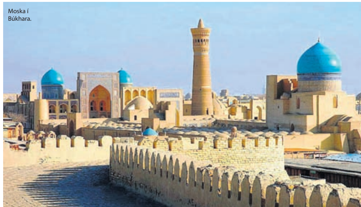
Moska í Búkhara.