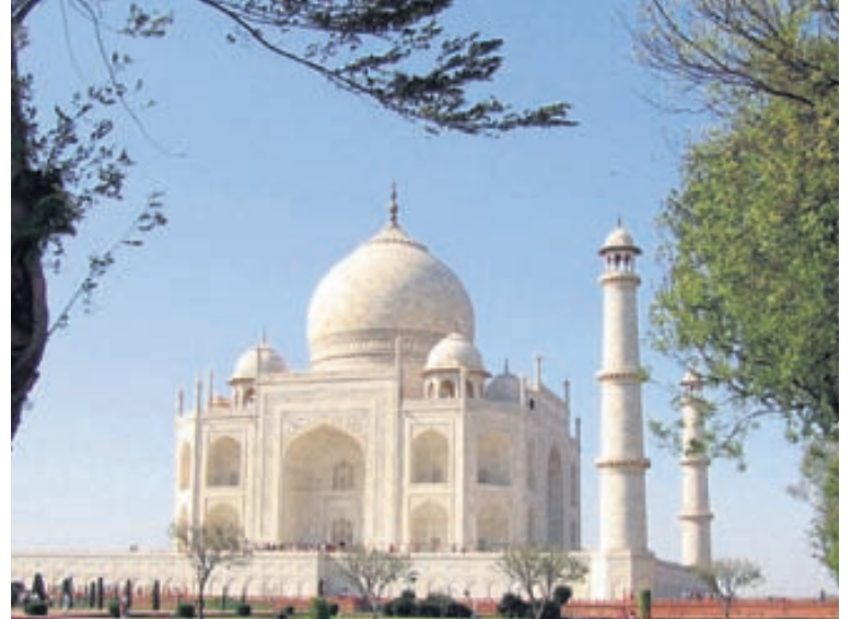
Indland er mikil upplifun sem gleymist seint.