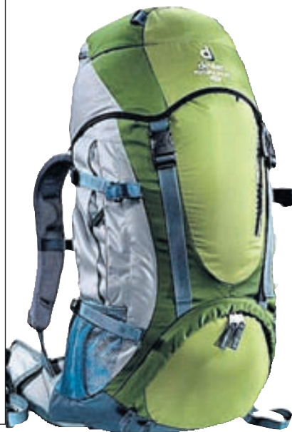
Bakpokinn ætti ekki að vera þyngri en 15 kíló.