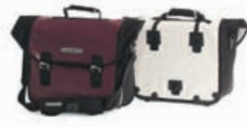
Down Town: 24.900,-