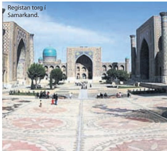
Registan torg í Samarkand.