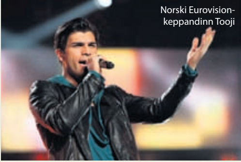
Norski Eurovision-keppandinn Tooji

Loreen, sem keppir fyrir Svíþjóð, heitir réttu nafni Lorine Zineb Noka Talhaoui. Báðir foreldrar hennar eru marokkóskir Berbar. Hún er fædd í Stokkhólmi.