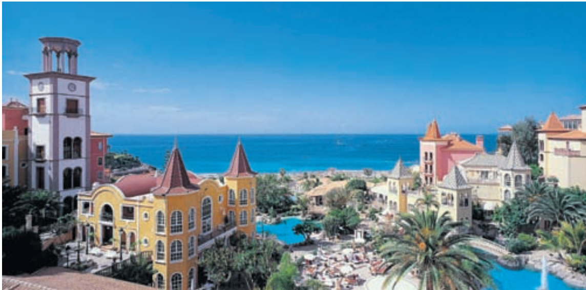
Tenerife á Kanaríeyjum er vinsæll staður hjá Íslendingum allt árið.