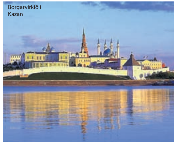
Borgarvirkið í Kazan