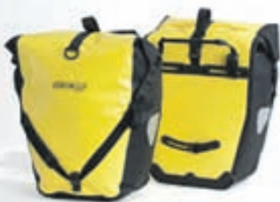
Back Roller classic: 23.900,- (parið)