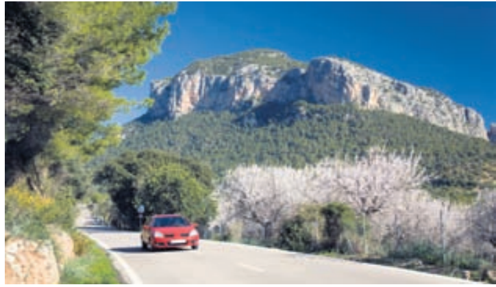
Víða um heim sameinast ókunnugir í bíla til að komast frá A til B.