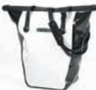
Bike Shopper: 14.900,-