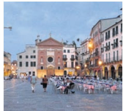
Stutt er frá Padova til Veróna, Feneyja, Flórens og fleiri spennandi staða á Ítalíu.

legt. Um síðustu helgi skoðuðum við lítinn, skemmtilegan dýragarð þar sem við upplifðum að stórt tigrisdýr skelti hrömmunum á stóra glerrúðu beint fyrir framan okkur og öskraði ógurlega. Það skemmtilega var að við náðum þessu á vídeó.