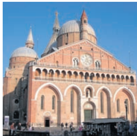
Padova er gamall háskólabær.

Hvernig eyðir þú frítímanum? Við notum frítímann vel með því að skoða nærliggjandi svæði. Við förum á alls kyns söfn, tónleika og fleira. Fórum t.d. á stórt jarðarberja-festival fyrir stuttu og komum heim með stóran kassa af glænýjum jarðarberjum, yndis-