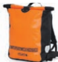
Messenger Bag: 20.900,-

Söluastaðir: Kría Hólmaslóð 4 Reykjavík Útilíf Holtagörðum Reykjavík