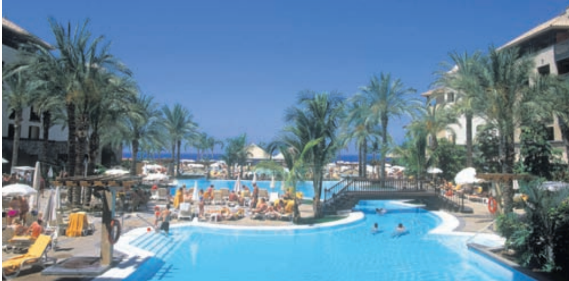
Fjölmargin spennandi gististaðir eru í boði í sólinni í sumar.