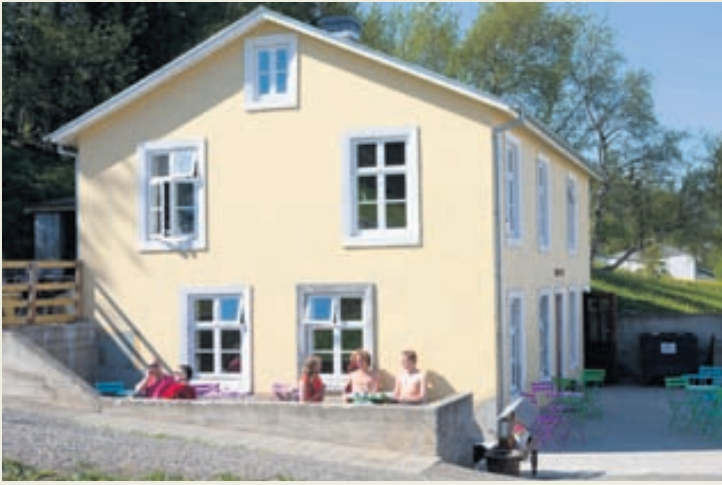
Nýjasta kaffihúsið á Akureyri er til húsa í gamalli söðlamiðju.