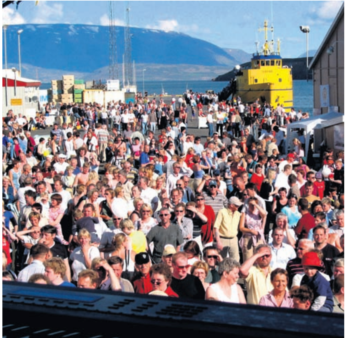
Um 30 þúsund manns heimsóttu Dalvík á Fiskidaginn mikla í fyrra en þeim hefur fjölgað ár frá ári.