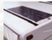
Sólarrafhlöður fyrir húsbíla og fellihýsi. Þunnar 130w