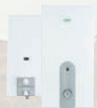
Gas-vatnshitavar 5 - 14 l/mín