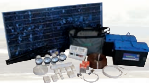
Sólarrafhlöður og fylgihlutir. 10-125w