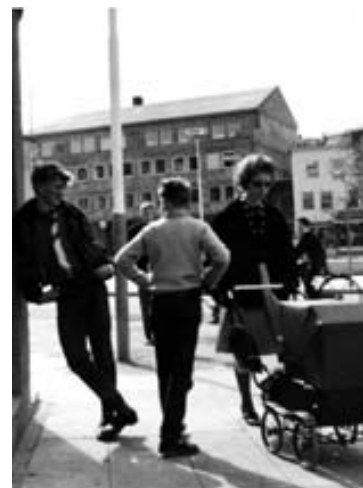
Skemmtilegt augnablik í miðbæ Akureyrar frá sjöunda áratugnum.