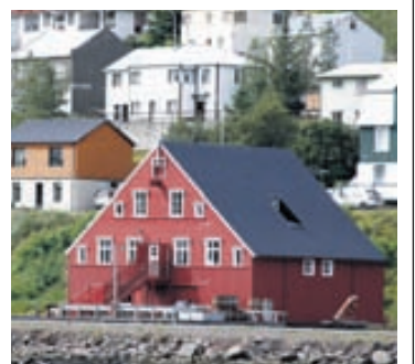
Síldarminjasafnið á Siglufirði.

Í Fjallabyggð er óvenjumikið af söfnum. „Hér er Síldarminjasafnið sem er stærsta sjóminja- og iðnarsafn landsins og Þjóðlagasetur séra Bjarna Þorsteinssonar, þar sem má skoða gömul hljóðfæri og hlusta á gömul þjóðlög. Þau eru bæði á Siglufirði. Nýjasta safnið á Siglufirði er Ljóðasetur Íslands þar sem hægt er að kynna sér kveðskap, skoða