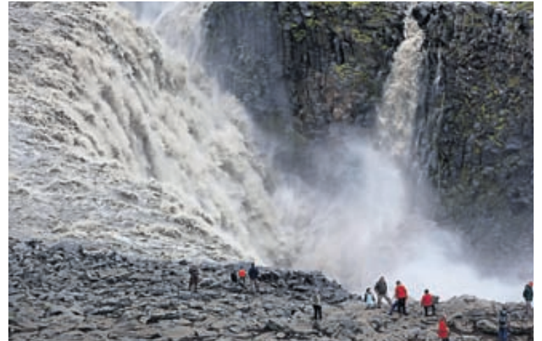
Dettifoss er aflmesti foss landsins. Það er ómissandi að skoða fossinn þegar Norðurland er sótt heim.

Hvalaskoðunarferðir eru orðnar ein vinsælasta afþreying ferðamanna sem koma hingað til lands. Norðurlandið hentar einstaklega vel til þess konar ferða.