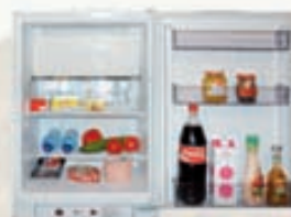
Gas-kælikápar 100 og 180 lítra