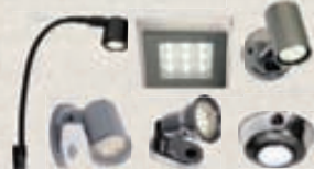
Led-ljós = minni eyðsla