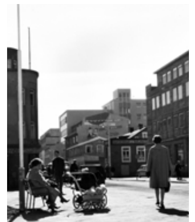
Minjasafnið á Akureyri á yfir þrjár milljónir ljósmynda. Í dag verður opnuð sýning á 300 myndum sem sýna bæjarlífið á tímabilinu 1862 til 2012.