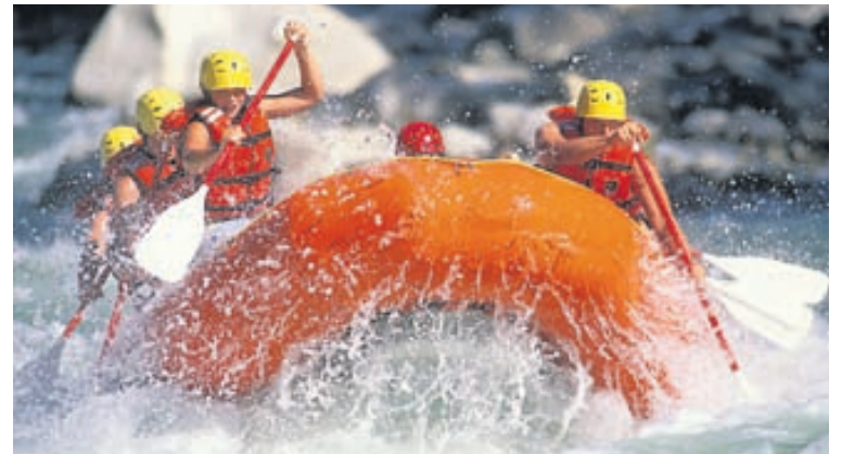
Flúðasiglingar eru tilvaldar fyrir þá sem langar að upplifa ævintýri. Hægt er að velja milli nokkurra áa eftir því hverjir ætla með. Jökulsá austari hentar þeim sem eru átján ára og eldri. Vestari er fyrir þá sem eru orðnir tólf ára og Blanda hentar fjölskyldum með ung börn.