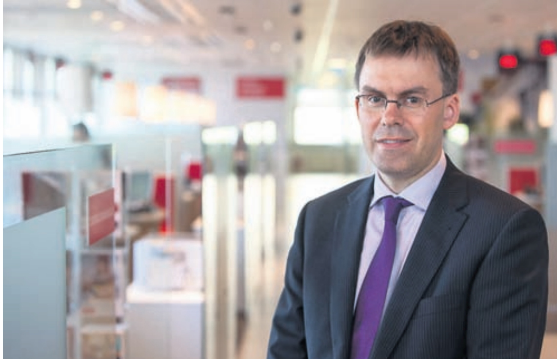
Jón segir það skyldu bankans að bjóða upp á mismunandi leiðir til fjármögnunar. Það sé ólíkt milli einstaklinga hvers konar lán henti hverju sinni.

Þjónustan er valkvæð hvort heldur sem er fyrir þá sem eru nú þegar með óverðtryggð húsnæðislán eða nýja lánþakendur.“