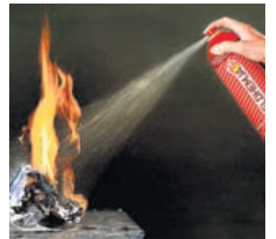
Eldhemja Plus er lítill úðabúsi með slökkvifroðu sem einfalt er að nota á elda á byrjunarstigi. Hún er frostþolin og sleekur elda í A, B og F-flokki.

Til hliðar má sjá myndavél sem hentar hvers konar fyrirtækjum úti sem inni og að neðan er myndavél með innbyggðum IR-ljósum sem lýsa í myrkri. Hún hentar vel á sumarhús og íbúðarhús.