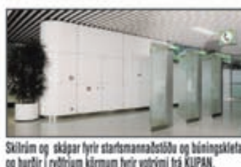
Skilrík og skápar fyrir starfsmannabúðu og bíningskieta og hurrir í ryðtrium körmum fyrir vörými frá KUPAN.