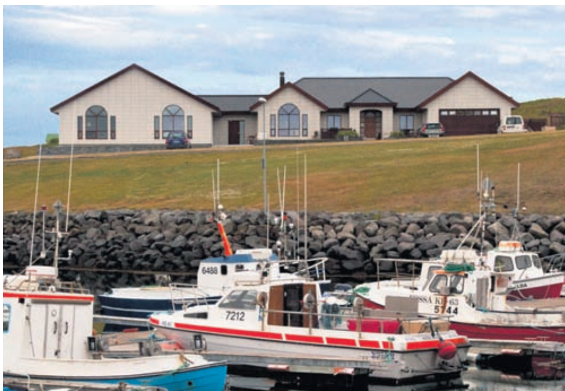
Hótel Berg er nýlegt hótél sem stendur við smábátahöfnina í Keflavík. Góðar umsagnir gesta hótelsins gera það að einu af þeim stigahæsta á landinu á alþjóðlegum bókunarvefum.