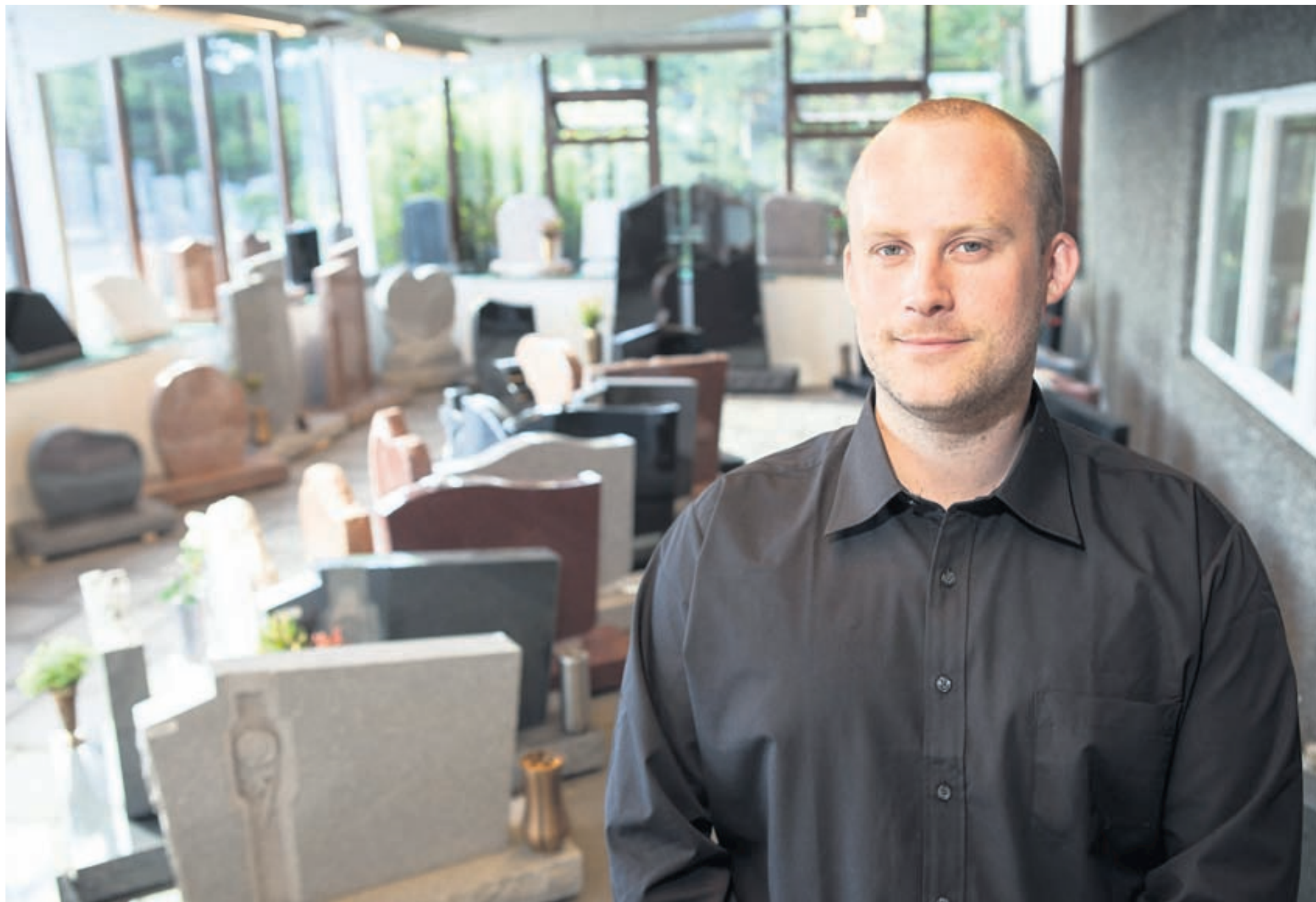
Brjánn og hans starfsfólk bjóða persónulega þjónustu og aðstoð við val á legsteinum.