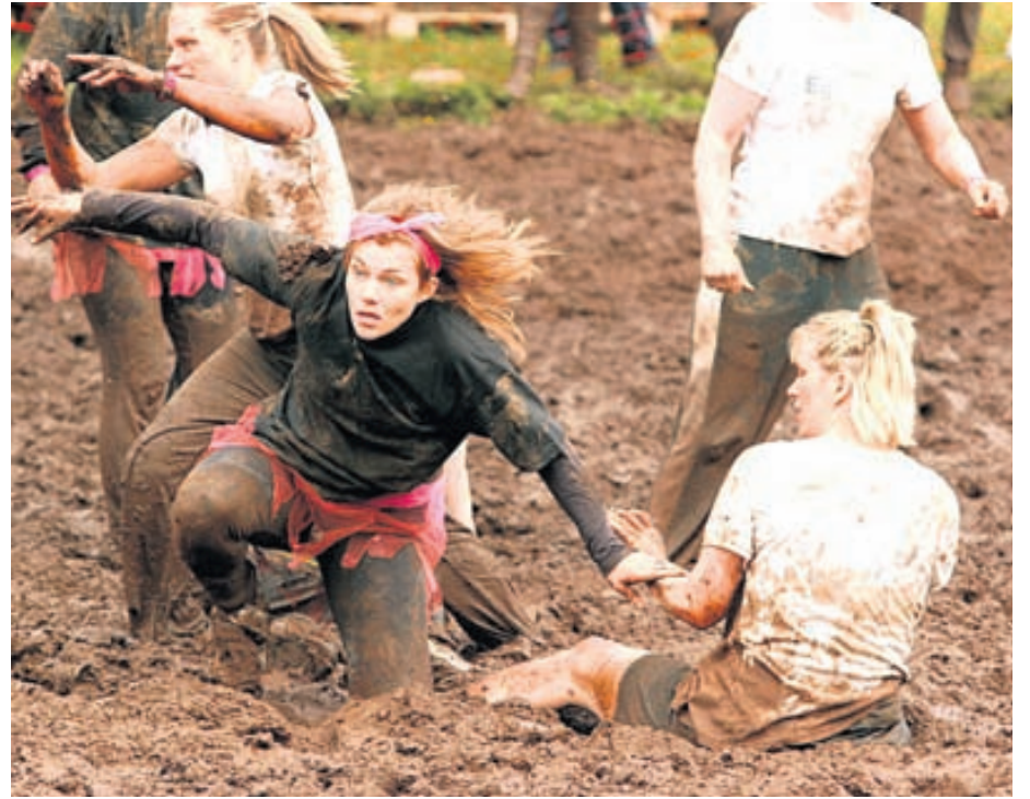
Mýraboltinn á Ísafirði er ávallt vinsæll.

Tónlistarhátíðin Gæran verður haldin á Sauðárkróki helgina 23.-25. ágúst þar sem boðið verður upp á 27 atriði á þremur dögum. Mikil flugeldasýning verður haldin við Jökulsárlón 25. ágúst. Þetta er í þrettánda skiptið sem sýningin er haldin og er óhætt að hvetja alla ferðamenn á nálægum slóðum til að mæta og njóta flugeldasýningarinnar í stórkostlegu umhverfi Jökulsárlóns.