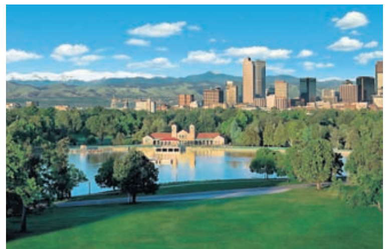
Í Denver er að finna einstök útivistarsvæði.

Þess má geta að Icelandair býður upp á fjóra áfangastaði í Þýskalandi; München, Hamborg, Wiesbaden og Frankfurt svo þar er sannarlega hægt að skoða sig um. Fleiri áfangastaði er að finna á heimasíðu Icelandair, www.icelandair.is .