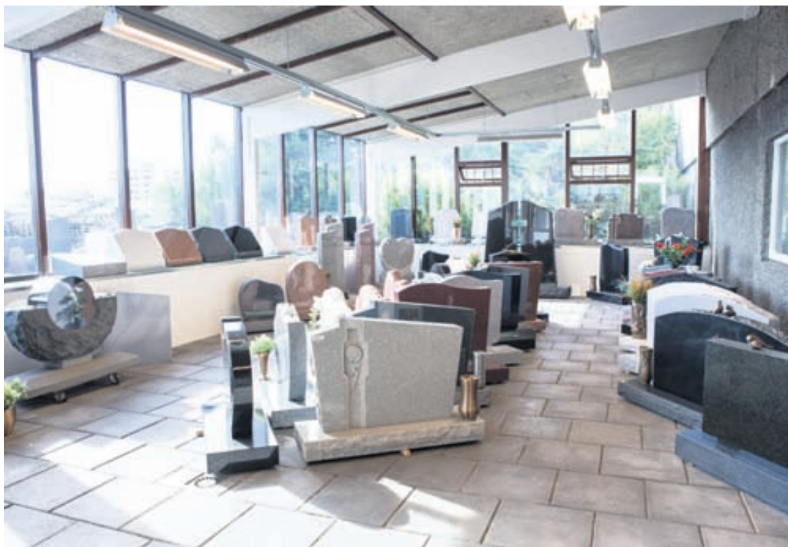
Á Skemmuvegi 48 er stærsti sýningarsalur landsins fyrir legsteina.

Stærsti sýningarsalur landsins fyrir legsteina verður á Skemmuveginum og er hann bæði inni og úti. Veitt er persónuleg þjónusta og úrvalið er mikið þannig að allir ættu að finna stein við sitt hæfi. Íslenskar steintegundir hafa verið vinsælar í gegnum tíðina og henta vel til sérsmíði. Stuðlaberg, grásteinn, gabbró og líparít er mikið notað og granít og marmari er innflutt til landsins. Einnig er hægt að fá hvers kyns fylgihluti hjá fyrirtækinu. „Við höfum mikið úrval af luktum, blómavös-