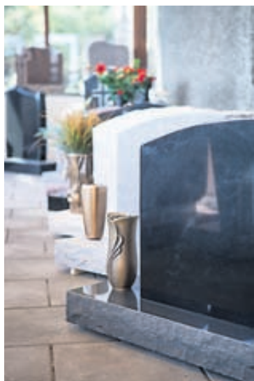
Hægt er að fá sérsmíðaða legsteina og hver kyns fylgihluti, svo sem blómavasa, stytur og skraut, hjá S. Helgasoni-Sólsteinum.

Grafískir hönnuðir, listamenn og menntaðir steinsmiðir starfa fyrir fyrirtækið. „Við smíðum mikið af okkur eigin steinum og við sérsmíðum líka eftir pöntunum og óskum viðskiptavina. Þegar fólk hefur valið sér stein teiknum við og setjum hann upp frá A til Ö þannig að fólk getur séð nákvæma mynd af steininum áður en framleiðslan hefst. Fólk veit því alveg út í hvað það er að fara. Fólk getur líka komið til okkar sjálft með teikningar