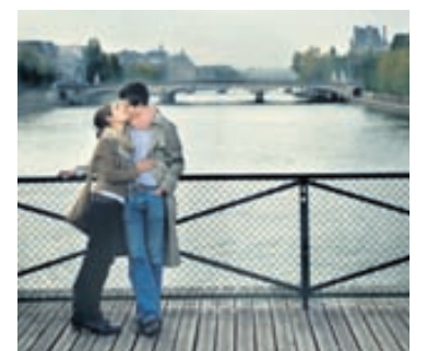
Í París blómstrar ástin.

Svava segir fólk gjarnan panta borgarferðir á þessum tíma árs. „Nú er fólk að tínast úr sumarfrí og farið að skoða haustið. Það