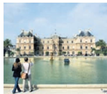
Það er margt að sjá og skoða í París.