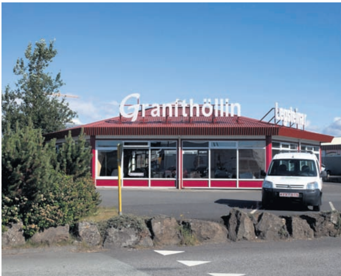
Graníthöllin er til húsa við Bæjarhraun í Hafnarfirði þar sem blómaverslunin Dögg var áður til húsa.