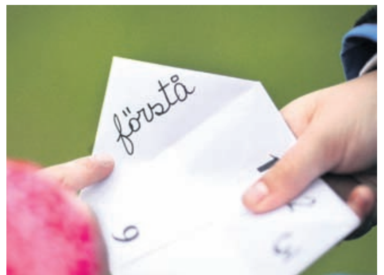
Dæmi um verkefni sem hafa fengið Nordplus styrki eru tungumálarannsóknir, tölvuleikir, ráðstefnur og tónlistarverkefni með tungumálaáherslu.

Norðurlanda, annað hvort í nám eða til starfa. Hafa íslenskir umsækjendur hlotið fjölmarga styrki í tungumálaáætluninni. Allir sem hafa áhuga og þekkingu á norrænum tungumálum geta sótt um styrk en dæmi um verkefni eru tungumálarannsóknir, ráðstefnur, tölvuleikir, tónlistarverkefni með tungumálaáherslu o.fl. Skilýrði umsóknar er að verkefnið hafi a.m.k. tvo samstarfsaðila frá Norðurlöndum eða Eystrasaltslöndum og að umsókn skuli skrifuð á dönsku, norsku eða sænsku. Starfsfólk Landsskrifstofu Nordplus veitir frekari upplýsingar og aðstoðar í leit að samstarfsaðilum. Hægt er að kynna sér áætlunina í heild sinni á síðunni www.nordplus.is .