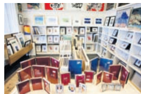
Mikið úrval af tilbúnum römum í standard stærðum er í boði hjá Innrömmun Sigurjóns.