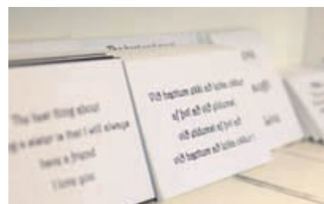
Skemmtileg og hnitmiðuð spakmæli á litlum plötum eru prýðis tækifærissgjöf.