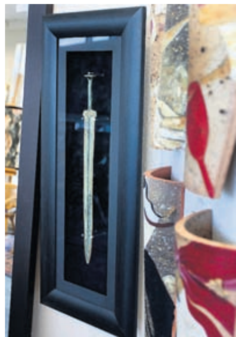
Það eru engin takmörk fyrir því hvað er hægt að ramma inn; flikur, teppi, útsaum, myndir eða sverð.