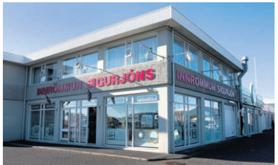
Innrömmun Sigurjóns er rótgróið fyrirtæki sem staðsett er í Fákafeni 11.

Nánari upplýsingar um Innrömmun Sigurjóns er að finna á vefsíðu fyrirtækisins www.innrömmun.is .