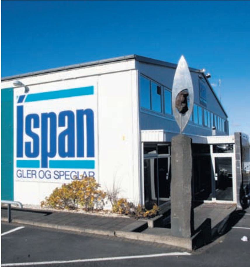
Íspan er á Smiðjuvegi 7 í Kópavogi. Á söluskrifstofunni kvikna margar hugmyndir enda úrvalið ótrúlegt.