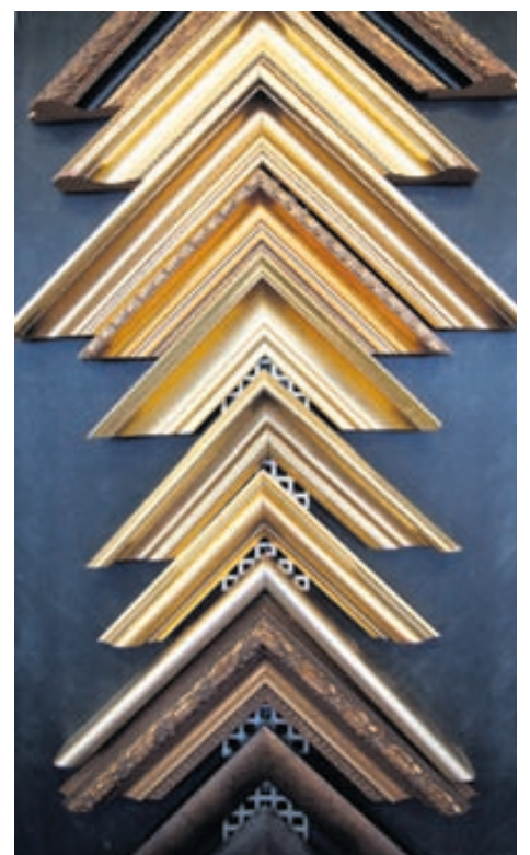
Mikið úrval af römum utan um myndir og spegla