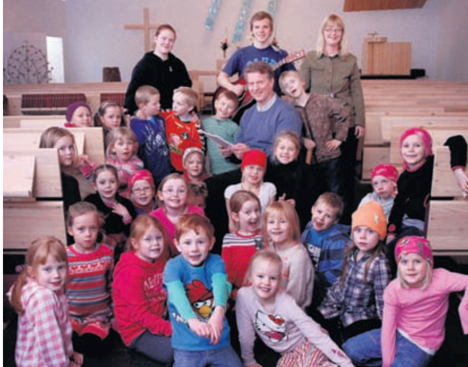
Hér er starfsfólk Árbæjarkirkju ásamt krökkum úr 7 til 9 ára starfi kirkjunnar sem haldið er reglulega.

Eftir messuna mun Kvenfélag Árbæjarsafnaðar vera með sitt árlega kaffihlaðborð og líknarsjóðshappdrætti. „Fyrirtæki og einstaklingar hafa þá lagt til ýmsan varning sem Kvenfélagið hefur safnað saman og pakkað inn. Þær eru ótrúlega öflugar þessar konur, hafa þjónað og fönðrað alls kyns muni sem verða einnig í happdrættinu. Allur ágóðinn rennur svo í styrktarsjóð Árbæjarkirkju sem notaður er til að aðstoða safnaðarmeðlimi sem þurfa á hjálp að halda.“