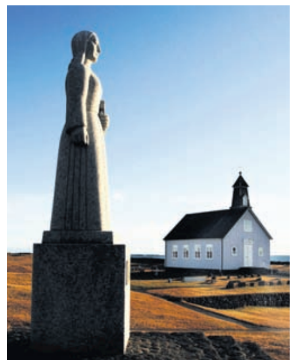
Styttan Landsýn sem stendur fyrir utan Strandarkirkju.