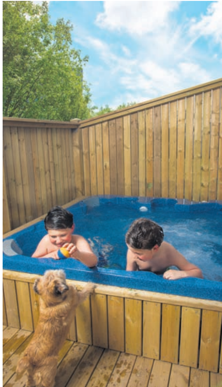
Það er mjög skemmtilegt að busla í heitum potti í góðu veðri, jafnt fyrir börn og þá sem eldri eru.