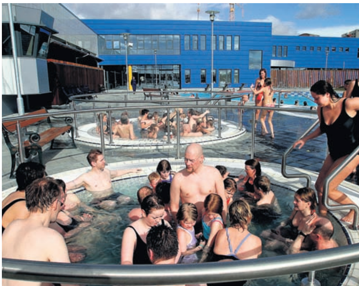
Heitir pottar eru vinsælir hjá fólki á öllum aldri.