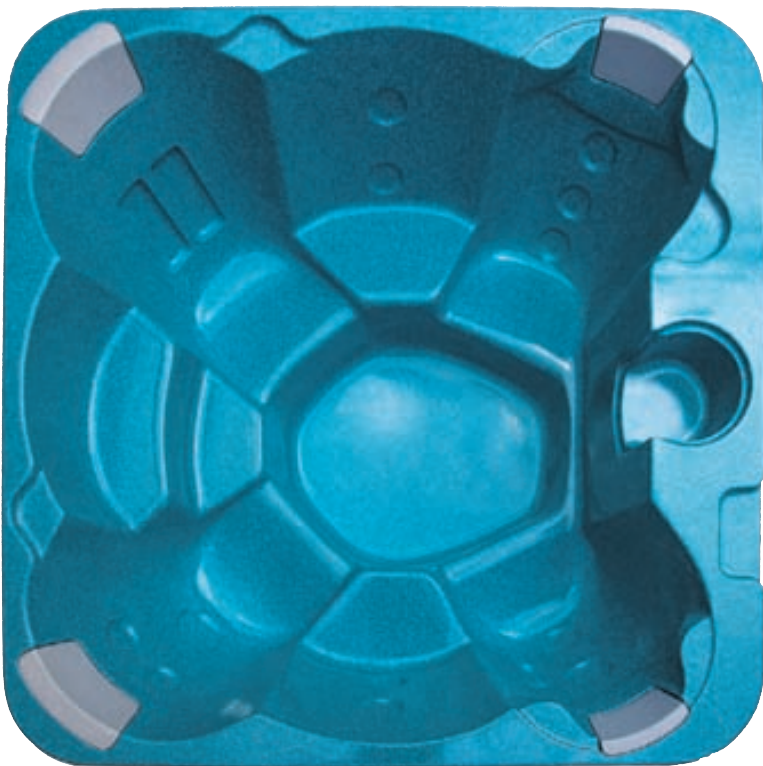
Heitur pottur frá Á. Óskarsson.

Á. Óskarsson ehf. býður upp á nuddælur sem fyrirtækið hefur í áratugi selt til íslenskra sundstaða. Dælurnar eru talsvert