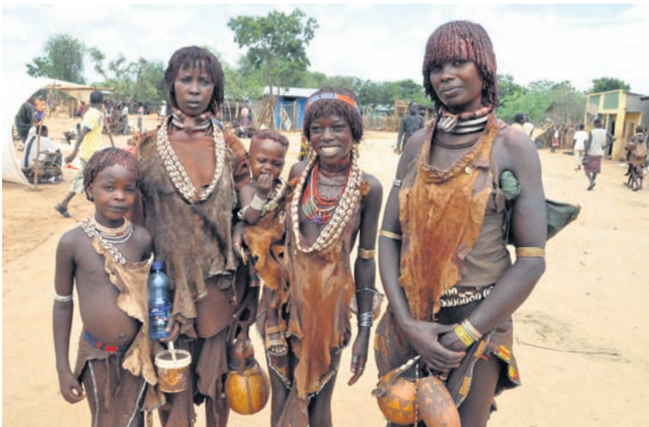
Markaður meðal Hamar-fólksins er heimsóttur. Skinnklæðnaður er áberandi og sérstök hárgreiðsla kvenna sem setja smjör og rautt kalk í hár sitt. Þær fá aldrei að þvo sér um hárð eftir að þær oftast.