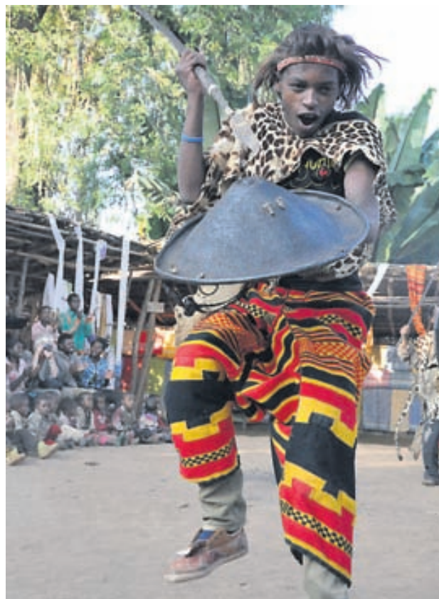
Danssýning hjá Dorsemönnum er áhrifamikil og nota þeir vopn og hefðbundinn skinnklæðnað og litríkan vefnað í dansinum.