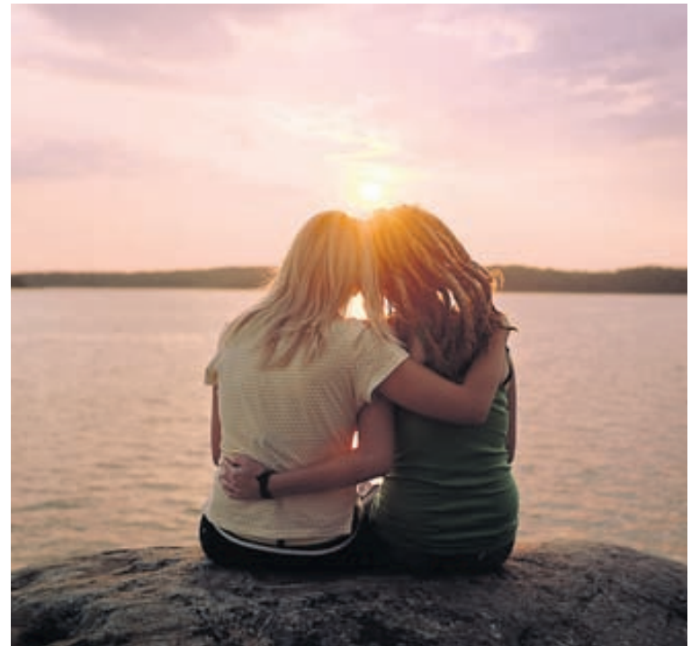
Hinsegin fólk kemur til Íslands til að geta áhyggjulaust verið það sjálft.

Roald segist hafa séð hversu rík sú þörf er víða erlendis þegar hann fór í siglingu fyrir samkynhneigða í fyrra. „Ég hafði takmarkaðan áhuga í upphafi en lét til leiðast. Þegar upp var staðið er þetta eitt af ævintýrlegri ferðalögum sem ég hef farið í,“ segir hann en viðurkennir að í byrjun ferðar hafi verið svolítið yfirþyrmandi að vera umkringdur öllum þessum fjölda karla á lendaskýlum. „Þarna var maður staddur ásamt þrjú þúsund