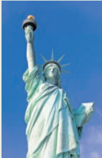
Frelsisstytta er vinsæll viðkomustaður ferðamanna.