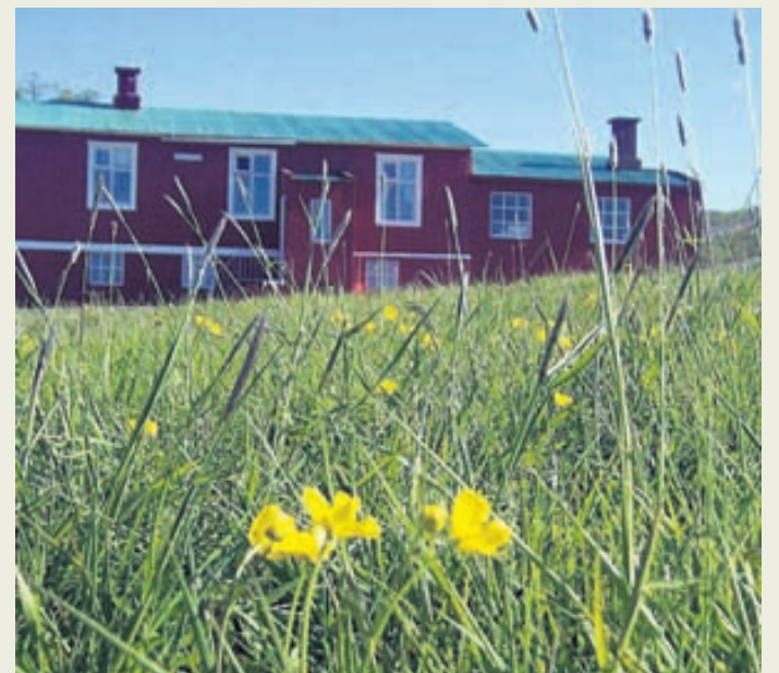
Ugla Café er kósý sveitakaffihús í Fnjóskadal.