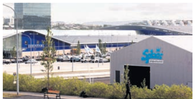
Splash er til húsa að Hagasmára 2. Viðskiptavinir geta rölt yfir í Smáralind meðan þeir bíða eftir bílnum. Þegar bíllinn er klár eru þeir látnir vita með SMS-skilaboðum.