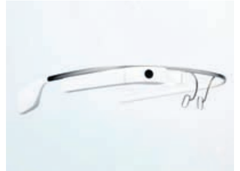
Með Google Glass er hægt að taka myndir og myndbönd, senda skilaboð og póst, vafra á netinu og fleira.

Google X er leynileg aðstaða Google í Kaliforníu þar sem unnið er að ýmsum tækninýjungum sem margar hverjar virðast fremur eiga heima í vísindaskáldsögum en