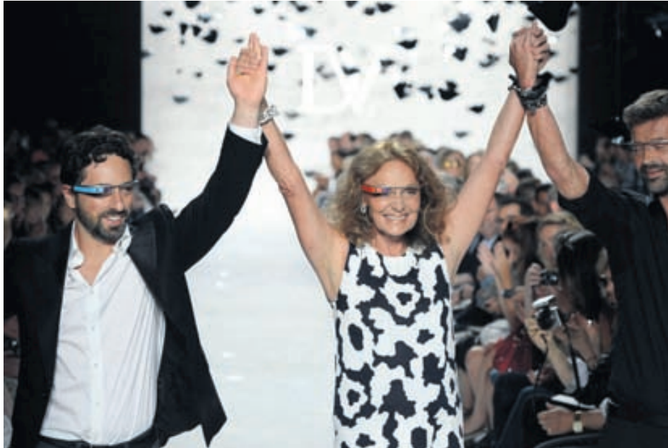
Google Glass hefur vakið þó nokkra athygli, ekki síst vegna áhuga fræga fólksins. Tiskuhönnuðurinn Diane Von Furstenberg notaði tækin á tiskusýningu sinni í New York í vor. Hér er hún ásamt Sergey Brin, einum stofnanda Google Inc.

Útgáfan sem er í notkun núna heitir Explorer. Sú tekur á móti upplýsingum