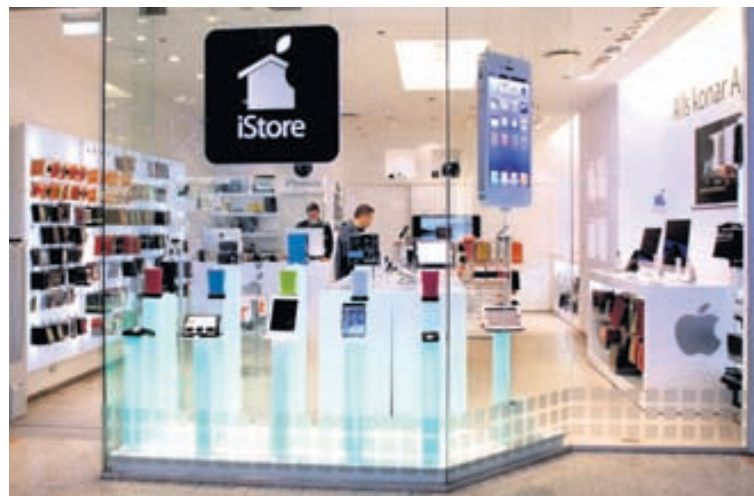
Verslun iStore í Kringlunni er björt og glæsileg.