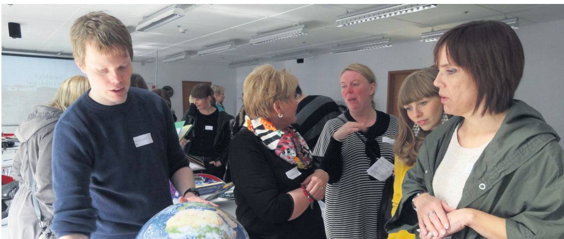
Símenntun kennara felst meðal annars í því að sækja ráðstefnur.