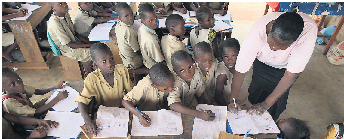
El berst fyrir því að allir, hvar sem er í heiminum, geti notið góðrar menntunar í almennum skólum.