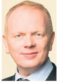
Illugi Gunnarsson mennta- og menningarmálaráðherra.