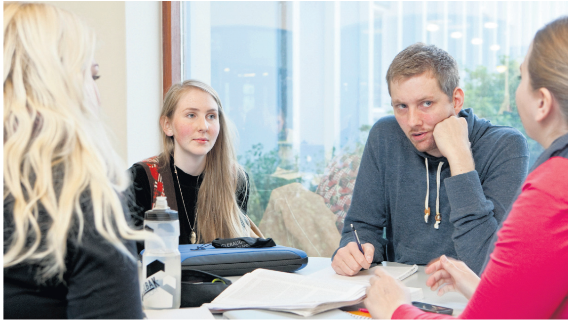
Kennarar framtíðarinnar á Menntavisindasviði Háskóla Íslands.

Öll erum við sammála um að nemendur eiga kröfu á bestu mögulegu þjónustu sem skólakerfið getur veitt þeim. Ég veit að það er metnaðarmál allra þeirra vel menntuðu kennara sem starfa í íslensku menntakerfi að vinna markvisst að faglegum umbótum í þá átt og ég hlakka til samstarfsins fram undan.