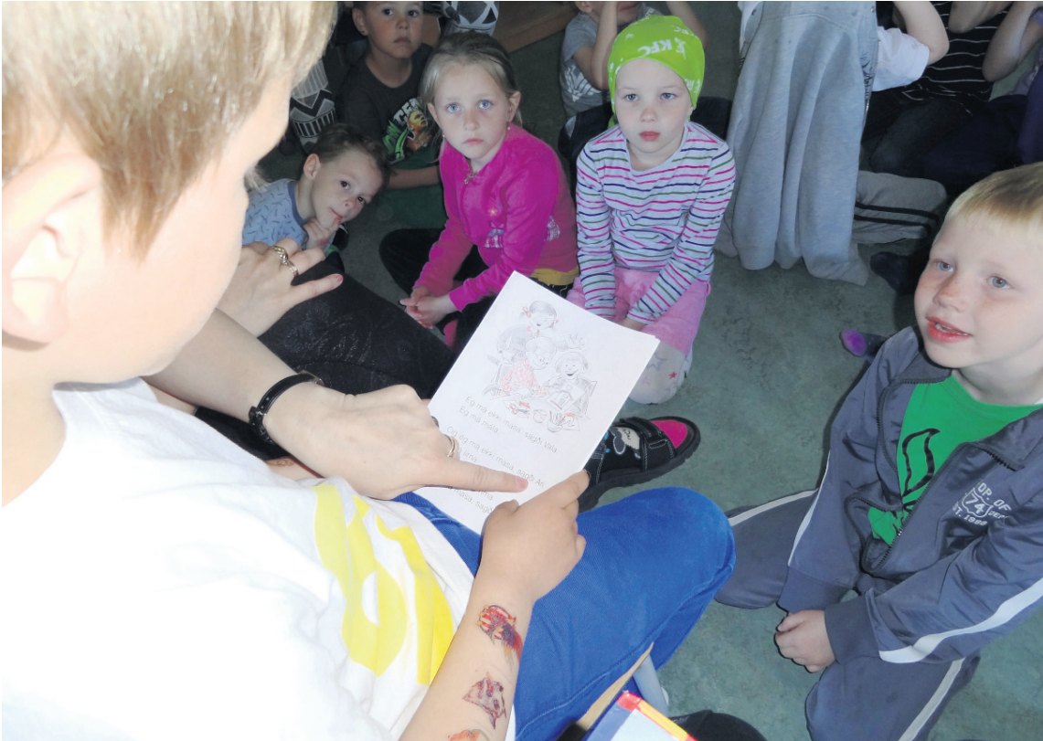
Nemendur og kennari í Gefnarborg í Garði æfa lestur.