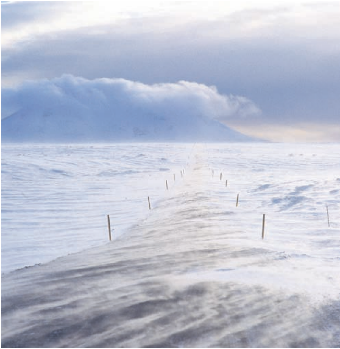
„Finnafjörður; ef maður vill vera einn með fjalli. Einn með sjálfum sér, upplifa vind og veður. Myndin er tekin á vegi 85 milli Lónafjarðar og Finnaafjarðar.“