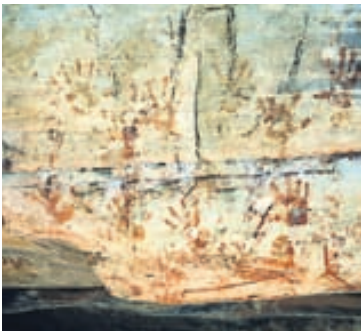
Forn handaför á hellavegg. Þessi hellir er raunar í Ástralíu en hellalistaverkin í rannsókninni voru í Evrópu.

næstu daga ættu ekki að láta stærstu veggjakrotssýningu heims fara fram hjá sér. Búið er að leggja níu hæða félagslega blokk í 13. hverfi borgarinnar undir veggjakrot, bæði að utan og í 36 íbúðum hennar og stigagöngum. Í októbermánuði hafa 100 franskir listamenn sýnt litfagurt og skrautlegt veggjakrot sitt en sýningunni lýkur í næstu viku. Í nóvember verður húsið rífið niður og því eru síðustu forvöð að sjá þessa skemmtilegu sýningu. Húsið er opið sex daga vikunnar og ókeypis inn. Prettánda hverfi Parísarborgar er á vinstri bakka árinna Signu. Hverfið er jafnframt Kínahverfi borgarinnar þótt það sé öllu rólegra og afskekktara en önnur Kínahverfi stórborga. Þar má einnig finna marga ódýra og góða veitingastaði.