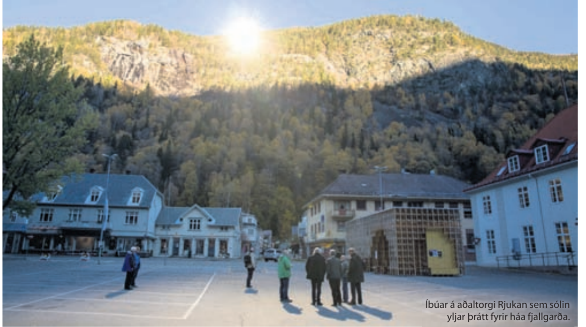
Íbúar á aðaltorgi Rjukan sem sólin yljár þrátt fyrir háa fjallgarða.