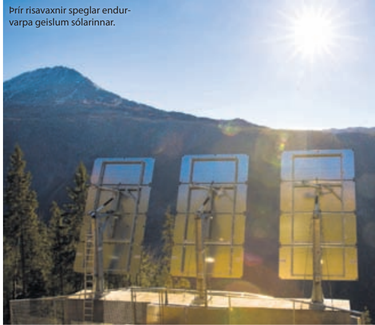
Þrjú risavaxnir speglar endurvarpa geislum sólarinnar.