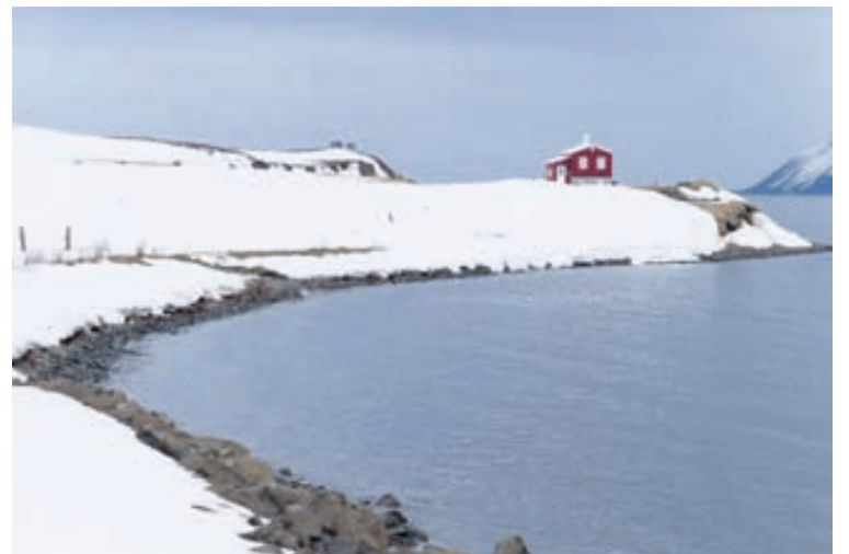
„Eyjafjarðarsvæðið: Frá Siglufirði til höfuðborgar hins bjarta norðurs eru bestu skíðabrekkur Lýðveldisins. Punktur.“