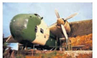
Sérstæð upplifun er að gista um borð í fraktflugvél.

Vegna sérstöðu sinnar dregur hótelið ekki aðeins að sér næturgesti heldur koma ferðamenn einnig víða að til að skoða herlegheitin.