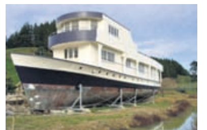
112 feta eftirlitsskip úr heimsstyrjöldinni síðari hefur gengið í endurnýjun lífdaga í Woodlyn Park.