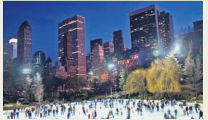
New York sefur aldrei.

Ótal ferðasmáforrit (öpp) í snjallsímann standa ferðalöngum til boða þegar þeir eru staddir á ferðalagi erlendis. Þau geta verið mjög hjálpleg þegar rata þarf um stræti stórborga, skipuleggja dagskrá dagsins, finna réttu söfnin og almenningsgarðana og finna ýmsar gagnlegar upplýsingar. Flest eru þau auðveld í notkun auk þess sem stór hluti þeirra er ókeypis. London, Kaupmannahöfn og New York eru þrjú vinsælir viðkomustaðir Íslendinga. Þeir sem ferðast til London geta nýtt sér The London Pass smáforritið, New York City Essential Guide hentar vel þeim sem ferðist til borgarinnar sem sefur aldrei og ferðalöngum á leið til Kaupmannahafnar er bent á Copenhagen Travel Guide. Öll eru öppin fánleg ókeypis fyrir bæði iPhone- og Android-síma. Smáforritin þrjú eiga það sameiginlegt að þar er að finna gagnlegar upplýsingar fyrir ferðalanga um helstu viðkomustaði ferðamanna, upplýsingar um samgöngur í borginni, opnunartíma safna og staðsetningu þeirra, gagnvirk kort og áætlanir almenningsgangna. Auk þess innihalda þau ljósmyndir, myndbönd og ýmis tilboð ætluð ferðamönnum.