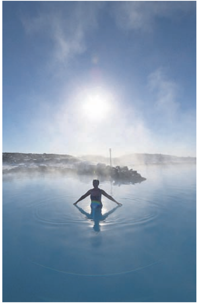
„Jarðböðin í Mývatnssveit: Heitt vatn, snjór, kuldi og heiður himinn, stundum.“