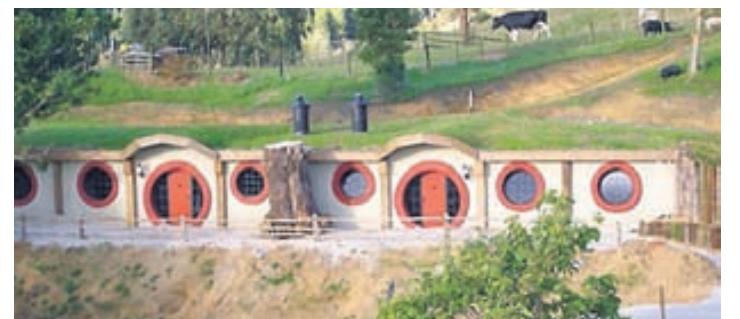
Kvikmyndirnar um Hringadróttinssögu og Hobbitann voru myndaðar á Nýja-Sjálandi. Í Woodlyn Park má gista í húsi sem dregur dóm af húsum Hobbitanna.

Flugáætlun: 18., og 25. janúar 1., 8., 15. og 22. febrúar