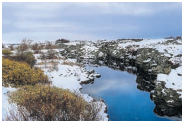
„Það er alltaf hátíðlegt á Þingvöllum, sérstaklega yfir vetrarmánuðina, þegar bara fimm eru á ferð.“