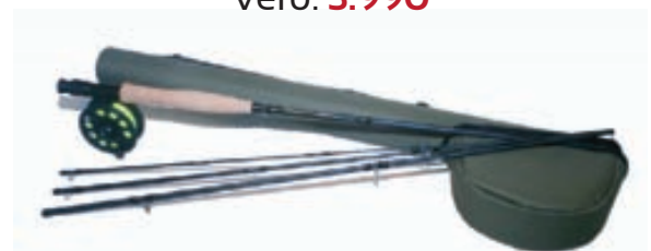
A. Jensen Yokanga Fluguveiðiset