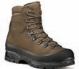
Scarpa Ladakh Gönguskór