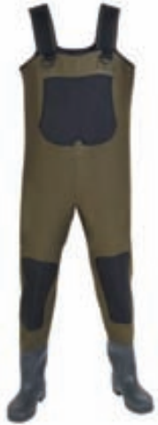
Norfin Neopran Vöðlur

Nýtt sértíloð á hverjum degi í Desember.