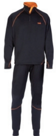
Norfin Innanundir fatnaður