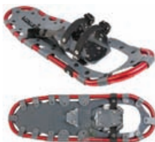
Norfin Snjóþrúgur Með Tösku