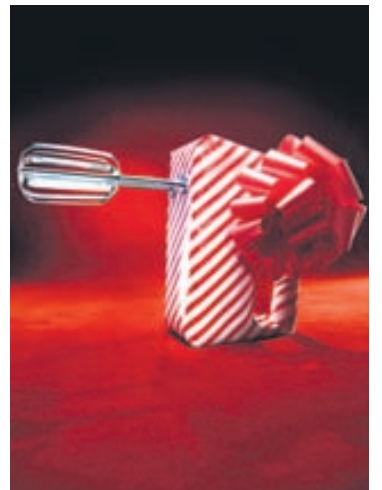
Hversu vel þekkirðu manninn þinn? Hvaða áhugamál hefur hann og hvað gerir hann í frítíma sínum?