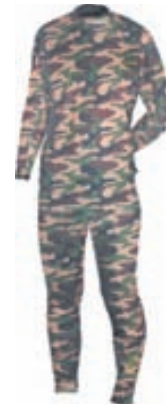
Norfin Innanundir fatnaður