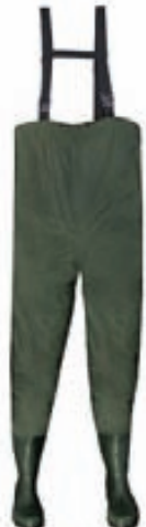
Norfin Nælon Vöðlur