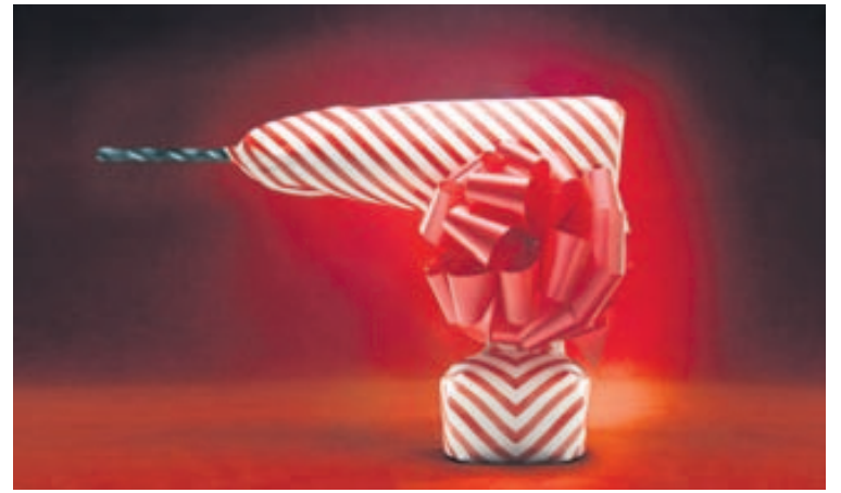
Hafðu í huga hvers konar tilfinningar gjöfin vekur.

6 Ef þér finnst það hins vegar eyðileggja algjörlega spennuna gætirðu beðið hann að nefna til dæmis fimm atriði og velja síðan eitt. Þá veit hann að minnsta kosti ekki hvert þeirra verður undir trénu. www.wikihow.com