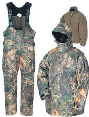
Norfin Expert Camo