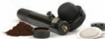
Ferða Espresso Vél