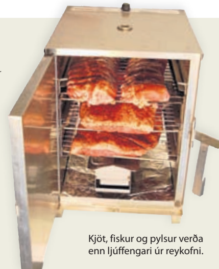
Kjöt, fiskur og pylsur verða enn ljúffengari úr reykofni.

síðan þarf garnir. Hægt er að útbúa pylsur úr svínakjöti, nauta- og lambakjöti og kjúklingi auk þess sem mörgum þykja grænmetispylsur herramannsmatur. Uppskriftir að ljúffengum pylsum má finna í fjölmörgum matreiðslubókum og á netinu. Endalausir möguleikar eru í boði þegar kemur að kryddi og öðru meðlæti. Fyrir metnaðarfullri gæti ostagerð heima fyrir verið skemmtileg áskorun. Hægt er að kaupa byrjendapakka í ostagerð hérlendis sem býður upp á framleiðslu átta ostategunda, til dæmis fetast, kotasælu og pamesanost.