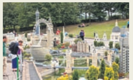
Mini-Lundúnaborg í Legoland í Windsor.

Nánar má skoða ævintýragarðinn hér: www.legoland.co.uk