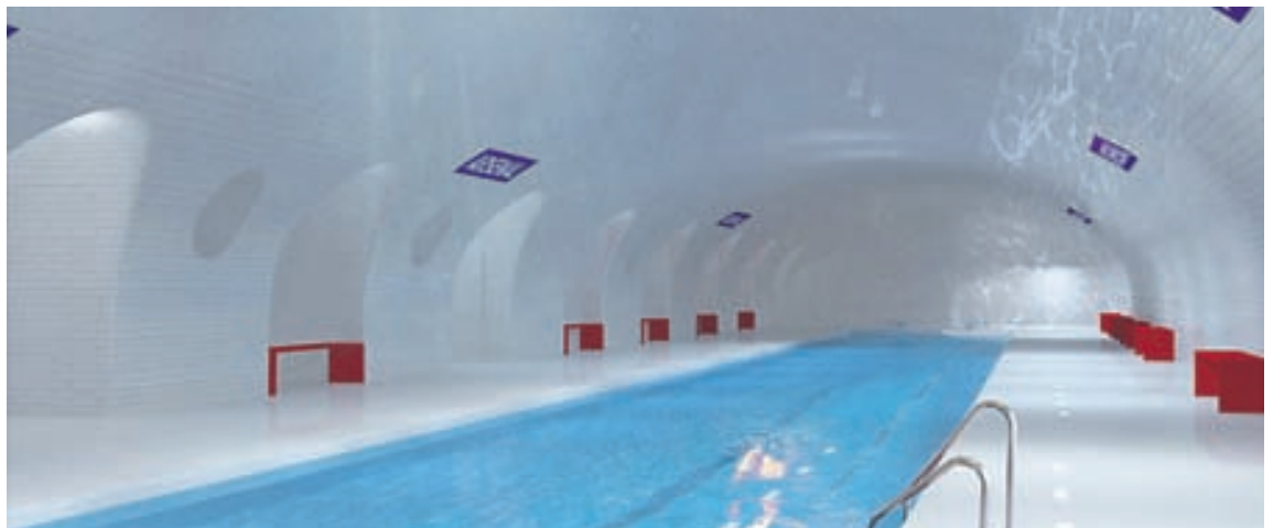
Nýstárleg sundlaug er ein af skemmtilegum hugmyndum sem komið hafa fram.