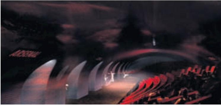
Hugsanlega væri hægt að breyta brautarpöllum í leikhús.