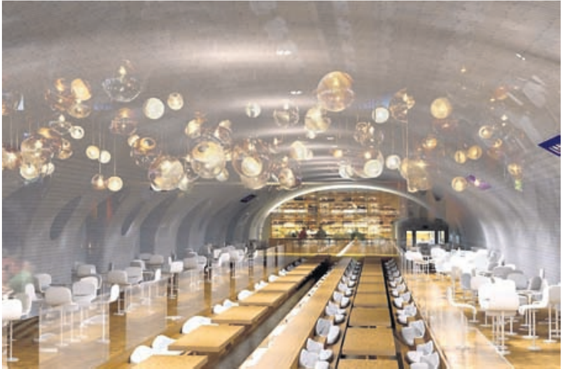
Það gæti verið upplifun að snæða á veitingastað í iðrum jarðar.

MYND/MANAL RACHDI OXO ARCHITECTES AND LOUISE ALEXANDER I