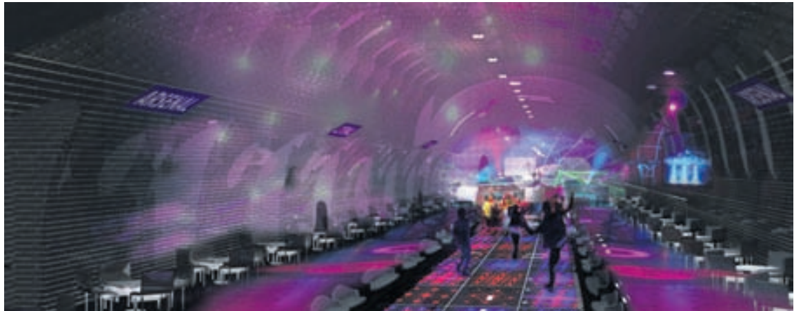
Það væri skemmtistaður með stil sem rekinn væri í yfirgefni jarðlestarstöð.