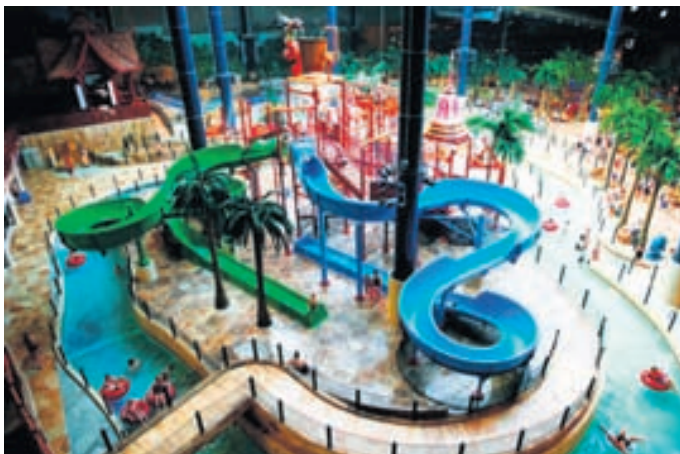
Vatnsleikjagarðurinn í Lalandia er vinsæll. Legoland er risastór skemmtigarður sem býður upp á fjölbreytta afþreyingu.