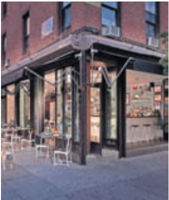
SKÁL, íslenskur staður á Canal Street.

Í dag fer helmingur borgarbúa til vinnu og skóla á reiðhjólum og liggja yfir 400 kílómetrar af skemmtilegum hjólabrautum um alla borg. Reiðhjól eru því kjörinn og dásamlegur ferðamáti þegar farið er um höfuðborg Danaveldis. Fjölfarnasta hjólaleið heims liggur um Dronning Louises-brúna, með yfir 36 þúsund hjólreiðamenn á dag. Önnur fjölfarin hjólaleið er yfir Löngubrú, sem liggur yfir innri höfnina og tengir eyjuna Amager við miðbæ Kaupmannahafnar. Þar er jafnan krökkt af hjólreiðafólki og hvarvetna lífandi og skemmtilegt mannlíf. Þá hefur ný og spennandi hjóla- og göngubrú verið byggð yfir höfnina sem tengir hafnarvæðið við íbúðhverfið Fisketorvet.