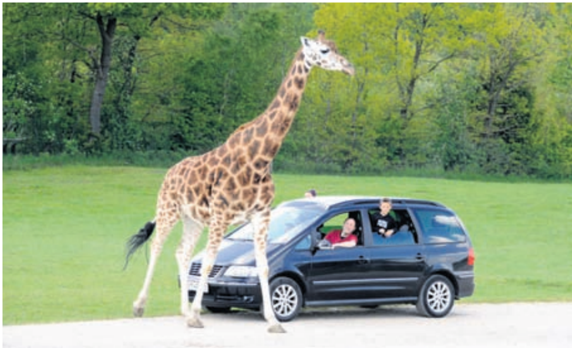
Dýrin ganga frjáls um í Givskud Zoo.

Allar nánari upplýsingar má finna á www.primeraair.com