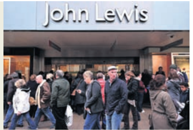
Margt skemmtilegt verður gert í tilefni afmælisins.

Fyrirtækið, sem þénaði 4 milljarða punda á síðasta ári, er að láta gera nýjar sjónvarpsauglýsingar sem tengjast afmælinu. John Lewis byrjaði við Oxford-stræti en rekur nú 41 verslun á Bretlandseyjum. Um 91 þúsund manns starfa hjá fyrirtækinu. Afmælið verður notað til að kynna sögu fyrirtækisins og hvernig það hefur þróast.