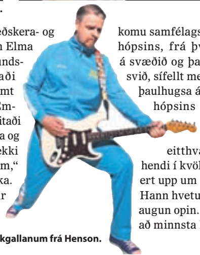
Í Pollapönkgallanum frá Henson.