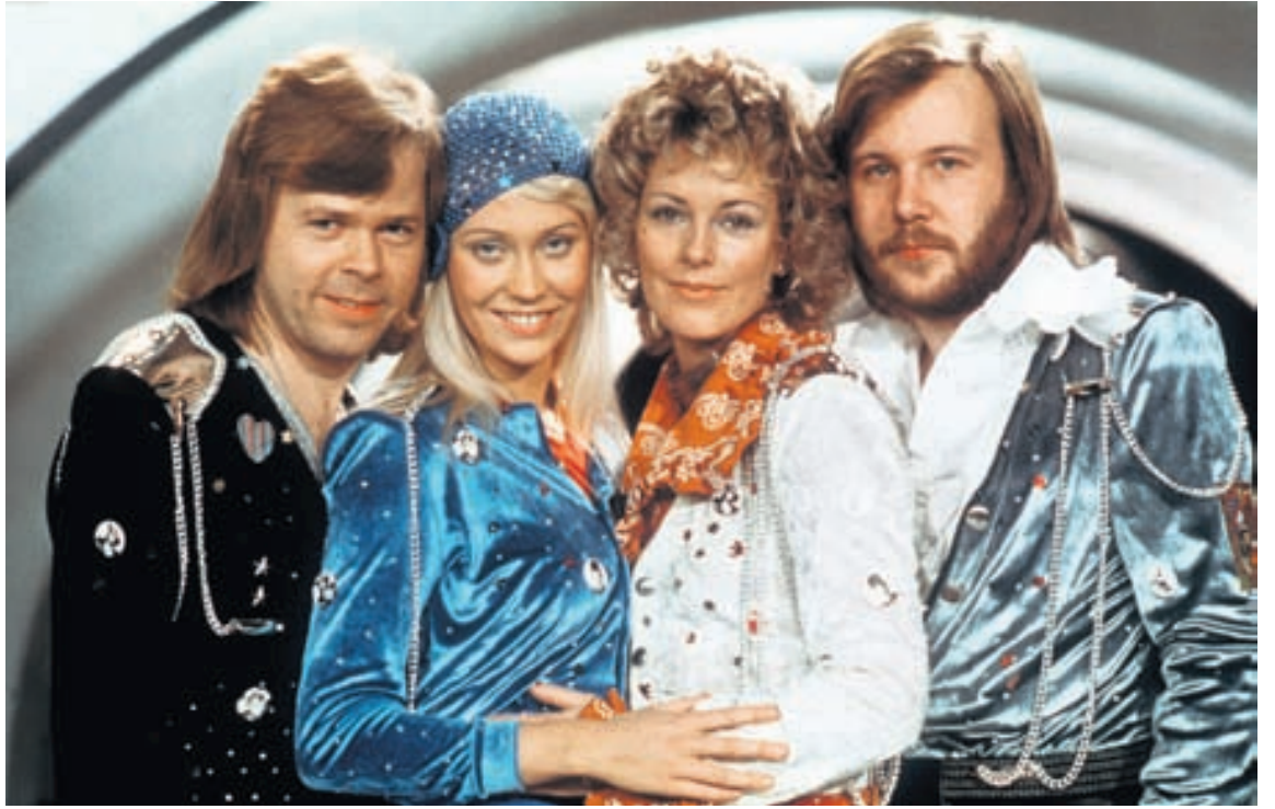
Björn Ulvaeus, Agnetha Fältskog, Anni-Frid Lyngstad og Benny Andersson, Myndin var tekin á úrslitakvöldi Eurovision árið 1974.

Þrjár af fjórum meðlimum Abba hafa sagt í fjölmiðlum að þau gætu hugsað sér að koma saman aftur á sviði. Benny hefur ekki gefið neitt slíkt upp. Ekkert hefur því verið ákveðið í þeim efnum svo vitað sé. Í apríl kom út bók um Abba, The Official Photo Book, í Bretlandi. Bókin kom út í tilefni þess að 40 ár eru liðin frá sigrinum í Eurovision. Einnig kom nýlega út bókina Abba The Backstage stories, þar sem búningahönnuður