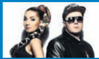
Pólland Atriði Póllands hefur helst vakið athygli fyrir áberandi brjóstaskorur.