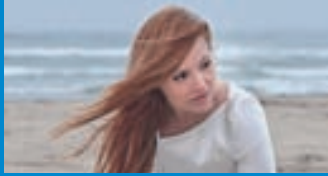
San Marínó Valentina tekur nú þátt í Eurovision þriðja árið í röð. Fyrri tvö árin komst San Marínó ekki upp í úrslitapáttinn.