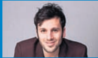
Sviss Hinn 28 ára gamli söngvari og lagahöfundur Sebalter hefur spilað á fiðlu frá sex ára aldri.