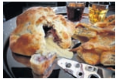
Bakaður Camembert í brauðdeigi með skinku og sultu

veisluhöld. Eftir því sem fjölgar í samkvæminu þarf bara að kaupa stærri ost og meira deig því að uppskrifin er alltaf sú sama.