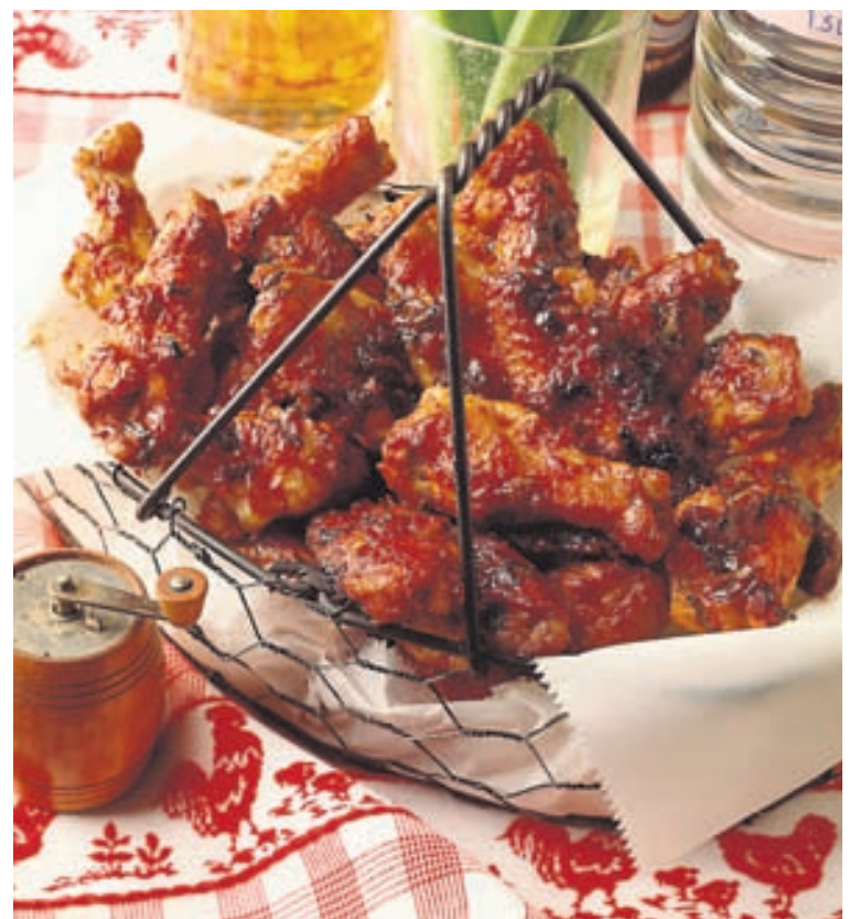
Kjúklingaleggir eru ljúffengir og góðir.