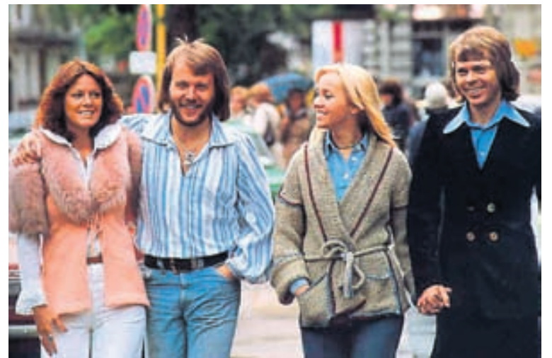
Abba-lögin lifa góðu lífi þótt hljómssveitin hafi hætt snemma á níunda áratugnum.

Svíþjóð hefur verið sigursæl í Eurovision. Fimm sinnum hafa Svíar náð fyrsta sætinu, í fyrsta skipti árið 1974 þegar Abba vann keppnina með Waterloo. Árið 1984 var það Herreys sem bar sigur úr bítum, Carola árið 1991, Charlotte Perrelli árið 1999 og Loreen árið 2012.