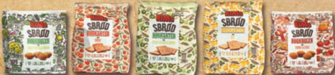
nýir keppendur... spennandi og hollara snakk