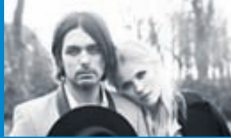
Holland The Common Linnets er skipað Ilse DeLange og Waylon. Þau spila og semja kántrilög.