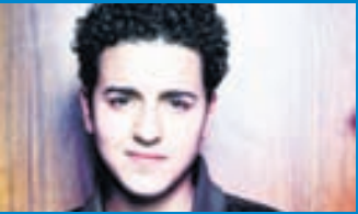
Danmörk Basim er af marokk-óskum uppruna en leggur áherslu á að hann sé Dani enda fæddur og uppalinn í Danmörku.