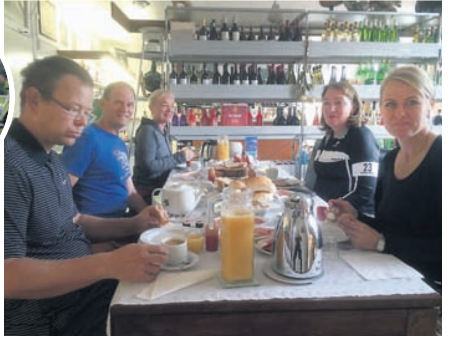
Á einu gistiheimilinu var morgunverðurinn framreiddur milli vínrekka enda vínþúð á neðri hæð gisti-hússins. Þar sátu ferðalangarnir að snæðingi þegar fyrstu viðskiptavinir búðarinnar mættu.

► er mjög stutt á milli þorpa og ekki nauðsynlegt að hjóla langt til að finna næstu gistingu. Það sem kom mest á óvart var hversu fallegt er í Hollandi. Ég hef oft komið til Hollands en mest verið í borgum en ekki mikið í þessum sjávarþorpum sem eru meðfram vatninu. Mikið er um seglskútur og alls konar báta, alls staðar síki og falleg torg í hverjum bæ og allt svo ótrúlega snyrtilegt og fínt.“