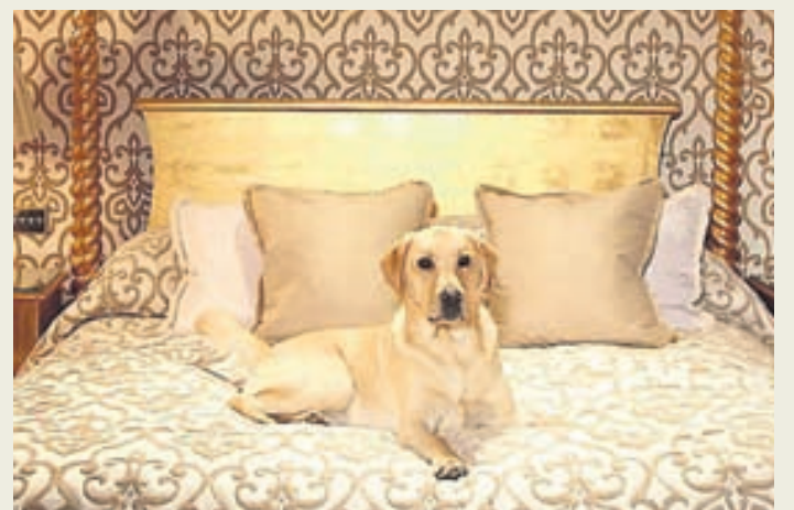
Það fer ekki illa um ferfætlingana á fimm stjörnu hóteli.

„Á þessu hóteli vitum við hversu erfitt það er að skilja gæludýrið eftir heima svo við erum glöð að geta boðið sérstaka gæludýraþjónustu,“ segir á heimasíðunni. Sérþálfað fólk starfar við að aðstoða gesti með gæludýrin sín. Að sjálfsögðu fá dýrin mjúk og góð rúm, teppi og koddar. Þau fá einnig skálar fyrir mat og hreint vatn. Dýrin fá líka sérkort þar sem stendur: „Ekki trufla/dýrið sefur“ sem þjónustufólkið virðir.