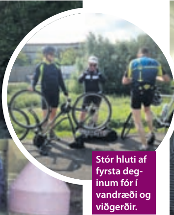
Stór hluti af fyrsta deginum fór í vandræði og viðgerðir.