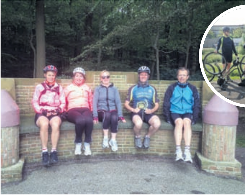
Hópnum fannst tilvalið að stoppa aðeins á þessum steinbekk sem þau komu að til að hvíla sig eftir að hafa hjólað gegnum skóg.