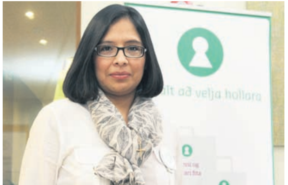
Skilyrði um salt í fisk- og kjötvörum verða að sögn Zulimu innleidd í fyrsta skipti í nýrri reglugerð.

Þar sem Skráargatið telst næringarfullrýðing þarf notkun þess á umbúðum að tilkynnast til Matvælastofnunar. Stofnunin