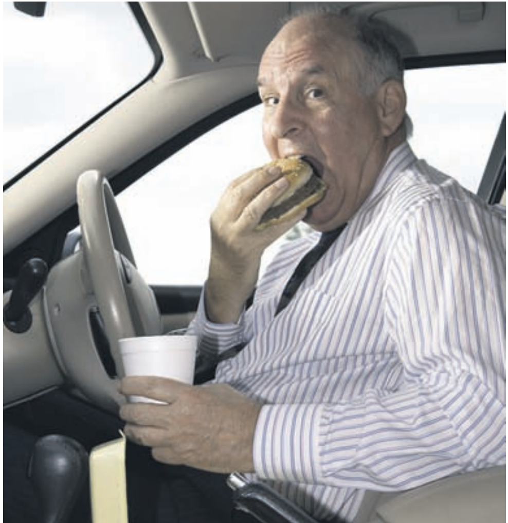
Samkvæmt könnun sem gerð var í Danmörku eru ómenntaðir menn yfir 35 ára í mikilli hættu á að deyja ungir vegna þess að þeir borða óhollan mat.

Skráargatið leiðbeinir fólki við að kaupa holl matvæli. Ekki má merkja matvæli nema þau uppfylli skilyrði sem sett eru varðandi manneldismarkmið. Matvæli merkt með Skráargatinu eru fyrir allan aldur, börn sem fulloröna. Þeir sem þurfa að forðast salt ættu að líta til þessarar merkingar. Mikil neysla á salti eykur hættu á hækkuðum blóðþrýstingi. Fólk með hjartasjúkdóma á að forðast salt í matvælum. Það er því ánægjulegt að skráargatsmerkingum fjölgar.