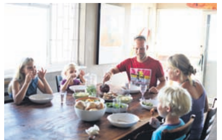
Nauðsynlegt er að skapa heilbriggt og afslappað matarumhverfi fyrir börnin á heimilinu.