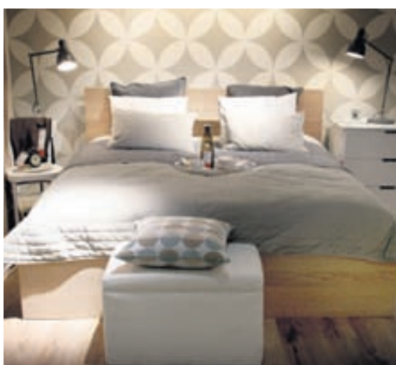
Það er afar persónubundið hvernig dýnu fólk sefur best á og því gott að vanda valið.