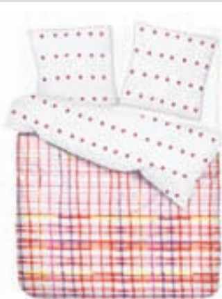
Esprit rumföt 14.900,-

Heimildir: Vísindavefurinn og National Sleep Foundation