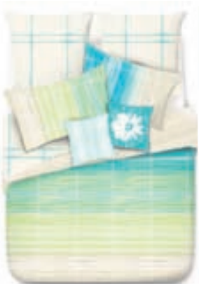
Esprit rumföt 14.900,-