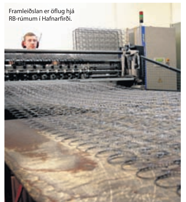
Framleiðslan er öflug hjá RB-rúmum í Hafnarfirði.