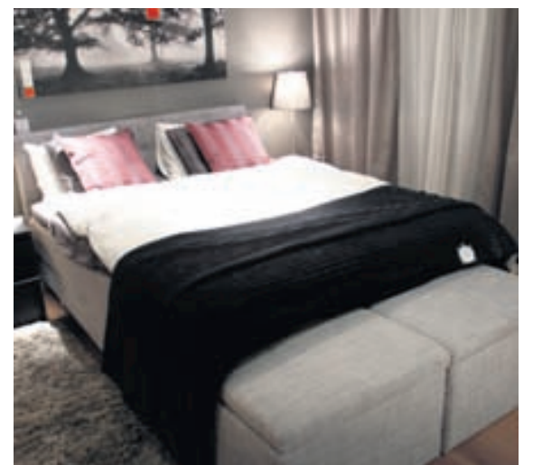
Það er einfalt að skapa stílhreint og notalegt svefnherbergi með því að huga að aukahlutum.