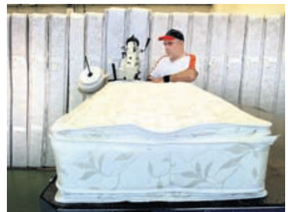
Á síðasta ári seldi RB-rúm hátt í fimm þúsund rúm til hótela og gistihúsa.