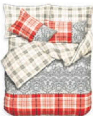
Esprit rumföt 14.900,-