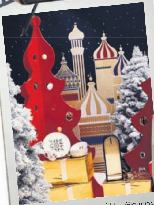
Erum að taka upp jólavörurnar