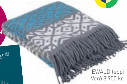
EWALD teppi Verð 8.900 kr.