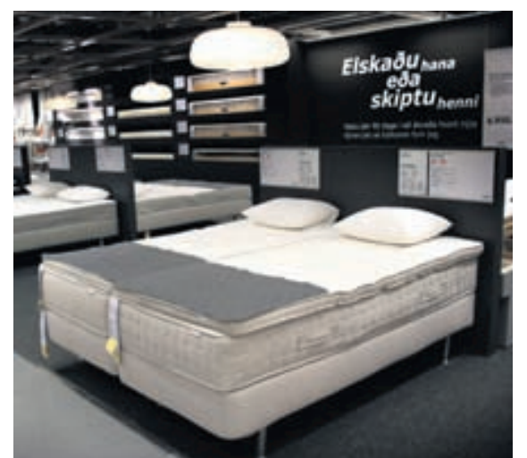
Ef dýnan hentar ekki geta viðskiptavinir skilað henni innan 90 daga og fengið aðra í staðinn.