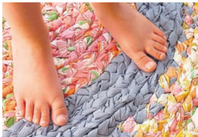
Rúmföt má endurvinnna á ýmsan máta. Þau má til dæmis rífa niður í lengjur og flétta, vefa eða hekla úr þeim þykkar gólfmottur og jafnvel körfur.

Ábendingahnappinn má finna á www.barnaheill.is