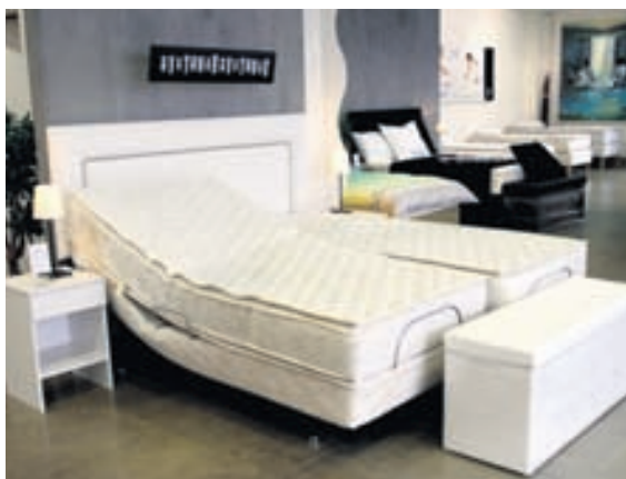
Hjá RB-rúmum eru ekki eingöngu vönduð rúm heldur einnig rúmgöflar, náttborð og rúmfatákistlar.