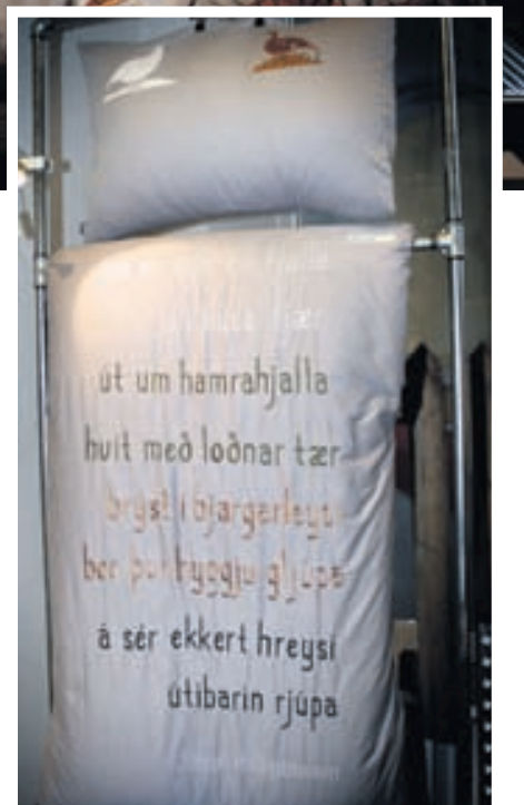
Ljóðlínur eftir íslensk skáld eru bróðeruð í sængurfatnað hjá Lín Design en verslunin hefur lagt áherslu á íslenska hönnun frá stofnun. Verslunin fagnar tíu ára afmæli um helgina með nýrri barnafatalínu.