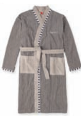
Esprit baðsloppar 13.900,-