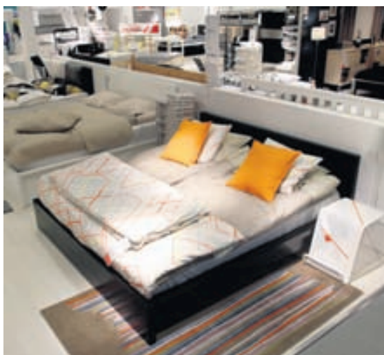
Allir geta fundið rúmgrind í IKEA en úrvalið er breitt og glæsilegt.

Allar nánari upplýsingar um dýnur og rúm frá IKEA má finna á heimasíðu verslunarinnar, www.IKEA.is .