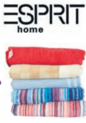
Esprit teppi 14.900,-