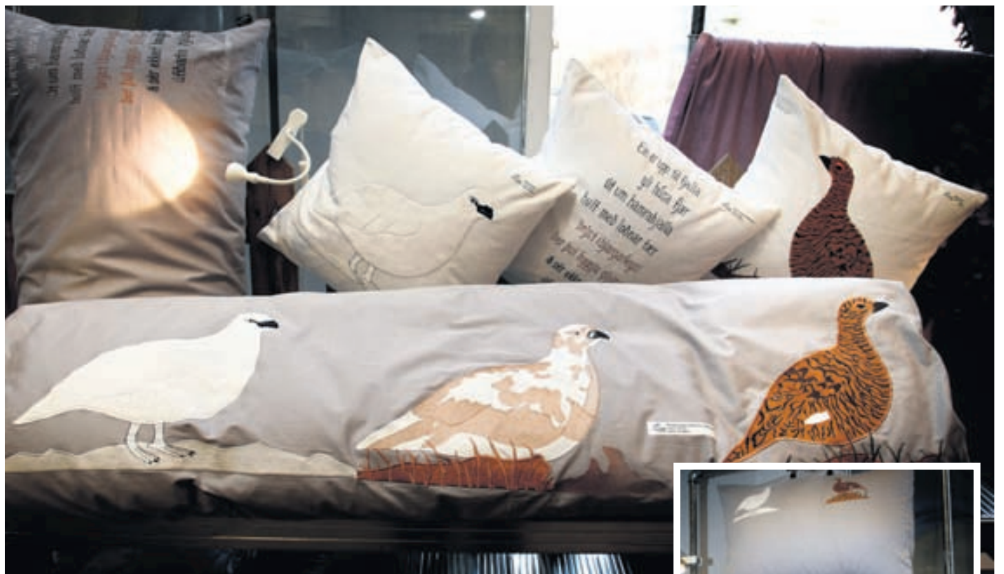
Hjá Lín Design er lögð áhersla á íslenskt dýralíf og náttúru. Í rúmfötin eru til dæmis bróðeraðar myndir af rjúpum.

Fjórar hljóðbækur hafa þegar verið gefnar út á heimasíðu Lín Design og er fimmta bókin á leiðinni. Sögurnar eru spennandi ævintýri þar sem sögupersónurnar eiga það