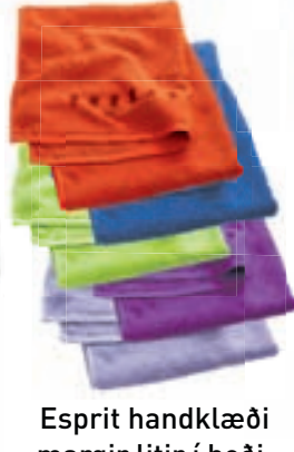
Esprit handklæði margir litir í boði, til í 3 stærðum, verð frá: 1.410,-