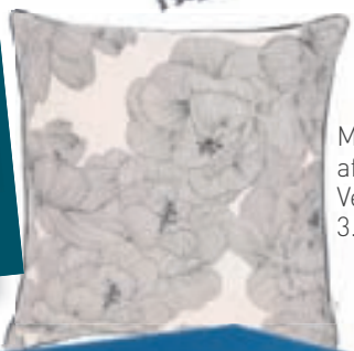
Mikið úrval af púðum Verð frá 3.900 kr.