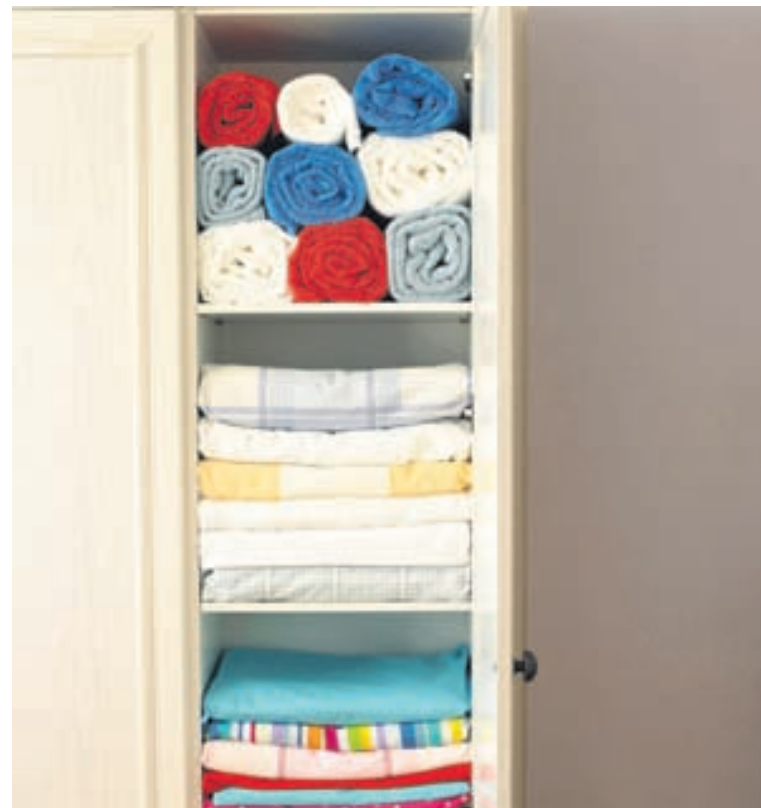
Rúmföt daga gjarnan uppi inni í skáp þegar munstrin detta úr tisku. Í stað þess að þau taki upp geymslupláss mætti sauma úr þeim náttföt.

„Mamma arfleiddi mig að Bernina-saumavél sem hún fékk í arf frá mömmu sinni. Þessi vél er frá því um 1940 eða -50. Ég þurfti aðeins að laga hana en það brotnaði í henni hjól sem ég gat bara pantað á netinu og skipt um. Nú virkar hún fínt. Það væri ánægjulegt ef hún lifði það lengi að ég gæti arfleitt dóttur mína eða son að henni þegar fram líða stundir.“