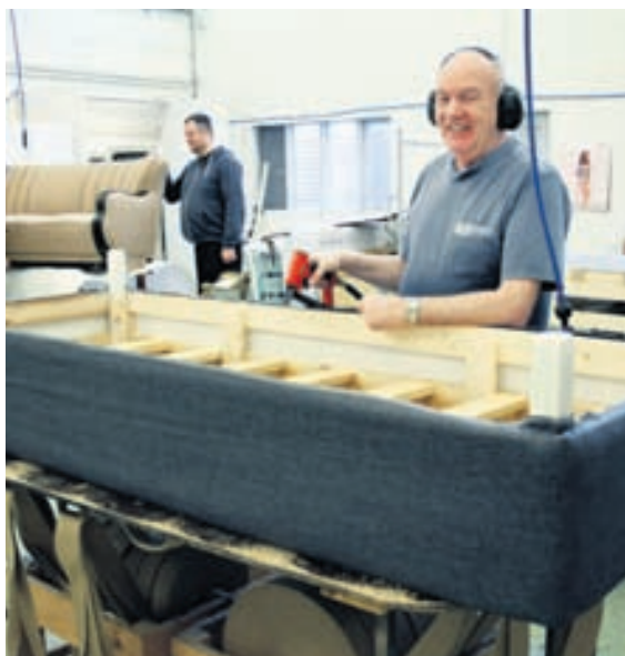
RB-rúm er eina fyrirtækið á landinu sem framleiðir rúm og springdýnur frá grunni.