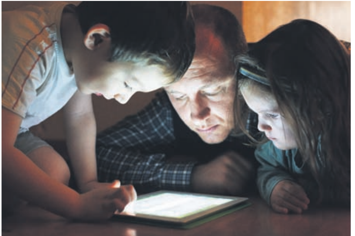
Sífelld fleiri sjónskertir og blindir nýta sér spjaldtölvur og snjallsíma með aukinni tækni.

Talgervillinn er verkefni í stöðugri þróun. Íslensku raddirnar fyrir Windows-stýrikerfi er hægt að nálgast á vefverslun Blindrafélagsins, þeir sem ekki geta lesið með