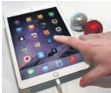
iPad er einfaldur og þægilegur í notkun.

Notkun spjaldtölva í fyrirtækjum hefur aukist mikið upp á síðkastið. „Við sjáum mikinn vöxt í því að stjórnendur fyrirtækja velja að nota spjaldtölvur sem fundarbækur, glósutæki og tæki til að halda utan um minnisþunkta.