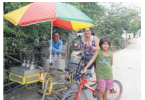
Alls staðar var hægt að stoppa og fá sér hressingu.