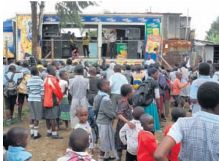
Moldríkur Maltverji kom með stóran flutningabíl með dönsurum og tónlist inn í barnaþorpið.