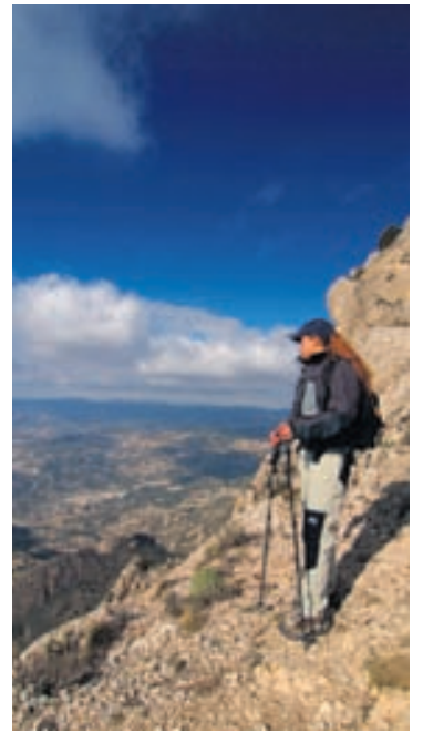
Fjallgöngufólk hefur úr fjölmörgum kostum að velja.

Íbúar svæðisins stæra sig af ferskasta hráefninu, sérstaklega þegar kemur að sjávarréttum,