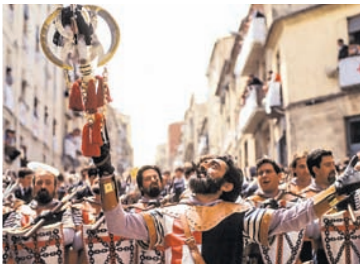
Hátíðin Moros y cristianos, eða Mánar og kristnir menn, er afar hátt skrifuð í Alicante. Gaman er að fylgjast með glæsilegum skruðgöngum.

Nánari upplýsingar má finna á www.vinosalicantedop.org og www.rutadelvinodealicante.com .