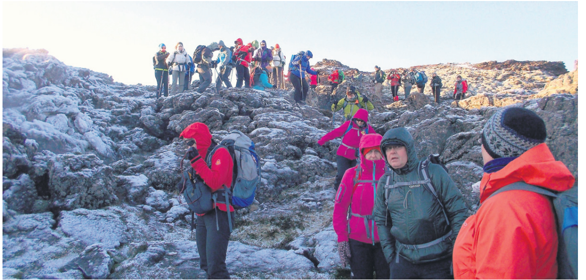
Á gönguleiðinni Reykjavegi á Reykjanesi gefur að líta mjög fjölbreytta og fallega náttúru.

Gönguleiðin inniheldur eðlilega marga hápunkta. „Það er erfitt að draga út fallegustu hluta leiðarinnar en þó er hægt að nefna Sandvíkina, Eldvörpin, Skjónabrekkurnar undir Þorbjarnarfelli, Gálgakletta hjá Hagafelli og leiðina undir Núpshlíðarhálsinn. Einnig er stórkostleg upplifun að standa uppi á Grænavatnseggjum og horfa yfir Sogin í átt að Trölladyngju og Grænudyngju og snúa sér síðan við og horfa yfir Djúpvatn.“