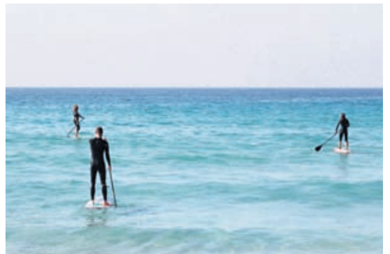
Brettaróður er vinsæl afþreying. Þar stendur fólk á brimbretti og rær áfram með einni ár.

Göngugarpar ættu ekki að eiga í erfiðleikum með að finna afþreyingu á Costa Blanca sem er eitt