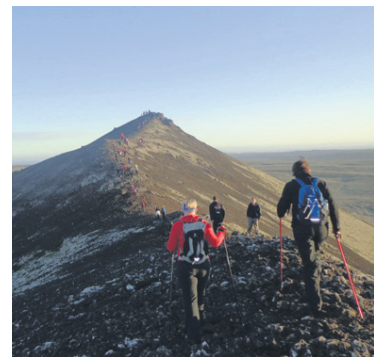
Gengið yfir Núpshlíðarháls á Reykjavegi.

Nánari upplýsingar um Reykjavegin má finna víða, meðal annars á www.ferlir.is .