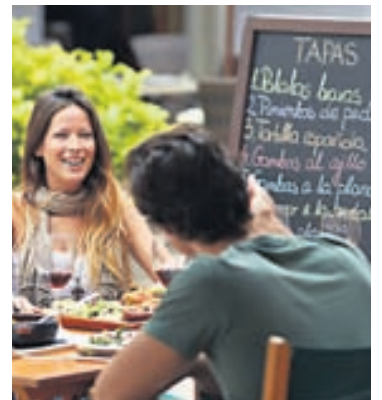
Spænsk matarmenning er heillandi.

enda nóg að hafa meðfram 200 km strandlengju Costa Blanca. Matarmarkaðir eru í nánast hverjum bæ en þar má kaupa osta, kjöt, fisk og bakkelsi.