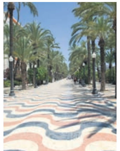
Explanada de España er marmaralögð göngugata meðfram ströndinni í Alicante-borg.