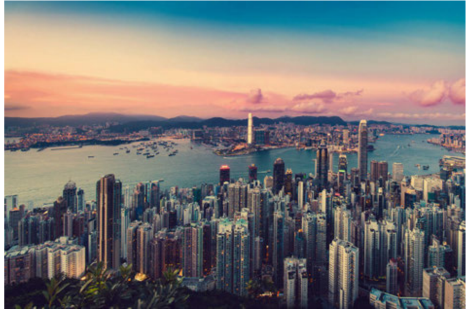
Hong Kong trónir efst yfir mest heimsóttu borgir heims samkvæmt Euromonitor.

5. París í Frakklandi Gestir: 15 milljónir Eiffel-turninn, Louvre-safnið, kaffihúsin og veitingastaðirnir eru á