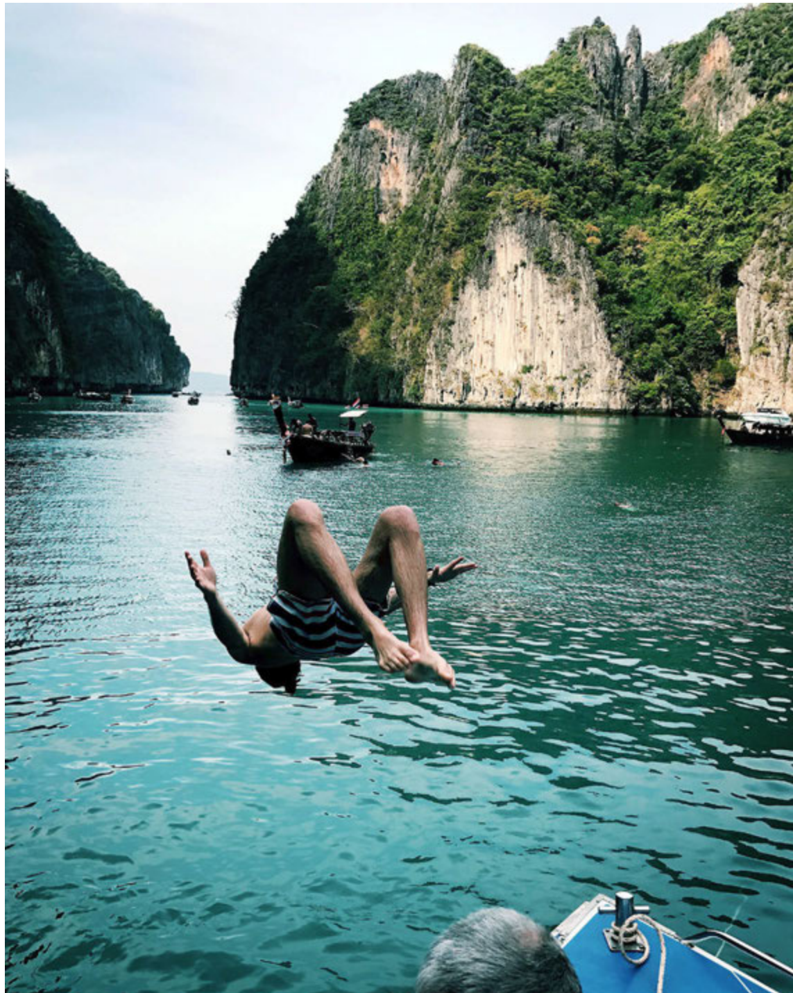
Volgur og fallegur sjórinn freistaði ferðalanganna víða í Asíu.

Ef Balí var skemmtilegur áfangastaður var sá næsti enn skemmtilegri. „Frá Balí flugum við til Fídjíeyja í Kyrrahafi sem er ein mesta paradís sem ég hef séð og án efa fallgasti og skemmtilegasti staður sem við heimsóttum í þessu ferðalagi. Þar fórum við í eyjahopp milli þriggja eyja með hóp af fólki frá öllum heimshornum og eignuðumst einnig góða vini.“