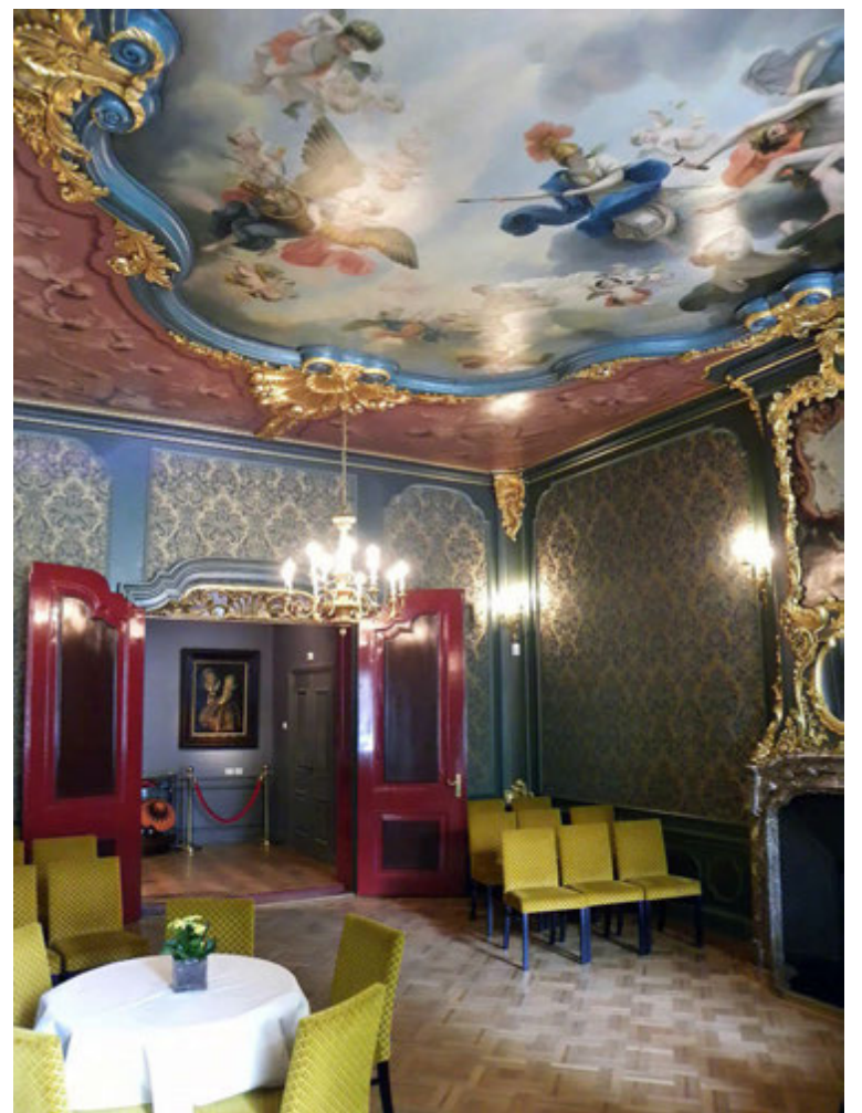
Kaffihúsið er í glæsilegum salarkynnum. Húsið er frá 17. öld og hýsti áður hástéttarfél-skyldur.

Kósi setustofa. Húsið var gert upp og fyrra horfi þess haldið til haga.