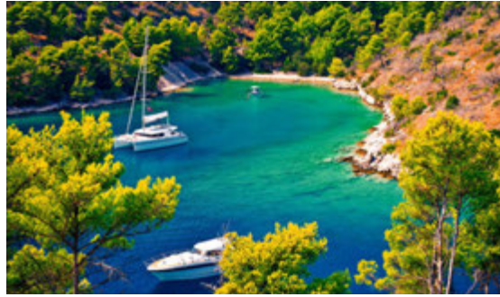
Veðursæld og tær sjór.

Sibenik, skammt frá borginni Split. Söguleg mannvirki eru meðal þess sem hægt er að skoða og einnig merka byggingarlist. Borgin Dubrovnik er þar á meðal en þar hafa þættir af Game of Thrones verið teknir upp. Búlgaría á sér einnig ríkulega sögu.