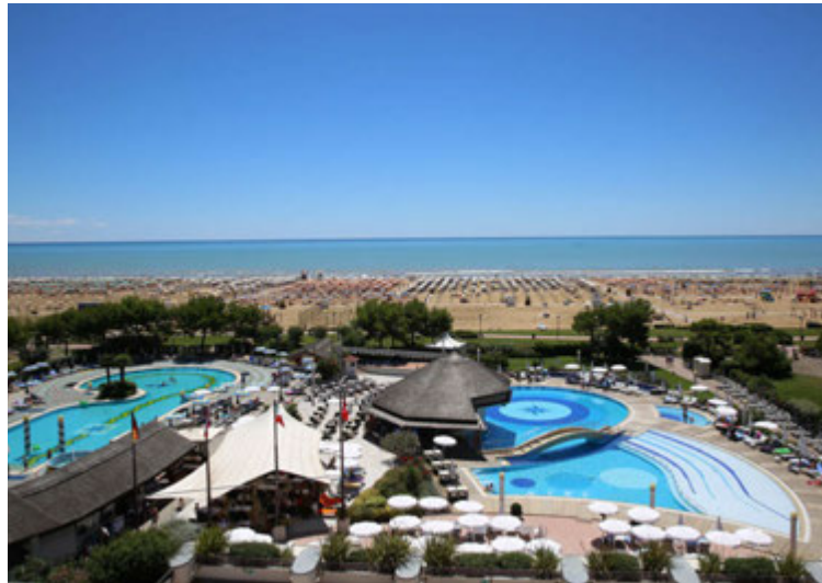
Bibione á Ítalíu er einstök strandperla við norðanvert Adríahafið.

Þeir staðir sem Heimsferðir bjóða upp á eru Kritt, Gran Canaria, Costa de Almería, Albir, Madeira, Mallorca, Costa del Sol, Tenerife, Benidorm, Salou og Altea. Nýjustu áfangastaðirnir eru Bibione á Ítalíu, Króatía og Portoroz í Slóveníu og nú einnig Alicante. „Salan á þessa staði gengur vel enda eru þeir afar spennandi kostir,“ segir Tómas.