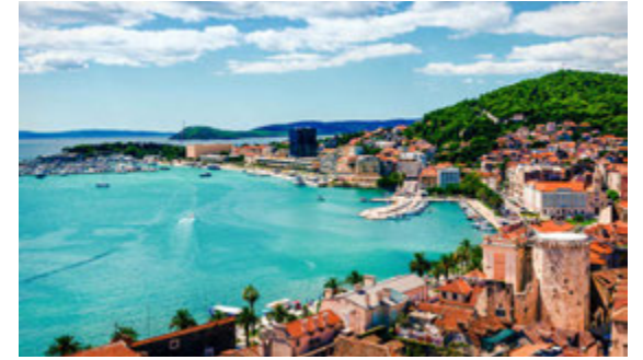
Sjá nánar á www.tripical.is .