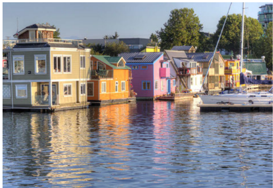
Vancouver-eyja er fallegur staður.

Í Victoríu er Kínahverfi, eitt það elsta í Kanada og N-Ameríku. Um árið 1850 komu þúsundir Kínverja til eyjarinnar í leit að gulli og ríkidæmi. Auk þess komu um 15 þúsund Kínverjar um 1880 til að vinna við lagningu járnbrautar-teina við strönd Kyrrahafsins. Kínahverfið í Victoríu laðar að þúsundir ferðamanna enda þykir það afar sérstakt hvað varðar byggingar og umhverfi. Þar er fjöldi veitingastaða. Á Vancouver-eyju eru nokkur fríðlýst svæði og þjóðgarðar. Sjá má afar sjaldgæf dýr á eyjunni. Lax- og silungsveiði er í ám og vötnum. Eyjan er sú stærsta í Norður-Ameríku og þar er ákaflega milt loftslag. Sitrónu- og ólifutré má sjá þar, rétt eins og við Miðjarðarhafið. Eyjan er einn vinsælasti ferðamannastaður í Kanada.