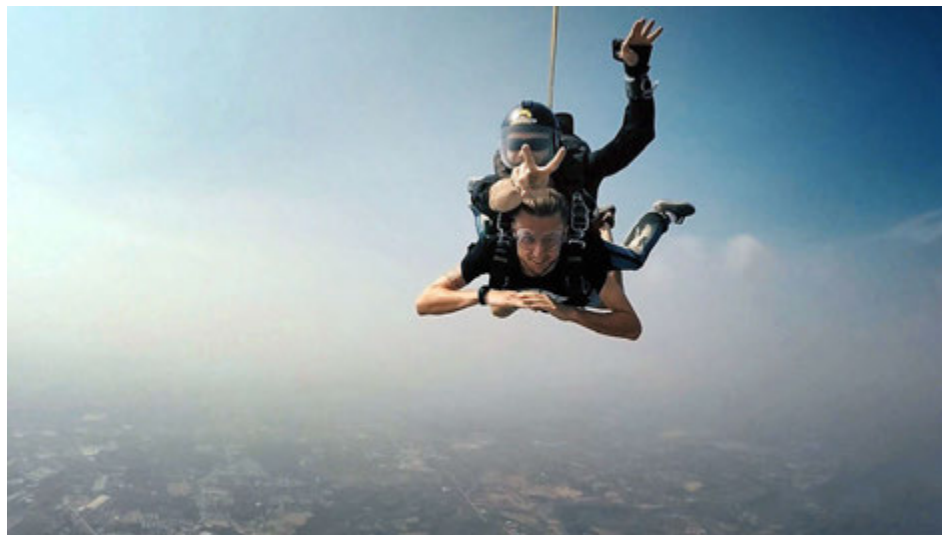
Fallhlífarstökkið var hápunktur ferðarinnar fyrir Sturlu enda er hann afar loftþræddur.