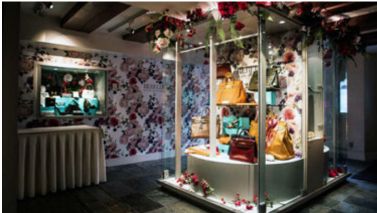
Auk sýningargripa er töskuverzlun með hátískuhönnun að finna í safninu.

Starfsemi safnsins hófst í tveimur herbergjum heima hjá hjónunum en er í dag stærsta safn sinnar tegundar í heiminum.