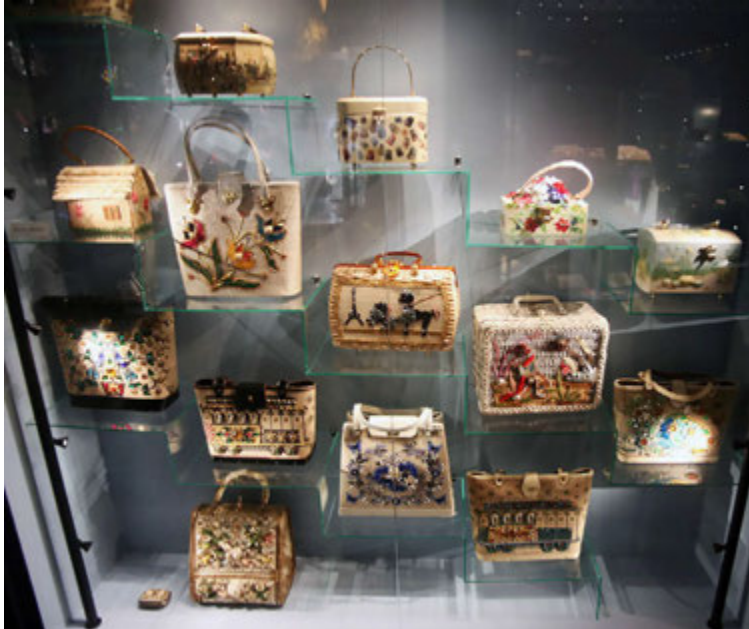
Sögu handtöskunnar eru gerð góð skil á safninu og hún gefur innsýn í lífsstíl Evrópubúa í yfir 500 ár.