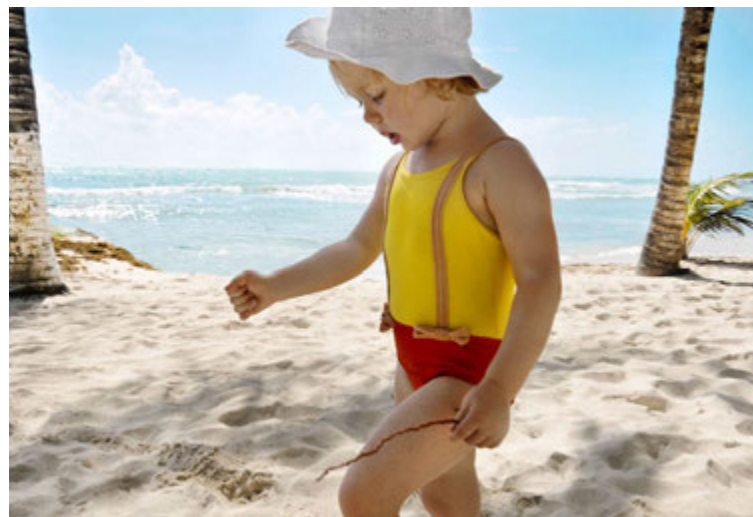
EVY Kids er sérstaklega mild fyrir húð barna og auðvelt að bera hana á.

Engin litarefni, ilm- eða rotvarnarefni er að finna í EVY.