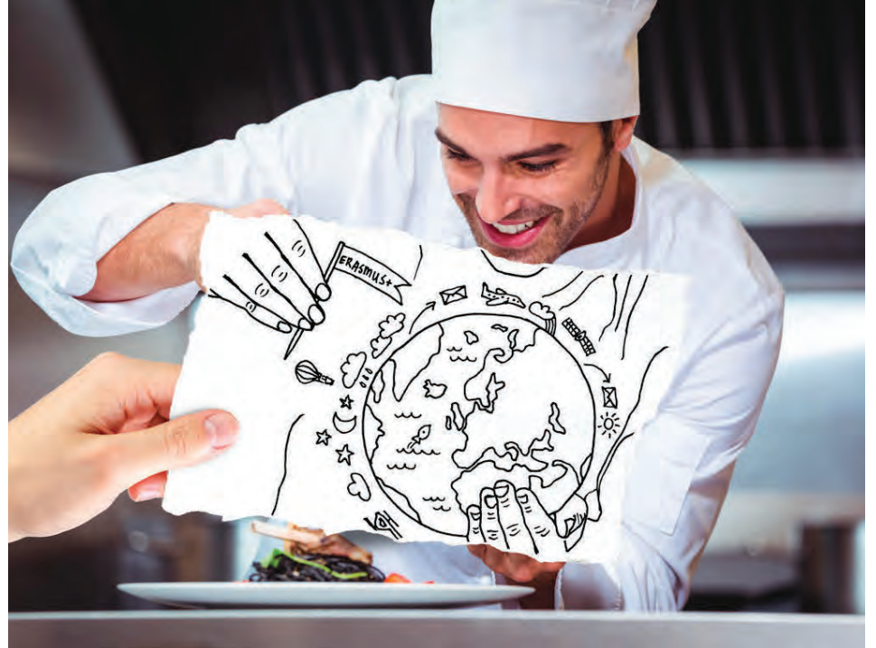
Margir nýta Erasmus+ fyrir starfsnám erlendis með góðum árangri.