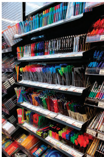
Það er gaman að velja sér ritföng í Pennanum Eymundsson enda úrvalið endalaust spennandi.