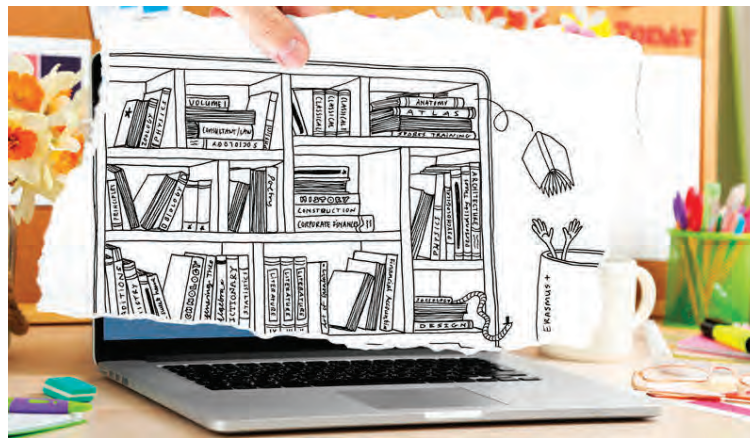
Skiptinám við evrópska háskóla er mjög vinsælt innan Erasmus+.

Erasmus+ er að sögn Ágústs stærsta menntaáætlun heims. „Erasmus+ hóf göngu sína árið 2014 og stendur yfir til ársins 2020.