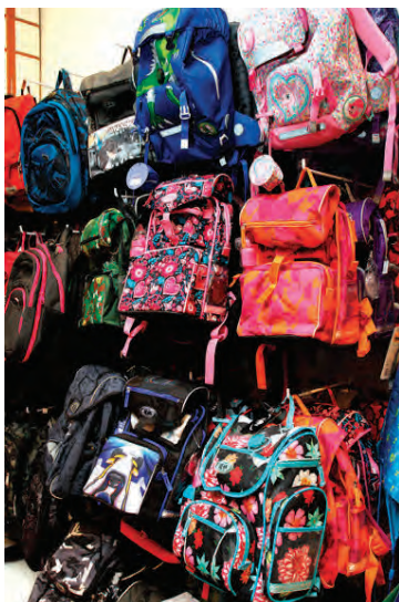
Allir geta fundið draumaskólatöskuna sína í Pennanum Eymundsson, sama á hvaða aldri námsmaðurinn er.