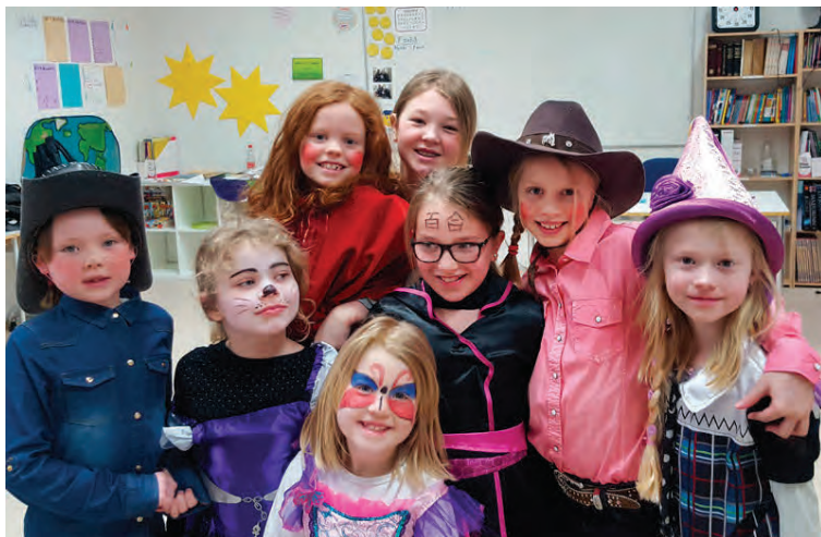
„Fólki getur líka fækkað jafn hratt og því fjölga, ef ein barnmörg fjölskylda flyst í burt fækkar um marga nemendur í skólanum.“