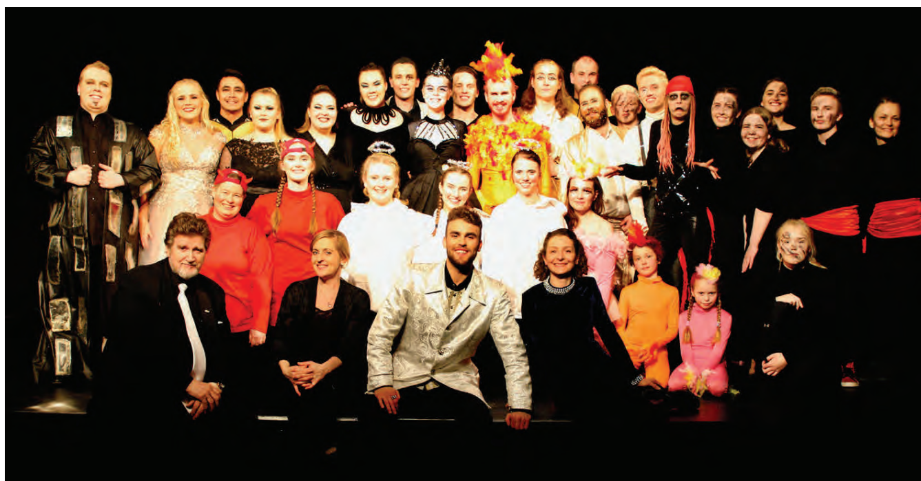
Töfraflautu- hópurinn eftir vel heppnaða sýningu á Ísa- firði.

Söngskólinn er miðsvæðis í Reykjavík og þar iðar nú allt af lífi og hljómar af söng, enda tónleikahald í algleymingi. „Undanfarnar tvær vikur hafa verið haldnir níu loka- og útskriftartónleikar frá skólanum. Stærsta viðfangsefni vetrarins