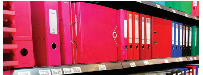
Möppur af öllum stærðum og gerðum halda utan um námsefnið.

börnunum í ævintýrlegu barnahorninu, sem vitaskuld verður á sínum stað í nýju búðinni,“ segir Eygló, full tilhlökkunar.