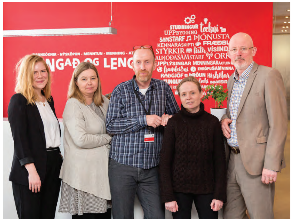
Afmælisnefnd Rannís að störfum en Erasmus+ fagnar 30 ára afmæli í ár.