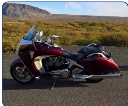
Victory Vision Street árg 2008 ek 55 þús km. Ásett verð 1.670 þús Rnr. 260910