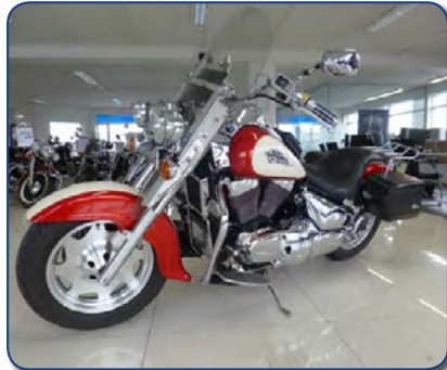
Suzuki VL 1500 árg 1998 ekið 41 þús km Ásett verð 1.200.000 Rnr.251336