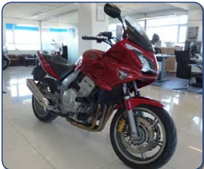
Honda CBF 1000 A árg. 2008 ekið 45 þús km. Ásett verð 680 þús Tilboð Rnr. 251263