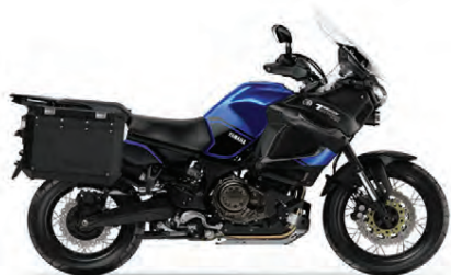
SUPER TÉNÉRÉ RAID EDITION