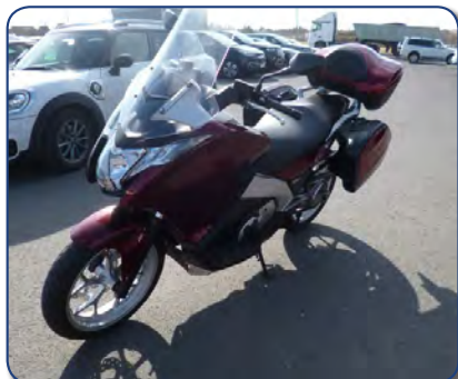
Honda NC 700 Integra árg 2012 ek 1 þús km Ásett verð 1.190.000 Rnr. 271518