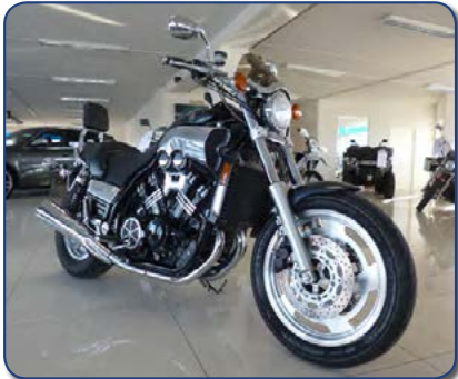
Yamaha V Max árg 2000 ek 32 þús míl. Ásett verð 990 þús Rnr.251274