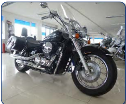
Honda VT 750 C árg 2008 ek 4 þús km Ásett verð 770.000 Rnr. 251329