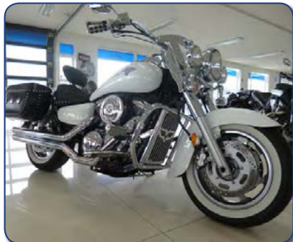
Kawasaki VN 1600 Classic árg. 2003 Ásett verð 1290 þús. Rnr. 251288