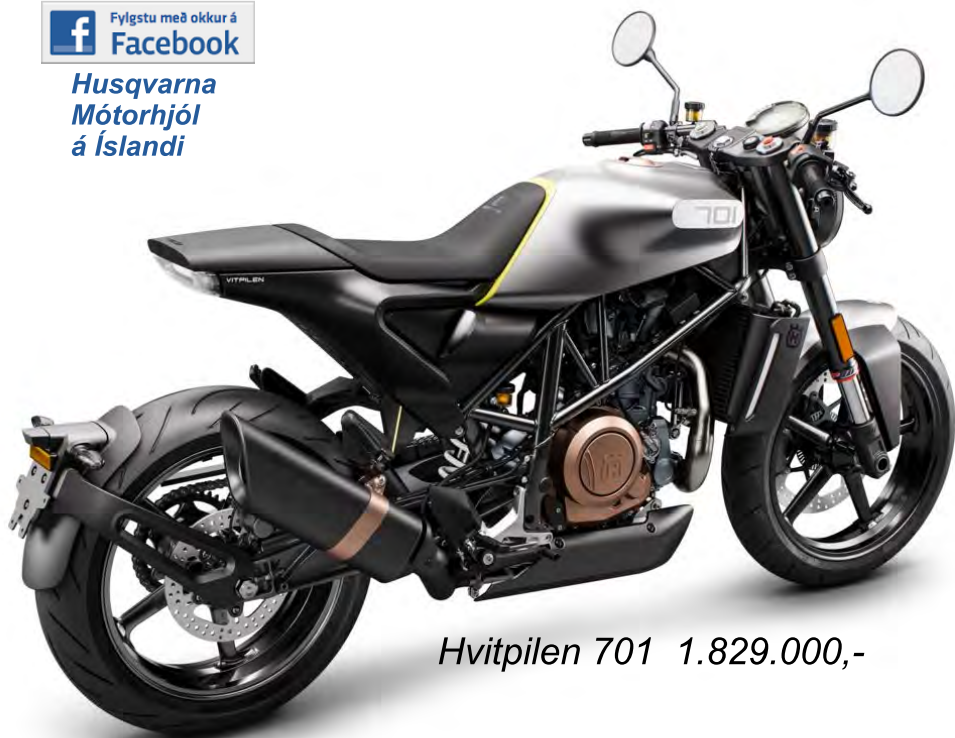
Hvitpilen 701 1.829.000,-