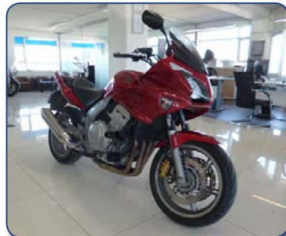
Yamaha FC6 árg. 2007 ekið 20 þús. Verð 790. Þús . Rnr. 250358