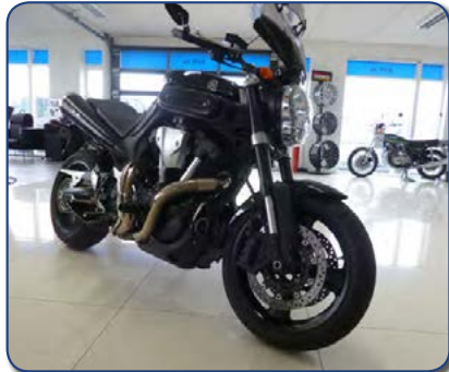
Yamaha MT-01 árg 2008 ek 12 þús km Ásett verð 1.240.000 Rnr.271549