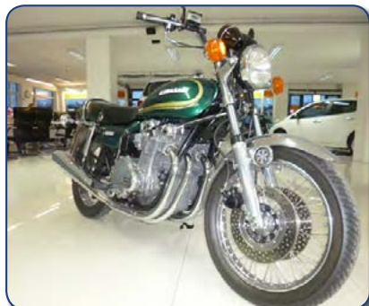
Kawasaki Z 1000 árg 1980 ek 56 þús Ásett verð 1.650.000 Rnr. 251067