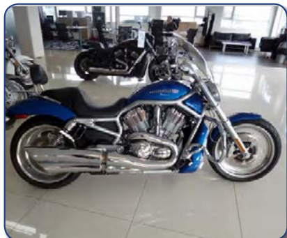
Harley Davidson V-ROD árg 2007 ek 8 þús km Ásett verð 1.550.000 Rnr. 130201