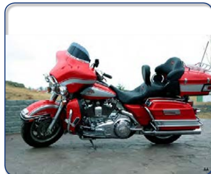
Harley Davidson Ultra Classic ek 245 þús km Ásett verð 2.990 Rnr.271514