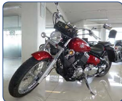
Yamaha V-Star 650K árg 2006 ek 8 þús m Ásett verð 650.000 Rnr. 251253