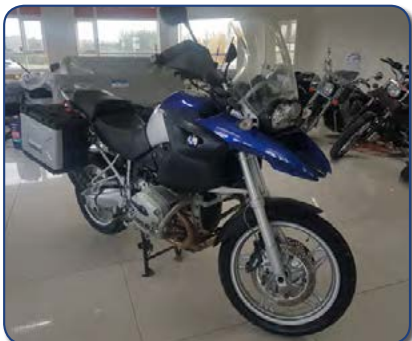
BMW R1200 Árg. 2007 ekið 46 þús Verð 1490 þús. Rnr. 271126