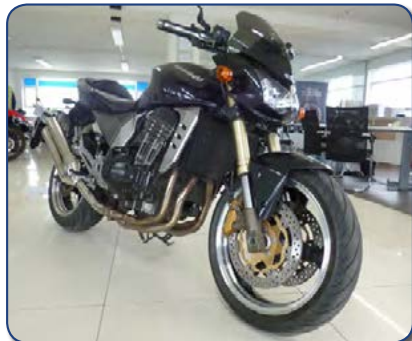
Kawasaki Z 1000 árg. 2004 ekið 37 þús. km. Ásett verð 590 þús. Rnr. 271508