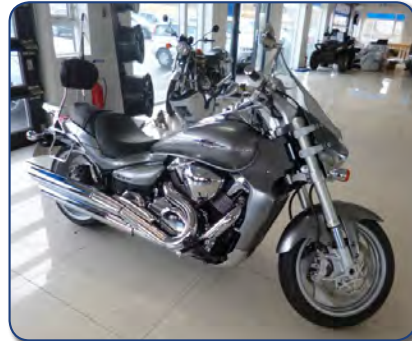
Suzuki VZR 1800 árg 2009 ek 16 þús Ásett verð 1.650.000 Rnr. 251314