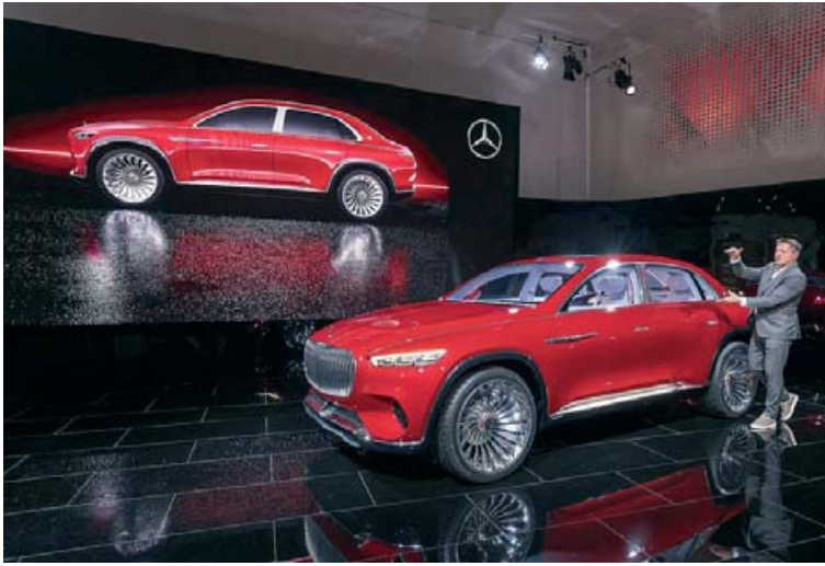
Mercedes-Maybach Ultimate Luxury var frumsýndur í Peking í síðustu viku.