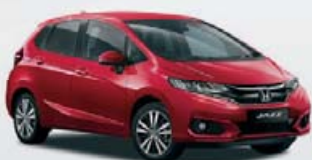
Honda Jazz verð frá kr. 2.540.000

Honda Civic er bíll sem er allt annað og meira. Hann er sérstaklega fyrir þig, fjölskylduna og áhugamálin. Hann endurspeglar metnað okkar fyrir öryggi og tæknilegum yfirburðum. Staðalbúnaður í Civic er radartengdur skriðstillir, árekstrarvari, akgreinaaðstoð og handfrjáls símabúnaður svo dæmi séu tekin. Civic er skemmtilegur að aka, öruggur og áreiðanlegur með pláss fyrir flest, þó sérstaklega – þig og þína! Fullkomin blanda af krafti, sparneytni og gæðum. Komdu í heimsókn og prófaðu Honda Civic meira af okkar besta til þessa.