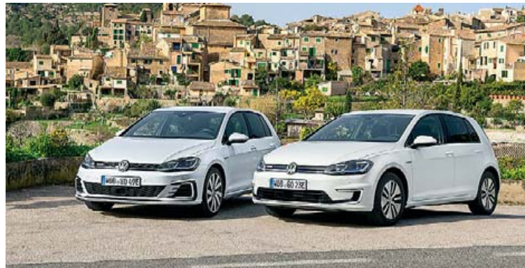
Volkswagen e-Golf og Golf GTE hafa selst vel á árinu.

Þegar teknar eru saman tölur um vistvænna bíla sem seldir hafa verið hingað til á árinu sést að Hekla hefur selt 523 af samtals 827 slíkum bílum og nemur það 63,2% hlutdeild. Næst þar á eftir er Brimborg með 109 bíla og 13,2% hlutdeild og þá BL með 101 bíl og 12,2% hlutdeild. Askja hefur selt 81 slíkan bíl og er með 9,8% hlutdeild og Bílabúð Benna 8 og er með 1% hlutdeild. Þegar talað er um vistvænna bíla er átt við bíla sem ganga fyrir íslenskri orku/andurnýjanlegum orkugjöfum eins og metani og rafmagni þar sem hægt