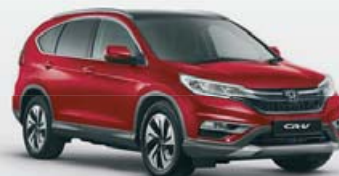
Honda CR-V verð frá kr. 4.840.000