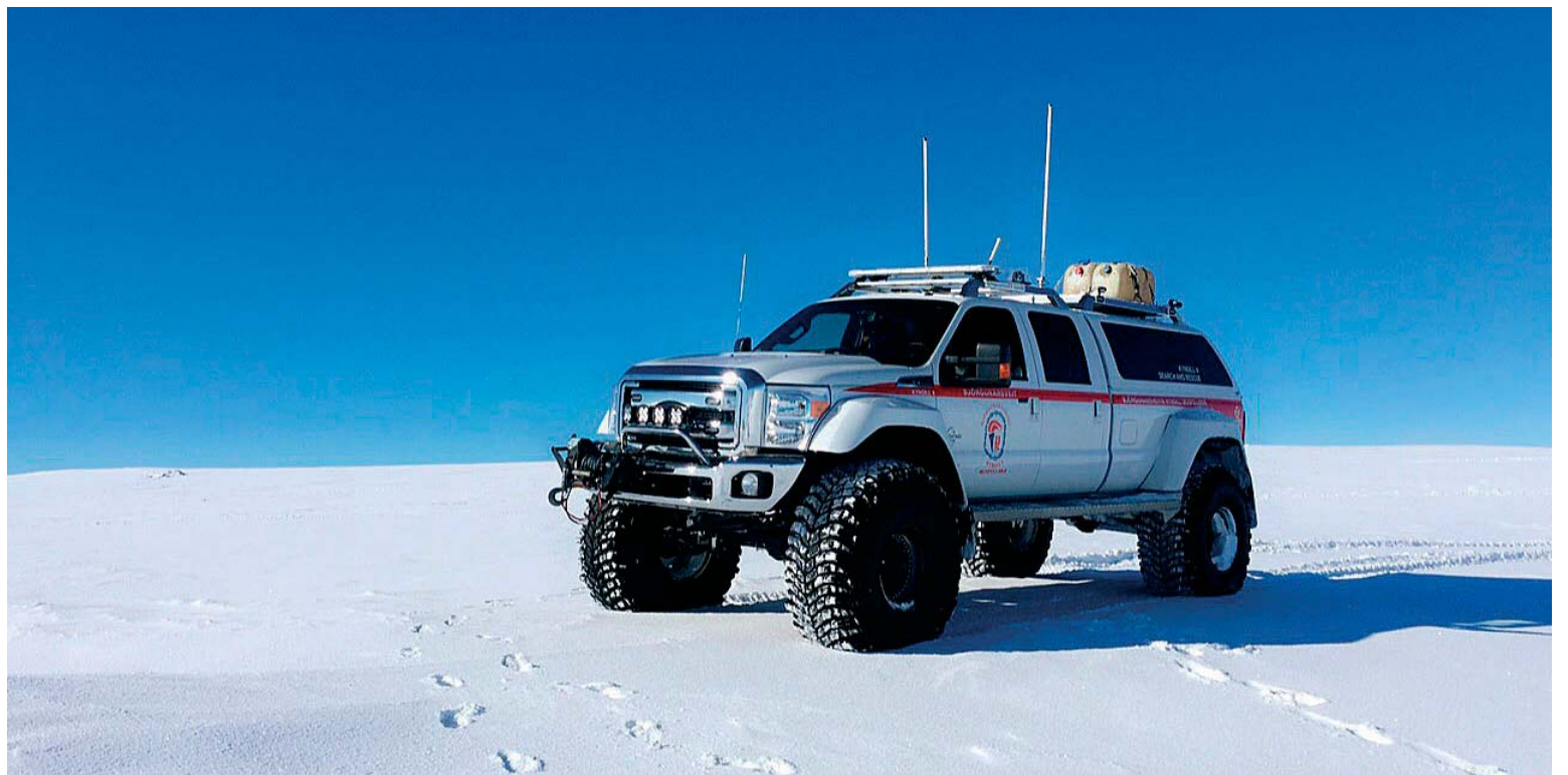
Í bílnum eru nokkrir aukaeldsneytistankar og tekur bíllinn í heild yfir 500 lítra af olíu.

Nissan Motor ætla að stórauka framleiðslu á bílum með rafmótor, meiri ökuáðstoð og háþróaðri snjalltækni. Markmiðið er að um mitt ár 2022 verði búíð að afhenda eina milljón slíkra nýrra bíla, bæði 100% rafbíla og bíla með rafmótor og annan afgjafa. Bæði Renault og Mitsubishi munu njóta góðs af áætlun Nissan. Von er á átta nýjum 100% rafbílum sem byggðir verða á grundvelli tækninnar í Leaf en einnig öðrum sem verða sérstaklega sniðinir að þörfum markaðanna í Kína og Japan. Þá er einnig von á aldrifnum sportjeppa í ætt við hugmyndabílinn IMx Kuro sem kynntur var í Genf í mars. Nissan gerir ráð fyrir að 40% nýrra bíla fyrirtækisins í Japan og Evrópu verði rafdrifnir árið 2022 og að hlutfallið verði komið í 50% árið 2025. Í Bandaríkjunum gerir fyrirtækið ráð fyrir að hlutfallið verði 20-25% árið 2025 en 35-40% í Kína.