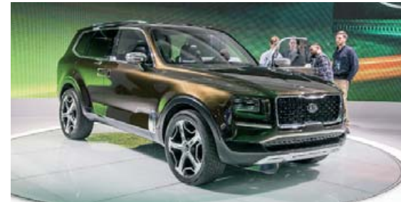
Kia Telluride verður átta sæta stór jeppi.

heil sætaröð fyrir aftan þau. Búist er við því að 3,3 lítra V6-vélin sem finna má í Kia Stinger verði í boði í jeppanum, en vafalaust fleiri vélarkostir. Í Stinger er þessi vél 370 hestöfl. Ekki er ljóst hvenær Kia stefnir á að koma með Telluride á markað en heyrst hefur að hann muni fá systurbíl frá Hyundai sem fá muni nafnið Palisade. Það er ekki að spyrja að Kia og Hyundai, vart er til sá bíll frá öðru fyrirtækinu sem ekki er til með öðru nafni og lítt breyttu sviði með nafni hins merkisins.