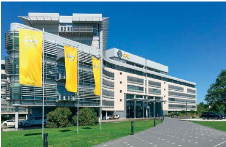
Höfuðstöðvar Opel í Rüsselsheim í Þýskalandi.

hreinræktaður rafmagnsbíll og það verða engar aumingjaraflöður í bílnum, en hann mun skarta 738 hestöflum sem send verða til allra hjóllanna. Samtals eru rafhlöðurnar 80 kWh og drægi bílsins á fjórða hundrað kílómetrar. Bíllinn verður mjög snarpur með allt þetta afl og hámarkshraðinn takmarkaður við 250 km/klst. Með jeppanum mun fylgja 350 kW hraðhleðslustöð þar sem hlaða má hann allt að 60% hleðslu á aðeins 5 mínútum. Ekki fylgir sögunni hvenær Mercedes Benz ætla að koma með þennan bíl á markað. Það bendir til þess að ekkert verði til sparað við frágang bílsins, enda ekki annað hægt ef hann á að bera Maybach-merkið. Bíllinn er ekki með bekk aftur í heldur eru 4 eins sæti í honum svo að ekki ætti að fara verr um aftursætisfarþegana en framsætisfarþega og hefur Mercedes Benz örugglega haft bílamarkaðinn í Kína þar í huga þar sem ofurríkir bílkaupendur þar í landi láta iðulega aka sér í rándýrum bílum sínum og sitja makindalega aftur í.