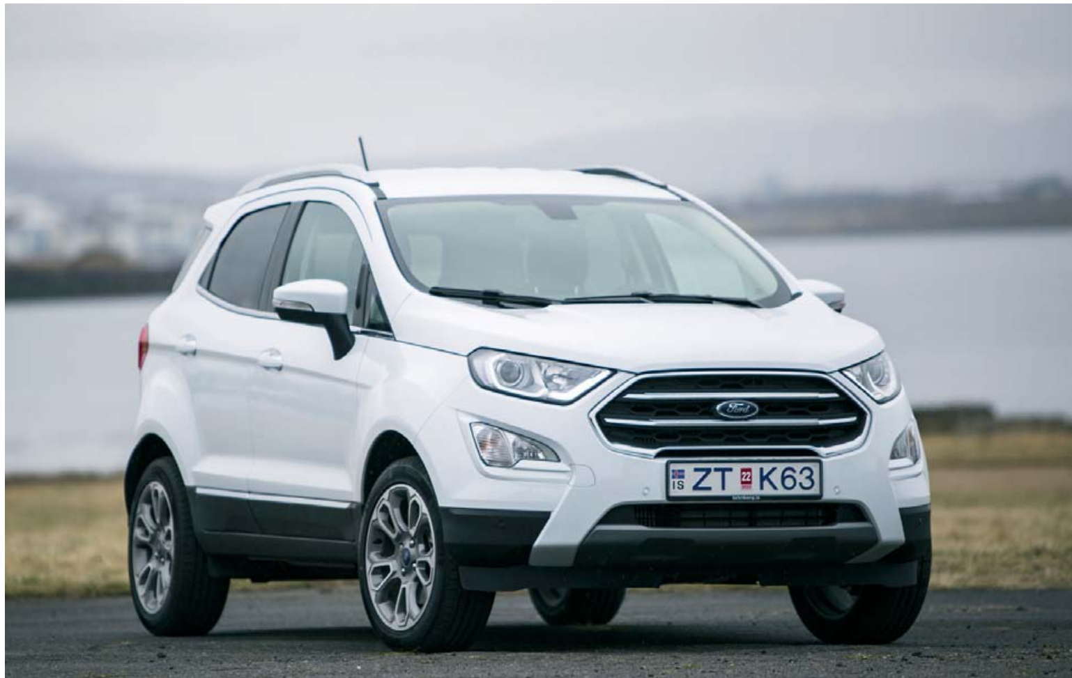
Ford EcoSport er í raun háfætt útgáfa af Ford Fiesta

Nokkrar jákvæðar breytingar voru gerðar á bílnum árið 2015 og enn meiri með 2018 árgerðinni og er bíllinn orðinn meira aðlaðandi en ef til vill hefðu brýnustu breytingarnar átt að vera hvað varðar ytra útlit hans. Bíllinn hefur með þessum breytingum orðið mun aksturshæfari þó svo hann nái alls ekki aksturshæfni Fiesta-bróðurins. Betri einangrun, betri fjöðrun og bætt stýring bílsins hefur lagað hann mikið, en hann virkar samt of þungur að ofan fyrir undirvagn sinn. Ford EcoSport er boðinn hér á landi með 1,0 lítra bensínvél í 125 og 140 hestafla útfærslum. Í sinni ódýrustu útfærslu kostar hann aðeins 2.750.000 kr. með beinskiptingu, en með 140 hestafla útgáfu hans kostar hann 3.290.000 kr. og þá í ST-line útgáfu. Sjálfskiptur er hann ódýrastur á 3.350.000 kr. með 125 hestafla vélinni en í ST-Line útgáfu á 3.490.000 kr. Ekki telst þetta hátt verð fyrir ágætlega útbúinn bíl. Akstur EcoSport er alveg ágætur innanþæjar og hætt er við því að þannig sé hann mest notaður þó veghæð hans bjóði upp á örliðið meiri vegleysur en