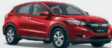
Honda HR-V verð frá kr. 3.870.000