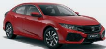
Honda Civic verð frá kr. 2.990.000