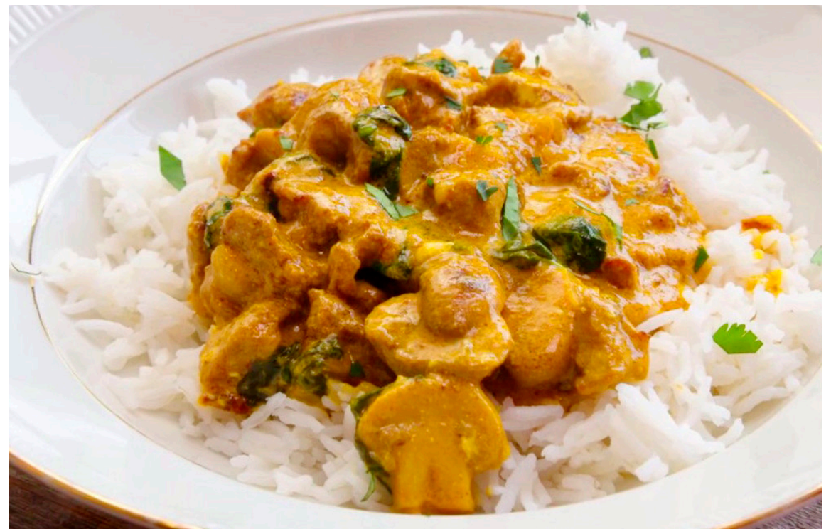
Lambakarrý með sveppum og spinati bregst ekki á virku kvöldi.