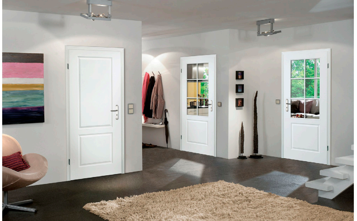
Hljóðvist er mikilvæg í daglegu lífi og ekki síst þegar velja á innihurðir á heimili, hótél eða vinnustað.

Hurðirnar hjá Agli Árnasyni er hægt að fá í um 30 mismunandi tegundum með viðar-áferðum og harðplasti sem býður upp á mikla breidd í litum og áferð.