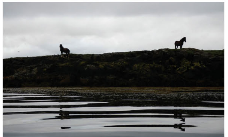
„Mér finnst erfitt að fara frá dóttur minni núna þegar hún er svona lítil.“

Fólk er kynningarblað sem býður auglýsendum að kynna vörur og þjónustu í formi viðtala og umfjallana. Í blaðinu er einnig hefðbundin ritstjórnarefni. Blaðið fylgir fréttablaðinu daglega.