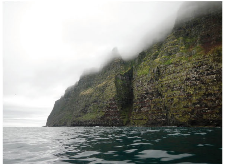
„Sama hvar ég kom að landi þá var mér tekið eins og týnda syninum sem væri kominn heim aftur. Það var alveg magnað.“