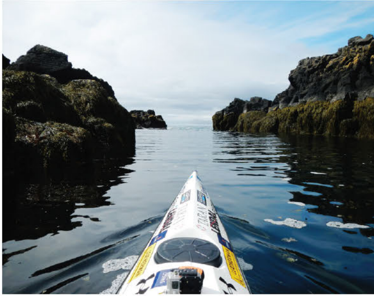
„Besta æfingin fyrir svona ferð er einfaldlega að róa mikið, oft og lengi.“

Guðni reiknar með að þeir félagar muni róa allt frá 40 km og upp í 100 km á dag. „Meðalróðurinn verður sennilega um 60 km á dag en það