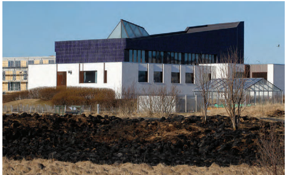
Þema apríl er 1960+, í maí er það 1970+.

Starfsfólk Norræna hússins hvetur þá sem eiga minningar úr húsinu til að deila þeim: „Ef þú ert einn af þeim sem eiga minningar úr Norræna húsinu hvort sem þær eru skemmtilegar, alvarlegar, spennandi eða vandræðalegar viljum við gjarnan fá að heyrja þær. Við viljum einnig taka söguna þína upp á myndband svo hún geti lifað áfram í skjalasafni hússins og orðið hluti af lifandi sögu hússins. Vel valdar sögur munu svo verða hluti af afmælissýningu Norræna hússins á næsta ári.“