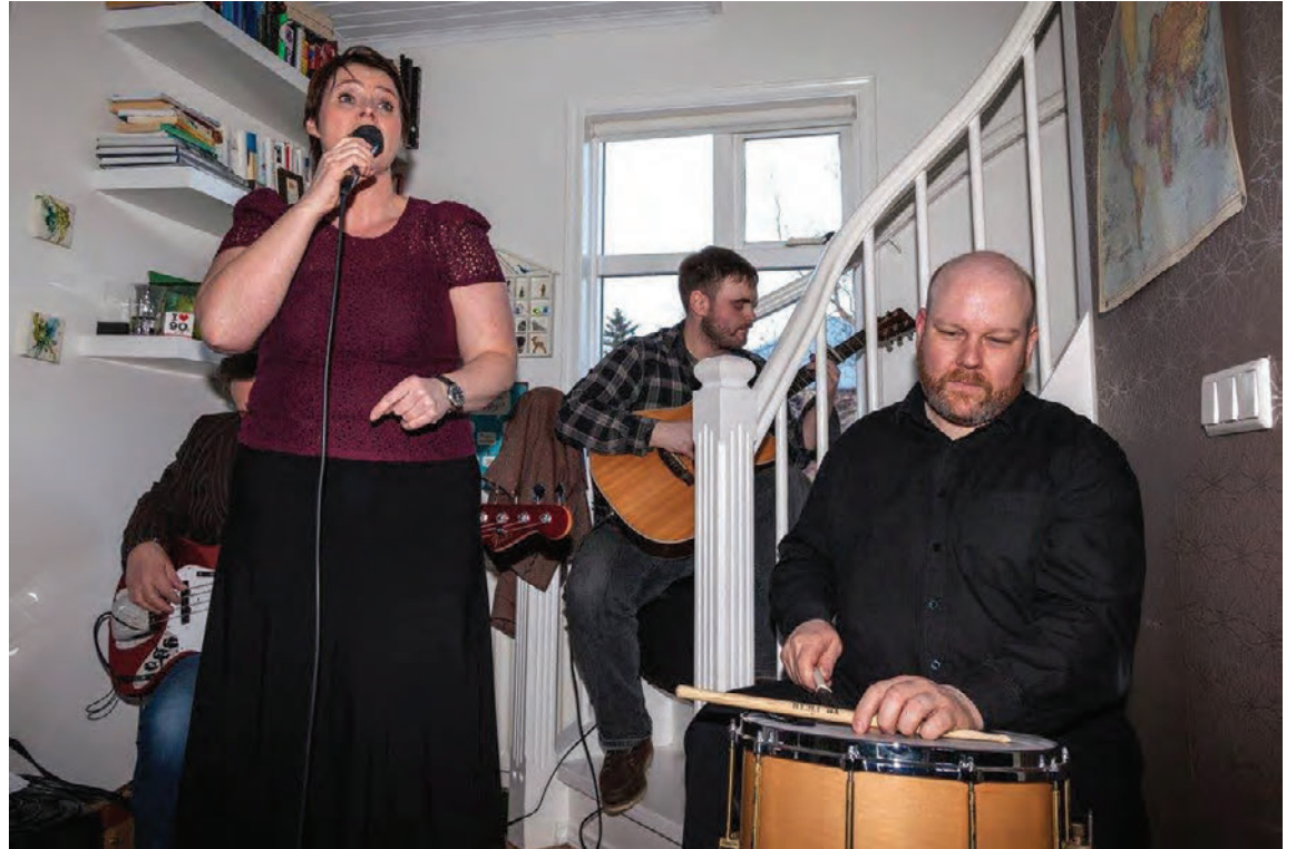
Listamenn koma sér fyrir á ólíklegustu stöðum, t.d. við stiga heimilisins.